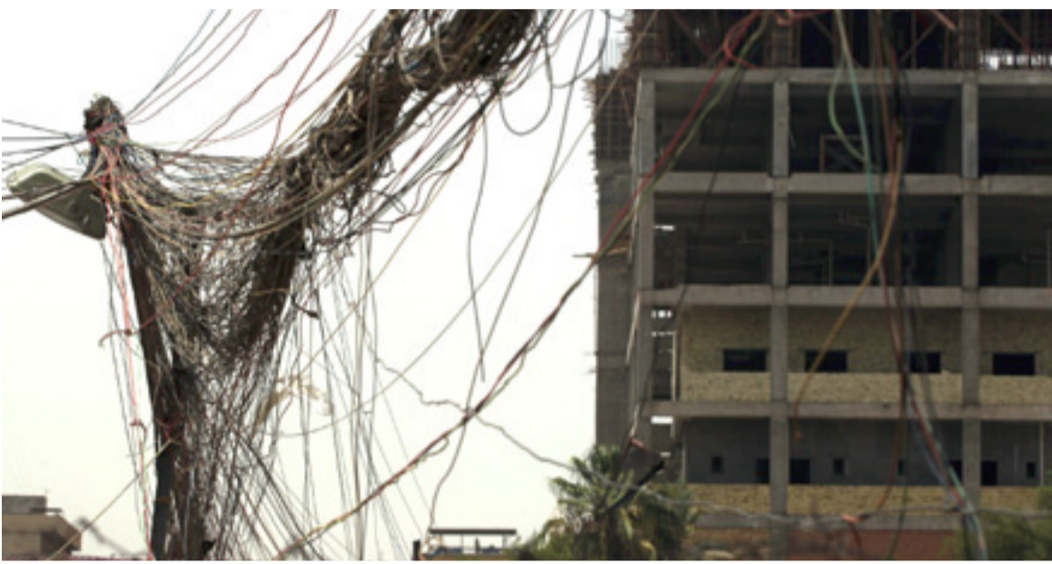
تشويه : أسلاك الكهرباء المسحوبة من المولدات الأهلية تشوه المدن