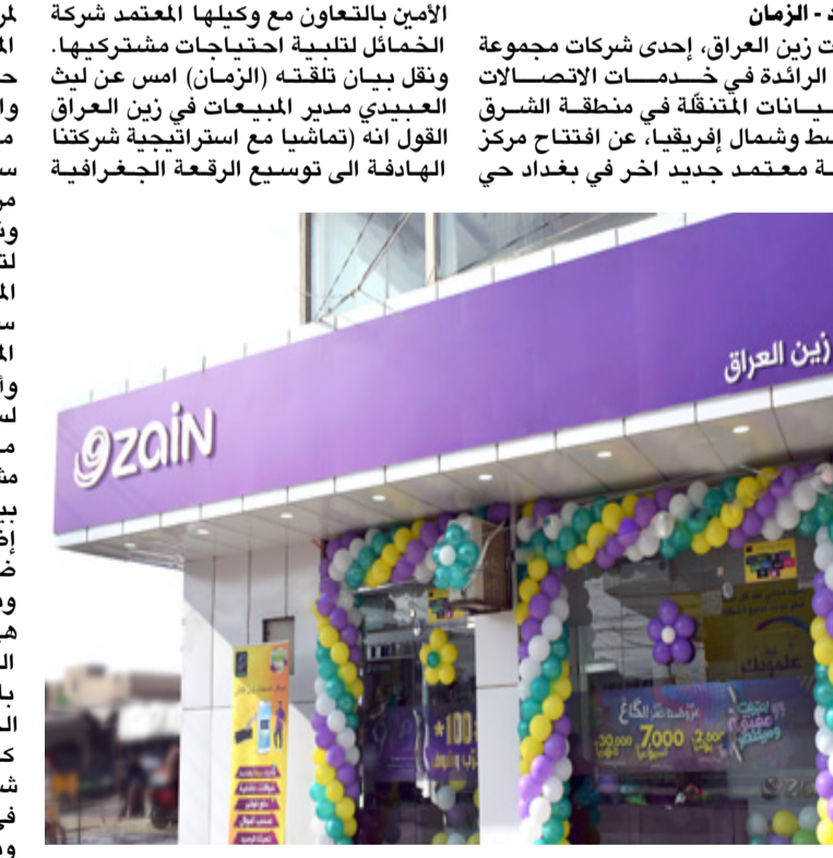
مركز خدمة لزين العراق معتمد في بغداد