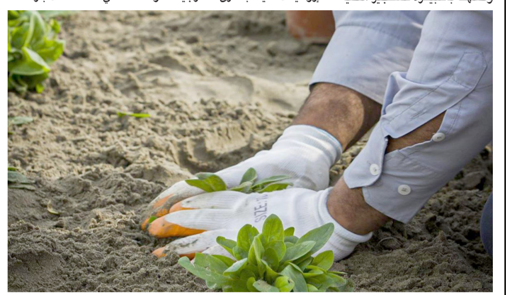
زراعة: متطوع يزرع شتلة في حملة

الحفاظات - مراسلو (الزمان) دعما مواطنون في مدينة صلاح الدين، الى الرعاية والسقي للشتلات والأشجار التي تقوم بزراعتها البلديات، ضمن حملات زيادة المساحات الخضراء وتطليل الغطاء النباتي لمواجهة تحديات المناخ وتقليل التضرر، وبأشرت محافظة صلاح الدين، بحملة لتطوير المنتزهات في جميع المدن والمداخل، مؤكدة استمرار حملة التشجير بجميع البلديات حتى انتهاء موسم الزراعة. وأشار النائب الفني لمحافظة صلاح الدين، مفيد نعم البدراوي، في تصريح امس الى (اطلاق حملة وصفها بالكبيرة لتشجير اضية