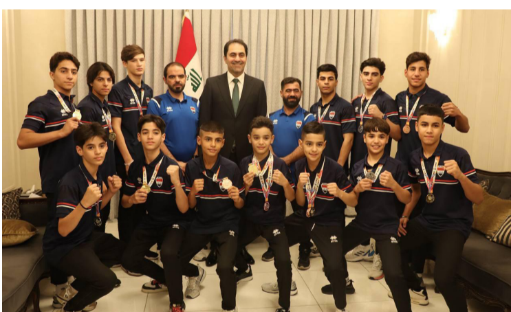
منتخب: رئيس مجلس النواب بالنيابة يكرم منتخب المواي تاي البارزة واللامعة التي أثبتت حضورها الفعال على المستويات كافة، لتسائل باستحقاق فقة عمومية الاتحاد الآسيوي للعبة مرتين متتاليتين.

الثلاثاء للمنتخبات الوطنية بجميع الفعاليات الرياضية، وتكريمهم بما يليق بالمنجز المحقق، وما هو الإل دليل واضح على المتابعة المتواصلة للرياضيين، وتوفير المستلزمات التي تسهل مشاركة المنتخب الوطني في المحافل الخارجية، وتحقيق الإنجازات الكبيرة والأهداف المرسومة).