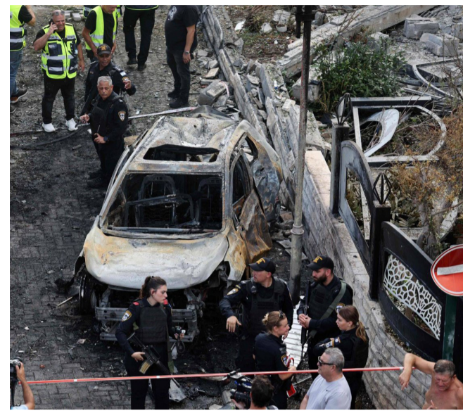
أمن : انتشار كتيف للشرطة الإسرائيلية في أماكن سقوط الصواريخ (7200) جنوب حيفا أيضاً، وأعلنت نوعية، مركز التأهيل والصيانة وزارة الصحة اللبنانية الأحد مقتل

51 شخصاً وإصابة 174 جارات إسرائيلية استهدفت مناطق مختلفة من لبنان السبت وعصر الأحد، أفاد الحزب بيان مقاتليه اشتبكوا مجدداً «من المسافة صفر» مع قوة إسرائيلية في بلدة لبنانية حدودية، على وقع مواصلة إسرائيل محاولاتها منذ نهاية الشهر الماضي التوغل براً في المنطقة، وكان الحزب أعلن في وقت سابق أن مقاتليه خاضوا معارك «باسلحة رشاشة وصاروخية وقذائف مدفعية، مع القوات الإسرائيلية في ما لا يقل عن أربع بلدات حدودية، وأكد الجيش الإسرائيلي حوض «معارك مباشرة»، معلناً أسر مقاتل من حزب الله في نفق في جنوب لبنان حيث يشن هجوماً برياً منذ 30 أيلول/سبتمبر.