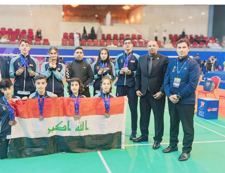
تتويج: جانب من تتويج منتخب الريشة الطائرة