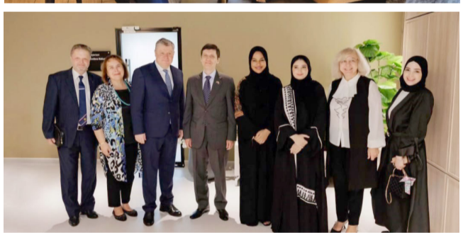
جامعة: ملاك جامعة بليخانوف

عن فخرها بحصولهم على الاعتماد الأكاديمي الرسمي من وزارة التربية والتعليم في دولة الإمارات، والترخيص من هيئة المعرفة والتنمية البشرية في دبي.