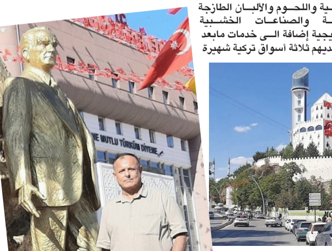
حديقة: برج كيجوران الحديث

كيجوران: بقية المقال على الموقع الالكتروني لجريدة (الزمان)