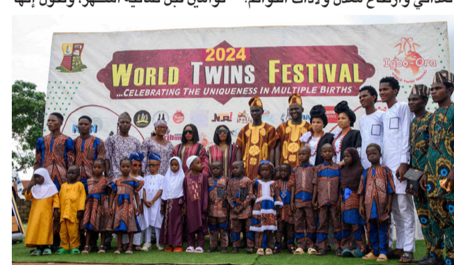
تذكّار : صورة تذكارية للتوائم المشاركة في المهرجان

إيجو-أورا (نيجيريا)، (أ ف ب) - في العادة، قد يُفاجأ زائر إيجو-أورا برؤية العدد الكبير من الثنائيات الذين يرتدون ملابس متطابقة في أوساط السكان المحليين... لكن في نهاية الأسبوع الفائت، لم يعد هناك أي شك حول خصوصية هذه المدينة الواقعة في جنوب غرب نيجيريا، الدولة الأكثر تعداداً بالسكان في إفريقيا. فقد تجمع مئات الأشخاص في المدينة التي نصبت نفسها «عاصمة التوائم في العالم، للمشاركة في مهرجان سنوي يحقي بمعملها المرتفع بشكل استثنائي للولادات المتعددة، مع فرق موسيقية وعروض للمواهب وحتى زيارته ملكية. وقال الملك المحلي أوبا كيهيندي غيادوبولي أولوغيندي، وهو نفسه توأم وينتمي إلى إثنية يوروبا، لا تكاد توجد أسرة هنا في إيجو-أورا لا تضم توأم، تولى ثقافة اليوروبا أهمية كبيرة للتوائم، وتعلم أفراد هذه الفئة أسماء أولى ثابتة تقليدياً، بصرف النظر عن الجنس: إذ يحمل الأكبر اسم تايوو، ويعني «الشخص الذي يتقوى العالم، بينما يُسمى المولود الثاني كيهيندي، أي «الشخص الذي جاء لاحقاً»، ويبلغ المعدل العالمي لحالات ولادة التوائم