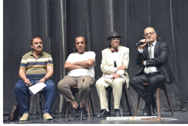
مسرحية: لقطات من مسرحية (تحولات الاحياء والاشياء)