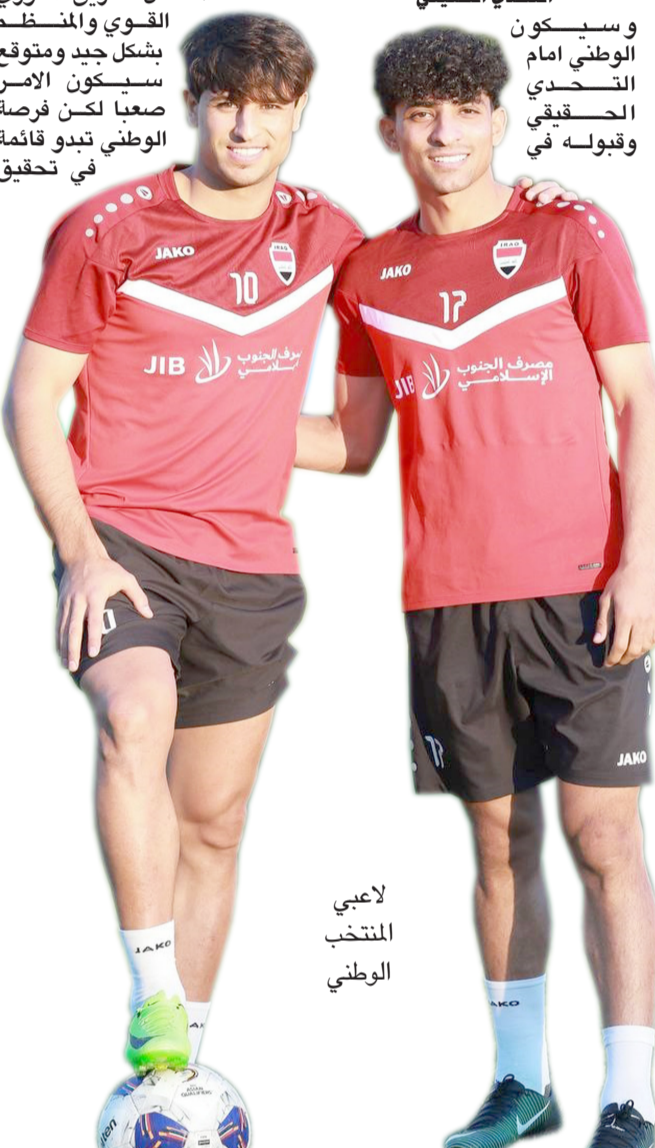
لاعب المنتخب الوطني

الناصرة: باسم الركابي يأمل الشارع ان يقدم المنتخب الوطني أداء أفضل من الذي ظهر به امام منتخب فلسطين الخميس خاصة في الشوط الثاني ما أثار غضب ومخاوف وقلق الجميع عندما يواجه اختباراً ليس سهلاً عندما يحل ضيفاً على منتخب كوريا ج اليوم الثلاثاء عند الساعة الثانية ظهراً ضمن الجولة الرابعة من تصفيات المجموعة الثانية الحاسمة المؤهلة لنهائيات كأس العالم لكرة القدم 2026. التحدي الحقيقي وسيكون الوطني امام التحدي الحقيقي وقبوله في