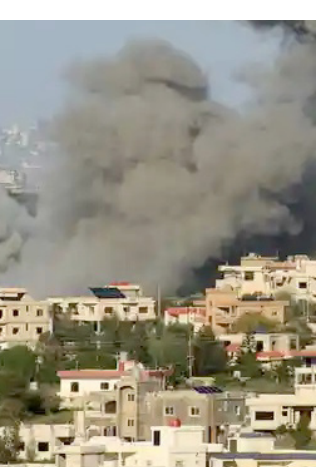
نيران: بيروت تحترق بنيران اسرائيلية

كنت جهزت حقيبتي لطائر تهديد مع انذار بإخلاء المدينة مثلما يحصل مع الكثير من المدن المستهدفة لقد جهزت بعض الأدوية، علبة حليب، اوراقى التيوبوتية ، جواز سفر لا اظن ساستخدمه في ظل الغباء جميع الشركات رحلاتها من وإلى مطار رفيق الحريري الدولي لقد وضبت الحقيبة نفسها مرات عدة منذ الثامن من أكتوبر، في كل مرّة سمعنا فيها أن الامور ساعات او ستسوء، نوضبها، ثم نفرغها، ثم نحضرها مجددا وهكذا لكن يبدو هذه المرة غير كل المرات. يحزنني مغادرة معظم جاراتي في العمارة التي اسكنها بسبب هذه الحرب ، وبعد بناء ومواساة لهذا السواد الاضطرابي تعاقبني اهداشهن بقوة وهي تقول : «إنتهى ع حالك وعلينا عالواتس اب متواصلين ، فيما تطلب الأخرى ان نأخذ صورة سيلفي سوية قائله : «بركي ما عينا شغفنا بعض . عندما تغيب الشمس عن بيروت، يبدأ الخوف بالتسلل الى قلوبنا كل ليلة، نتهيأ لأصوات الغارات ولصدى القنابل الفراغية والارتجاجية الخارقة للحصينات لقد اصبت رفيقة ليلانيا نخرق هوء ضواحي بيروت الجنوبية، ولا تفارق بين الحجر والبشر، لقد اصبح حرماتنا من النوم ، معركة اضافية ربما ايني قوية بعض الشيء ، لكنني خائفة من هذه الحرب وطفلي الصغيرة خائفة ايضا، تسألني كل ليلة عن مصر وشهد وجرع ونازح مثلما يحصل اليوم ولكن الحزب متمسك بقرار المواجهة مع