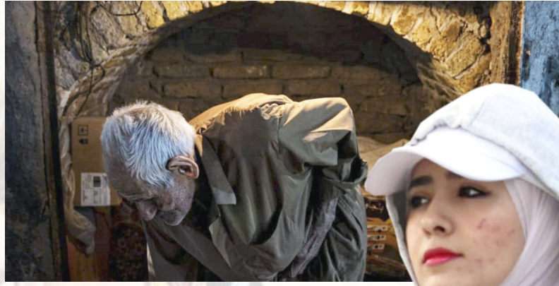
فوتوغراف: لقطات فوتوغرافية بعدسة فُرقان سلام