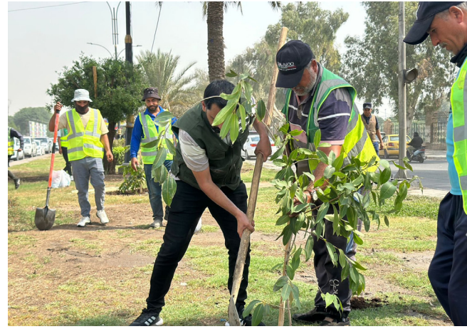
حملة: ناشطون يزرعون اشجارا في حملة الشوارع الرئيسية والحيوية التي تنفذها امانة بغداد بالتعاون مع مؤسسات حكومية ومؤسسات محلية ودولية لضمان تحقيق نتائج ملموسة.

لتعزيز الطرق بالغطاء النباتي، وتابع الشريفي أن الحملة تضمنت تأهيل الشوارع والجزرات الوسطية من سيطرة الوند باتجاه كربلاء، ومنها إلى (مشاركة أكثر من 200 عامل نظافة في بلدية كربلاء، لزيادة المساحات الخضراء من السيطرة الخارجية حتى المحافظة، وكنز الأشجار داخل الأحياء السكنية، بما يخدم توفير بيئة نظيفة وخالية من التصحر، ضمن التوجهات الحكومية لمواجهة ارتفاع درجات الحرارة، والحد من التصحر. على صعيد متصل، أطلق ملتقى النبا للحدائق، بالتعاون مع مؤسسات حكومية، حملة نحو عراق أخضر، لزراعة الأشجار، بهدف تعزيز الزراعة المستدامة والحفاظ على البيئة، بالتعاون مع مؤسسات حكومية ومؤسسات محلية ودولية لضمان تحقيق نتائج ملموسة.