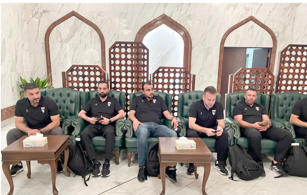
وهذة: وصول المنتخب الفلسطيني لبصل البصرة ويجري اول وحدة تدريبية له

حقق التعادل بهدف منتظر هديب عادل 3:3 فيما أضاف منتظر هديب هدف الفوز والنقاط كاملة 20:0 واستمر بتقدمة وسير الوقت. كما يريد عندما دار المهمة كما يجب وفي السيطرة والاستحواذ وقدّم اللاعبين دورا كبيرا في إدارة المهمة مع مرور الوقت عندما سخر جهودهم ومتابعة المهمة بشكل جيد حتى حسمها عندما فرض نفسه الطرف وتظهر فريق متكامل ونجح في تعديل التكتيكية والفوز مانحا نسخة ثلاث نقاط تقدم فـسـبـها للمركز السابع ولم يتمكن نوروز من إدارة المهمة لمصلحته وتجنب الخسارة الأولى بعد تعادلهن جميعها خاضها ذهابا قبل أن يعود إلى السـبـبـلـمـانـية والتطلع للثلاثون وتعديل البداية بعد غياب الانتصارات معولا على عناصره في تغير المسار.