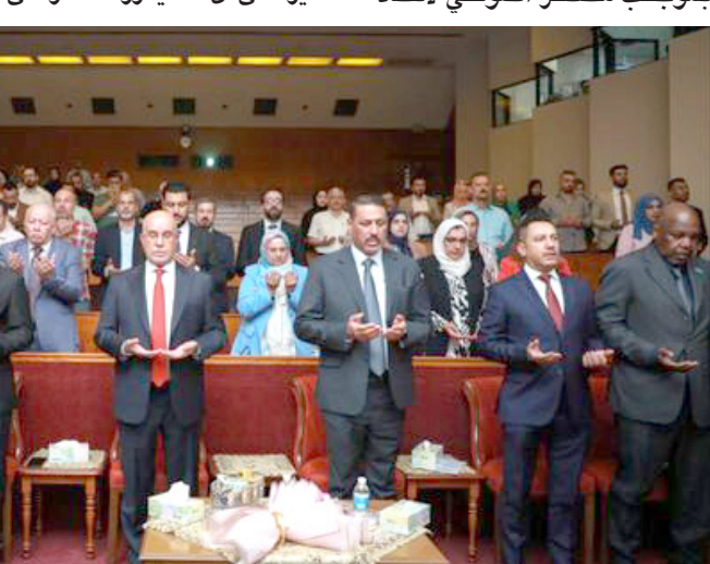
مؤتمراً: وزير الصحة يرعى مؤتمراً طبياً