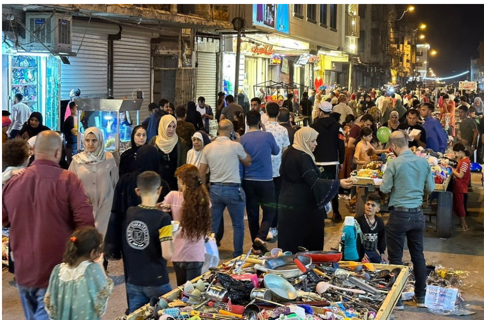
تجاوز : باعة يتجاوزون على الأرصفة

فالمطاعم بامكانها التعامل مع بعض تلك السيارات التي تنقل الاطعمة النافذة وتصريفها بدلا من ان تكون الوائز المعنية ان تخصص سيارات خاصة لفرز النفايات لكل من هب وبب .