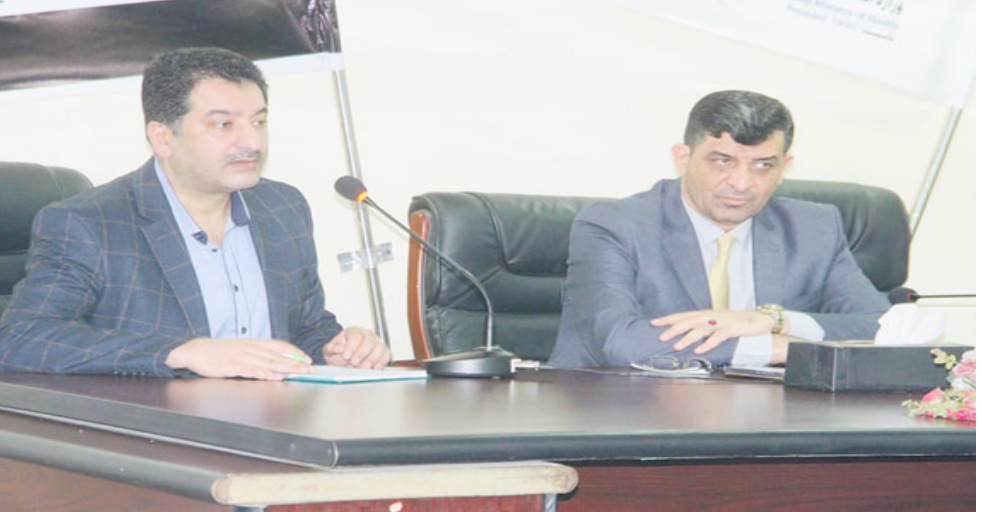
مدير عام صحة الكرخ خلال اجتماع موسع