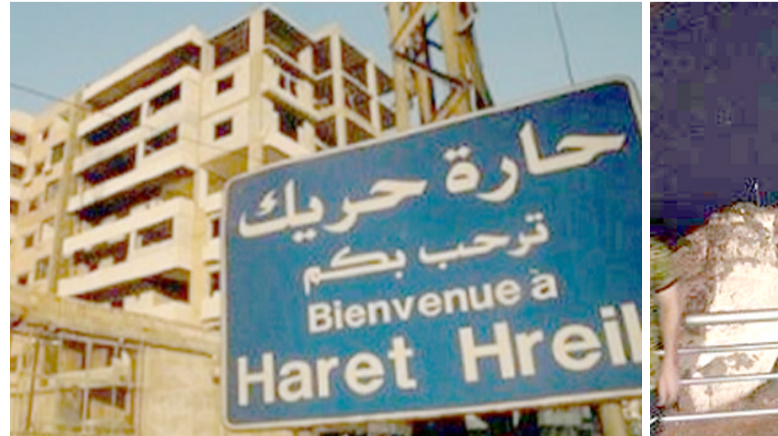
جولة (الزمان) في بيروت على البحر وفي الحارات

البعض يعتقد بان المنطقة السكنية التي تقع بالقرب من الساحل الغربي لساحل في بيروت قد استعملت التسمية (الروشة) من شهرة (صخرة الحد) او (صخرة الانحطار) المتواجدة بالقرب من رصيف شاطئ البصر، لكن الروشة كمنطقة هي حي سكني وتجاري تنتشر على جانبيه المطاعم العائلية واللبنانية والمقاهي والكازينوات الاطلة على البحر وكذلك على الجانب الاخر من طريق (باريس) لا يخلو من النشاط التجاري، المنطقة كلها فيضها تحفة فرنسية،فالصخرتين (الروشة) يؤكد البعض بان الكلمة فرنسية وتعني الروشة (الصخرة) بينما بعض المتحمسين من اللبنانيين يرجعون التسمية الى شكل الصخرة المستخدمة من اللغة الارامية (الروشة) تعني (الراس) وعلى العموم هاتين الصخرتين من فعل الطبيعية والزلازل التي ضربت الجزر المنتشرة وما تبقى منها الا هاتين الصخرتين اللتين بعدان رصم الحزب والشفاق وقشل الارتباط لبيت الصعود عليها والانحجار العائيق عندما يرمي نفسه على الحجر المحط بالصخرتين، السياح من لبنان والعرب والاجانب يحرصون على زيارة هذا الموقع والنقاط السياحية وكذلك ركوب القوارب وسبح التجويف الموجود فيها، ولشعور الصخرتين اصيحت موقعا لاقامة التظاهرات والاحتفالات الوطنية،البعض كان يلصق عليها بعض الشعارات والصور حينما يستمد الصراع بين الفرقاء السياسيين في لبنان، كما ان بعض المغامرين يتسلقون تلك الصخرة