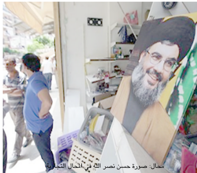
جمال . صورة حسن نصر الله في المحال التجارية

اهالي تلك المنطقة امتنعوا عن الدفع وقتلوا العبد وزموه بالشر فاطلق على هذه المنطقة (بئر العبد) المنطقة خضت للناشقين بين الاتجاه القومي - عبد الناصر وانصار كميل المشعون فضلا عن وجود اليسار الشيوعي في خمسينات القرن الماضي ، ايما وجد الفكر كان للحزب الشيوعي قاعدة جماهيرية، سنة 1968 توافد الفلسطينيين فيانضم ابناء الضاحية الى العمل الفدائي مع منظمة فتح، ظهر الامام موسى الصدر واسس حركة امل الشيوعية ، واندلعت الحرب الاهلية اللبنانية سنة 1975 فكانت حركة امل تاتي بالضاحية، قامت الثورة الإيرانية ، جذبت ابناء الضاحية للانضراط بالمقاومة ضد اسرائيل ليكون اهل المقاومة (حزب الله) سنة 1982 ، ومنذ ذلك الحين اصيحت الضاحية في بيروت معقلا لحزب الله وحركة امل ومنطقة للمقاومة، واحداث ما يسمى (توازن الربيع) لتمتد المعارك بين الحروب مصطلح تستخدمه اسرائيل لضرب حزب الله احباطا في لبنان وكثيرا في سوريا والشاهدات الحية لتسوارع وسيارات الدراجات في كشتات ومعنى الفجر التسمية ، فكانت الاجابة في ارسال احد امراء الدروز وعبداله الحصول على ايجار الاراضي لسكن