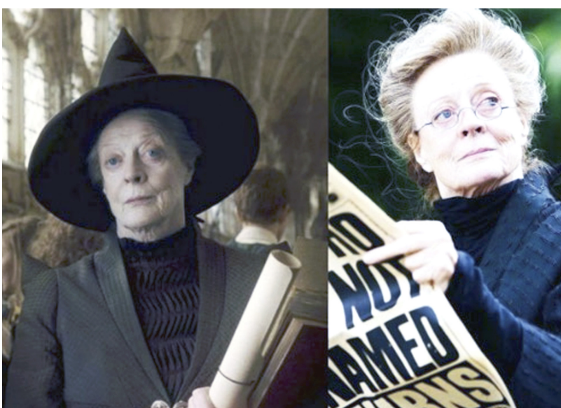
مواهيها في النهاية إلى (The Old Vic) في لندن، حيث لفت انتباه الممثل والشركة لورانس اوليفيه ودعت للانضمام إلى شركة المسرح الوطني الملكي عام 1963 كأكاد أعضاءها الأوائل.

لندن - الزمان توفيت ماغي سميت، أسطورة التمثيل الإنكليزية، والتي عرفت بدورها في سلسلة أفلام «هاري بوتر» و«ميسلسل داوتون ابي»، عن عمر يناهز 89 عاما. وانشاء انباء الراحلة ماغي سميت، كريس لاركن وتوبي ستيفنسن، بوالدهم في بيان مشترك هذا الصباح، وكتبا: «ببالغ الحزن نعلن وفاة السيدة ماجي سميت. لقد توفيت بسلام في المستشفى في وقت مبكر من هذا الصباح... الجمعة 27 ايلول. كانت شخصية شديدة الخصوصية، وكانت مع الاصدقاء والعائلة في النهاية». فازت ماغي سميت بجائزة الأوسكار عن ادائها في فيلمي (The Prime of Miss Jean Brodie) و(California Suite)، وهما من أشهر الأفلام التي قدمت في الفترة الممتدة بين الخمسينيات والثمانينيات لتصبح ماغي سميت من أشهر الفنانات في العالم، إلا ان ماغي سميت قد اشتهرت لدى المشاهدين الصغار بدورها في سلسلة أفلام «هاري بوتر»، وكتب لاركن وستيفنسن: «لقد كانت مع الاصدقاء والعائلة في النهاية. لقد تركت ولدين وخمسة اخفاء محبين بدمهم فدان اهم وحدثهم غير العادية». ولم يحددوا على الفور سبب الوفاة ولم يتم الكشف عن سبب الوفاة، لكن العائلة اشارت إلى ان سميت كانت مريضة في مستشفى تشيلسي وويستمنستر في ايهاما الأخيرة. ولدت سميت في 28 كانون الأول 1934، وبدأت مسيرتها التمثيلية التي