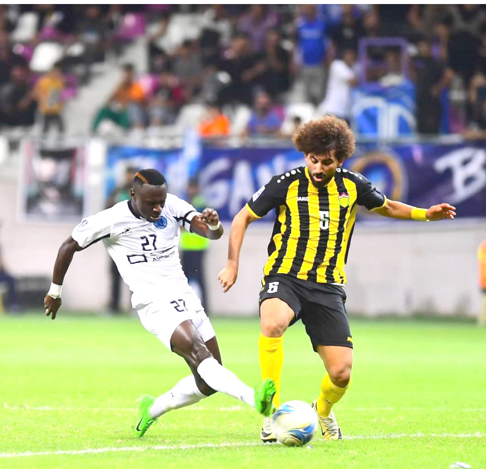
مواجهة : جانب من مواجهة فريق الطلبة مع فريق الحدود في دوري المحترفين

العمل مع الفرق المحلية والاداء والتوازن في المباريات التي تحتاج إلى اللعب بقوة وتركيز وتماسك واستغلال الفرص وترجمتها بعدما امتلك الفريق بروحية الفوز في جميع عبرتأمين اجواء اللعب واستغلال الفرص والرد بقوة.