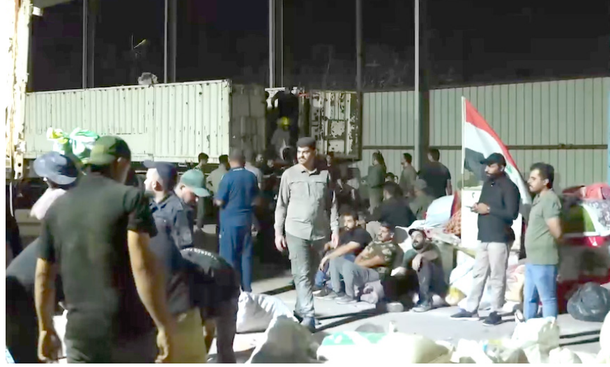
مساعدات : دغيات جديدة من المساعدات الانسانية تنجى الى لبنان

جددت الحكومة العراقية، وقوفها مع لبنان للتخفيف من اثار النزوح الجماعي من محافظات الجنوب، الذي يقترب من مليون شخص حتى الآن بعد سلسلة غارات عروانية شنتها إسرائيل وأودت بحياة 1640 شخصاً، منهم 104 أطفال و194 امرأة. وقال بيان تلقته (الزمن) أمس إن (رئيس الوزراء محمد شياع السوداني، أجرى اتصالاً هاتفياً مع نظيره اللبناني نجيب ميقاتي، قدم خلاله تعازي العراق، حكومة وشعباً، باستشهاد الأمين العام لحزب الله حسن نصر الله ورفاقه،