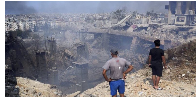
دمار: اثار الدمار الذي لحق بمبنى قتل فيه حسن نصر الله ورفاقه

نصر الله. وقالت السفارة في بيان تلقته (الزمن) أمس (ببالغ الحزن والتسليم لشهيدنا) الله تعالى، تعلن سفارة لبنان في بغداد إقامة مجلس عزاء على روح الشهيد صر الله ورفاقه، وذلك بالتعاون مع الجالية اللبنانية ومجلس الأعمال اللبناني وإدارة مسجد الزوية. ونظمت الجامعات العراقية، وفتات تابينية لاستشهاد نصر الله. وقالت وزارة التعليم العالي في بيان تلقته (الزمن) أمس إن الجامعات العراقية نظمت وفتات تابينية لسيد المقاومة