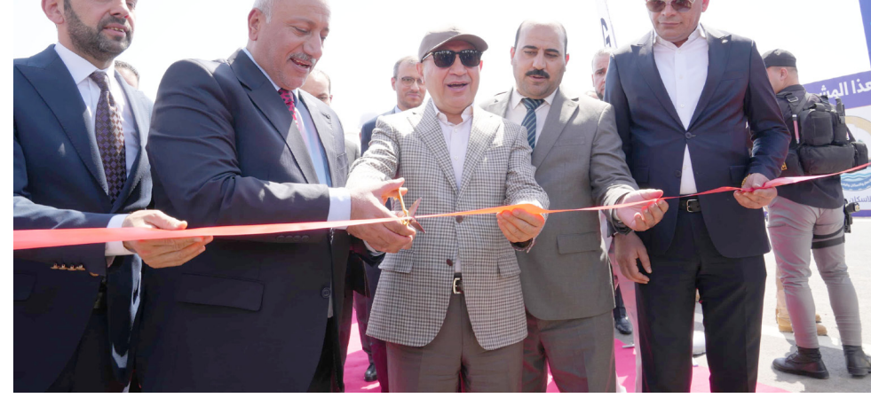
مشروع: وزير الاعمار والاسكان يفتتح مشروع طريق الحج البري

المحافظات - مراسل (الزمان) افتتح وزير الاعمار والإسكان، بنكين ريكاني، مشروع طريق تقاطع الحج البري، قضاء عين التمر، في مدينة كربلاء، بحضور المحافظ نصيف الخطابي.