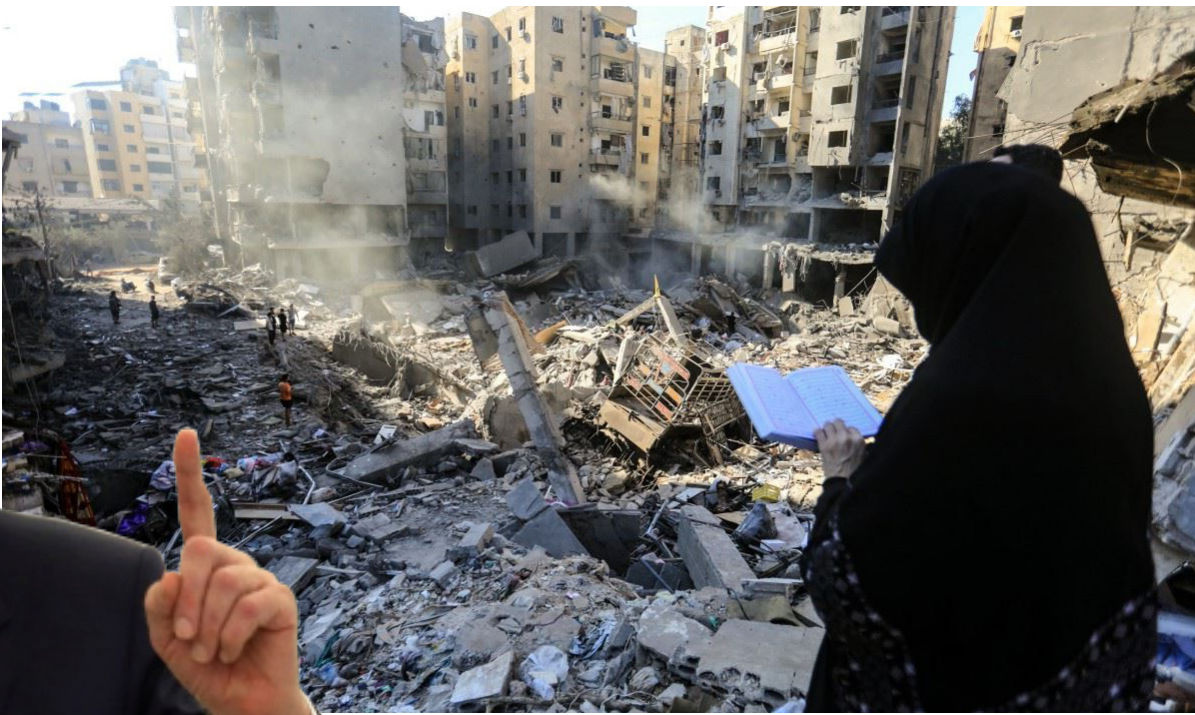
دمار: لبنانية تقف على بقايا الدمار الذي خلفه القصف الاسرائيلي

وفي بيروت أعلن رئيس حكومة تصريف الأعمال في لبنان نجيب ميقاتي أن عدد النازحين جراء الضربات الإسرائيلية المتوالية في لبنان قد يكون وصل إلى مليون شخص، معتبراً أن عملية النزوح هذه ربما هي «الأكبر» في البلاد. وأضاف ميقاتي خلال مؤتمر صحفي «هناك 778 مركز إيواء، يضمون حتى الآن 118 ألف شخص» لكن «المقرر أن عدد النازحين أكبر بكثير من هذا العدد وقد يصل لحد المليون شخص» نزوحاً في الأيام الأخيرة من جنوب البلاد وشرقيها ومن الضاحية الجنوبية لبيروت.