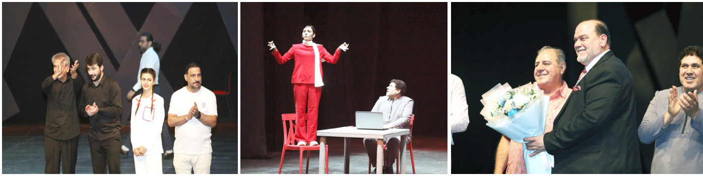
مسرحية : لقطات من مسرحية (قطار بصرة - لندن)