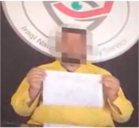
سيطرة : الأمن الوطني يعرض متورطاً في حادث سيطرة السلاميات

تقدر بـ300 دولار لقاء إطلاق سراحه، تم نصب كمينًا وتمكن من ضبط الوسيط الذي أرسله المشكوك منه، بعد تسلمه الرشا، وضبط مركبته التي لا تحمل أرقامًا، مؤكداً إنه (بعد تدوين إفادة المتهم، اعترف بأنه يزعم تسليم المبلغ المضبوط للمشكوك منه). من جانبها، أصدرت محكمة جنائيات النجف، أحكاماً بالحبس الشديد لمدة سنتين بحق خمسة مدانين عن جريمة هدر المال العام، وأشار بيان تلقته (الزمن) أمس إلى إن (المدانين قاموا عمداً بهدر المال العام والإضرار بدائرة مطار النجف الدولي)، وتابع إن (الأحكام صدرت استناداً لأحكام المادة 340 وبدلالة مواد الاشتراك 47 و48 و49 من قانون العقوبات). فيما قضت محكمة جنائيات ذي قار، بالحبس المؤبد بحق تاجر مخدرات، وأوضح البيان إن (المدان ضبط بجورته كيلو غرام و52 غراماً من مزيج مادي المشبه الميثامفيتامين، وكريات الإينوم، إضافة إلى 225 قرصاً من مادة الإيفيتامين المتعاطين)، مؤكداً إن (الحكم صدر استناداً لأحكام المادة 28 أولاً من قانون المخدرات والمؤثرات العقلية).