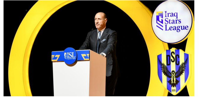
فن ورياضة: فعاليات فنية في افتتاح دوري المحترفين لكرة القدم