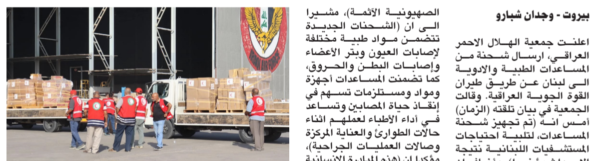
مساعداة : الهلال الأحمر يرسل شحنة من المساعدات إلى لبنان

أعلنت جمعية الهلال الأحمر العراقي إرسال شحنة من المساعدات الطبية والأدوية إلى لبنان عن طريق طيران القوة الجوية العراقية. وقالت الجمعية في بيان تلقته (الزمان) أمس إنه (تم تجهيز شحنة المساعدات لتلبية احتياجات المستشفيات اللبنانية نتيجة الأحداث مؤخرًا)، وأضاف إن (المواد المرسله تتضمن مواد طبية مختلفة ومستلزمات تسهم في أداء الأطباء وعلمهم أثناء حالات الطوارئ والعناية المركزة وصالات العمليات الجراحية). من جانبه، أكدت هيئة الحشد الشعبي، إرسال طائرتين جديدتين من المساعدات الطبية إلى لبنان. وأوضح بيان للهيئة تلقته (الزمان) أمس إنه (بتوجيه من رئيس الوزراء محمد شياع السوداني، انطلقت أمس طائرتين من المساعدات الطبية تم تجهيزهما من قبل هيئة الحشد والهلال الأحمر العراقي لتلبية احتياجات المستشفيات اللبنانية نتيجة تكرار الاعتداءات