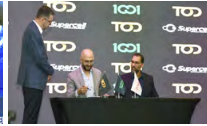
اتفاقية: لقطات من حفل توقيع اتفاقية الشراكة الاستراتيجية الثلاثية