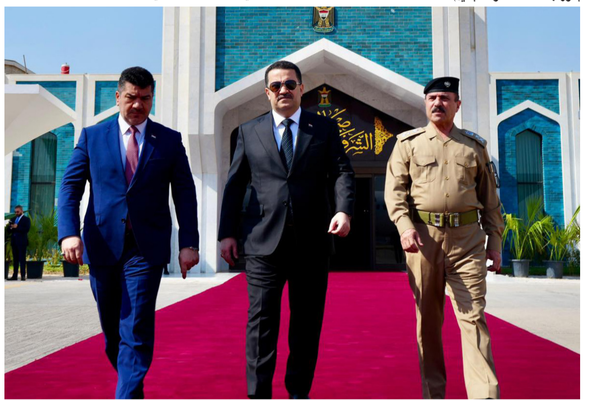
مخادرة : رئيس الوزراء يغادر بغداد إلى نيويورك للمشاركة في اجتماعات الجمعية العامة للأمم المتحدة

وأضاف إن (رئيس الوزراء سيلقي كلمة في كلمة في قمة المستقبل التي يشارك فيها العديد من قادة الدول والرؤساء، وتعنى بتعزيز التعاون ومواجهة التحديات وتأكيد الالتزامات)، وأشار البيان إلى ان (السوداني سيبدأ مع الوفود المشاركة، فضلا عن اللقاءات والحوارات مع عدد من قادة ورؤساء الدول الشقيقة والصديقة، ورؤساء الوفود المشاركة، فضلا عن اللقاء بالأمم العام للأمم المتحدة، وعدد من مسؤولي المنظمات والهيئات الدولية والأممية). من جانبه، أفادت