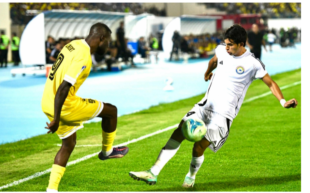
افتتاح: جانب من افتتاح دوري المحترفين لكرة القدم