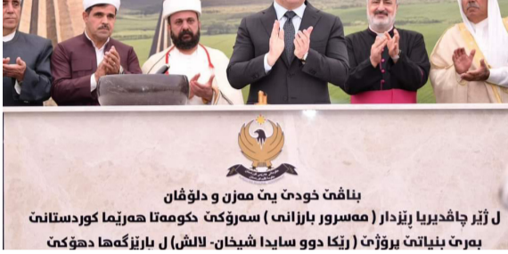
بفانغ حوذا بين مهران ودولفان ل زيل جافريديري زيلدار (مسرور بارزاني) مسرور كورستان بمراه بنيايت برزوي (زينكا دوو سايدا شيخان- لاش) ل بارزنگها حكومت

في سنجانر إلا بتطبيع الأوضاع رئيسا الإقليم يهنئان اتحاد علماء الدين بذكرى التأسيس