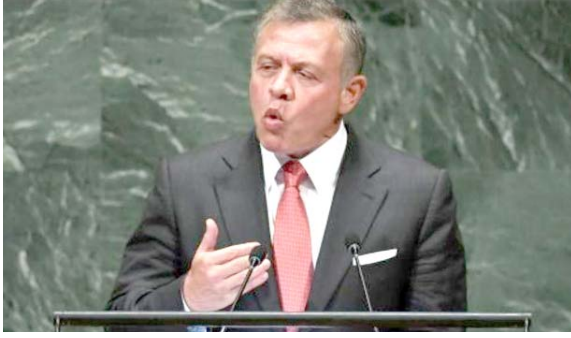
عبد الله الثاني

الذي تربطها علاقات دبلوماسية كاملة مع إسرائيل، فكرة ما يسمى بحل الدولة الواحدة الذي يتضمن استيعاب الفلسطينيين في دولة يهودية، وتسأل الملك ما هو المستقبل الذي سيترتب على ما يقترحه البعض، أهو دولة واحدة على أساس إنكار المساواة بين مواطنيها؟ هذه هي الحقيقة البشعة وغير الديمقراطية لفكرة الدولة الواحدة، وأضاف 'انهاليتست، يأتي حال من الأوهال، بعيداً عن السلام القائم على حل الدولتين، بل إنها تمثل تحدياً على