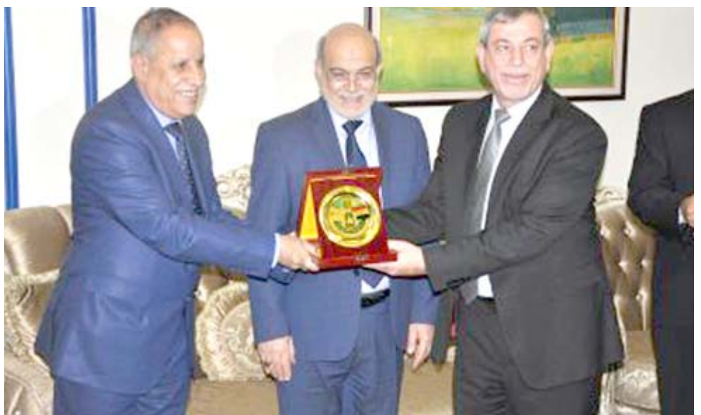
اتفاقية : رئيس الجامعة التكنولوجية يتبادل الهدايا مع وكيل وزير النفط