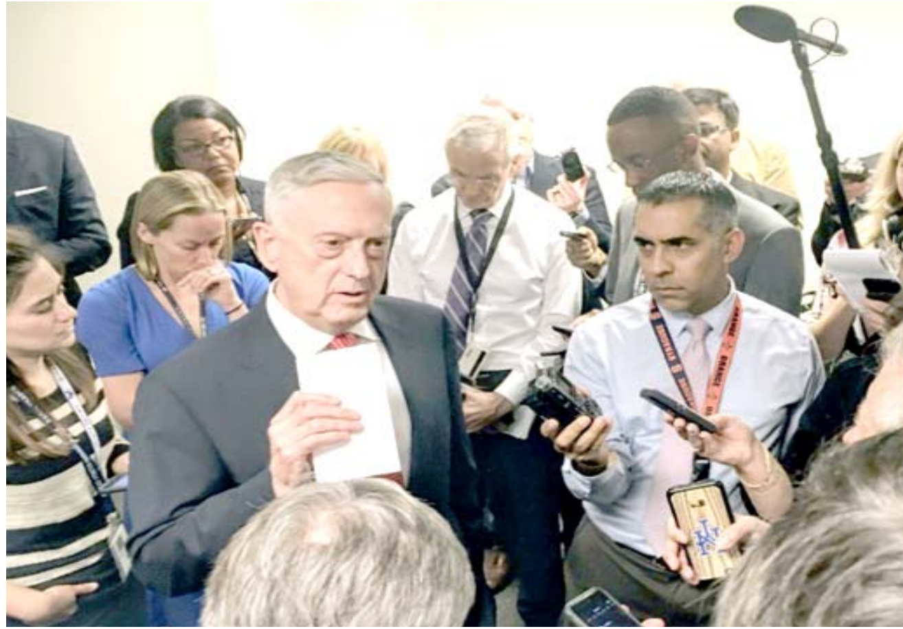
هديث : وزير الدفاع الأمريكي جيم ماتيس يتحدث الى الصحفيين

□ الامم المتحدة (الولايات المتحدة)، 1٠ ف ب) - اتهم الرئيس الإيراني حسن روحاني نظيره الأمريكي دونالد ترامب بمحاولة الإطاحة بالنظام الثنائي فيما استعد استئناف المحادثات مع واشنطن بعد انسحابها من الاتفاق النووي. وقال روحاني في كلمته امام الجمعية العامة للأمم المتحدة (من المنبر للسخرية أن الحكومة الأميركية لا تخفي حتى خطتها للإطاحة بنفس الحكومة التي تدعوها للحديث معها).