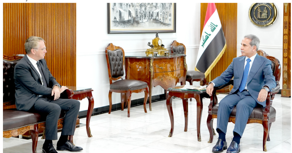
لقاء: رئيس مجلس القضاء الأعلى خلال لقائه السفير الفرنسي في بغداد

بغداد - الزمان تحتل النخبة السياسية مركزاً متميزاً ضمن قائمة مختلف النخب الأخرى باعتبارها تلك القوة والقدرة داخل النظام السياسي للدولة، وإن التهديد الكبير والرئيسي للسلم الأهلي في أي مجتمع ينبثق من شكل النظام السياسي والنخبة القائمة. فبعد عام 2003، حصلت تغييرات كبيرة في النظام السياسي العراقي من نظام حزب الواحد إلى نظام ديمقراطي مبني على الانتخابات والتعددية الحزبية وانعكست هذه التغييرات على الوضع العام في البلد ولعبت هذه الكفالات دوراً أساسياً في هذا النظام السياسي الجديد والتي بقوة على مسار الحياة الاجتماعية والسياسية والاقتصادية في أثناء تلك التغيرات سواء كان سلباً أم إيجابياً حيث إن تغيير طبيعة النظام وأخلاق الكفالات الوطنية التي كانت تمثل المحور الأساسي في بناء مؤسسات الدولة الحقيقية وتصلت عن معالجة الوضع المتردي وديم فجيوة الثقة في الشعب والحكومة مما جعل مستقبل الدمار والانقسامات والانحيار لا مجال لذلك ليد ممي للخلول والمعالجات: