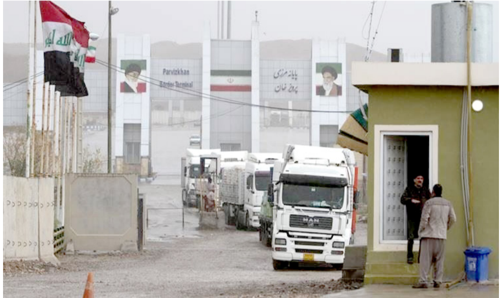
دخول: شاحنات تدخل الحدود العراقية محملة بالمنتجات الإيرانية

للسنة الماضية، وارتفعت العقود الآجلة لخام برنت لشهر تشرين الثاني 16 سنتاً و 0.2 بالمثل إلى 72.91 دولاراً للبرميل، بينما قفزت العقود الآجلة للخام الأمريكي لشهر تشرين الأول 34 سنتاً و 0.5 بالمثل إلى 70.43 دولاراً للبرميل. وسجلت العقود الآجلة لبرنت والخام الأمريكي، ارتفاعاً عند