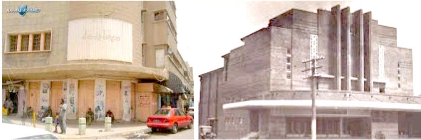
سينما : واجهات لدور سينما في بغداد في عقود ماضية