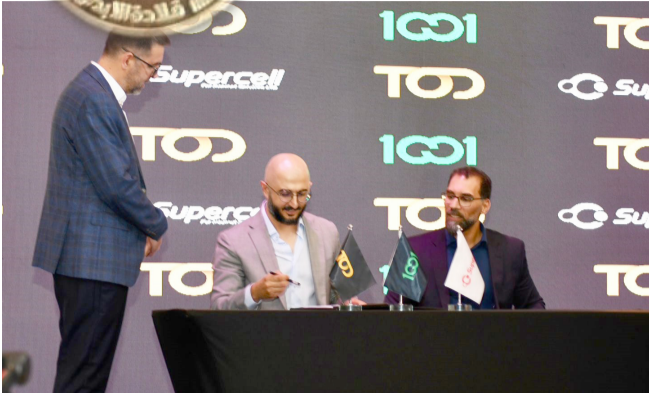
أيقافية: جانب من توقيع اتفاقية الشراكة بين سوبرسيل مع 1001 وTOD