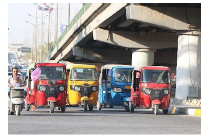
مركبة: التكتك مركبة مستخدمة بكثرة

الوظيفة محققة اجور يومية لصاحب المركبة والتي تصل الى اكثر من 30 الف دينار يوميا في ادنى تقدير وهذا ما