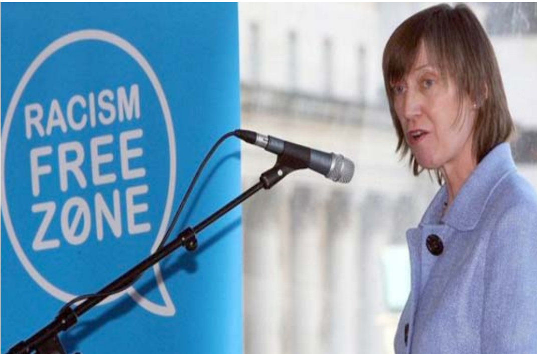
تظاهرة: إحدى المتحدثات في تظاهرة في أيرلندا ضد التمييز العنصري في مكان العمل