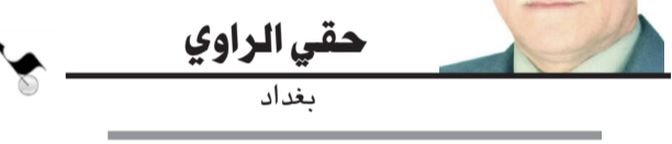
حقي الراوي بغداد

تجنب أن تتعامل مع عملاء الشركة برفياتك الشخصية فتتجاوز الحدود الأخلاقية للمهنة بتقديم موزج عن حياتك أو أن تطلب بأجور غير متفق عليها أو أنك تتظاهر بالاستعجال أو تتدخل بخصوصياتهم، وتذكر بأن التواصل لم يكن لذات الخاص.