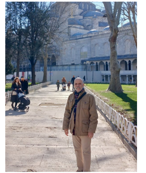
الكاتب في اسطنبول

قصر طوب قابي هو أكبر قصور مدينة إسطنبول الأثرية ومركز إقامة سلاطين الدولة العثمانية لأربعة قرون من عام 1465 - 1865م وكمثي (طوب قابي) تعني باللغة العربية (الباب العالي) وتم بناؤه في نقطة تشرف على مضيق البسفور وخليج القرن الذهبية