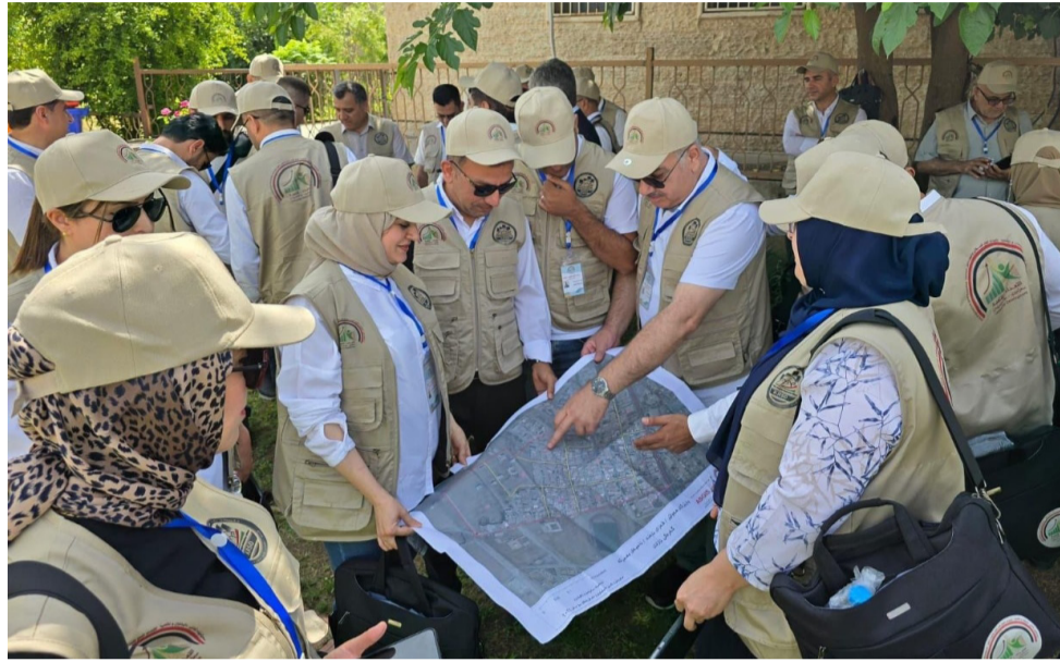
عملیات: أحد مجاميع التعداد السكاني تقوم بعملیات الحصر والترقیب

بغداد - الزمان أقر المجلس الأعلى للسكان، فرض حظر تجوال لمدة يومين في عموم العراق، ابتداء من 20 و 21 من شهر تشرين الثاني المقبل، وذلك لضمان سير عملية التعداد السكاني بشكل دقيق ومنظم. وقال بيان تلقته (الزمان) أمس إن رئيس الوزراء محمد شياع السوداني، ترأس الاجتماع الثالث للمجلس الأعلى للسكان، جرى خلاله بحث وتبعية إجراءات التحضيرات الجارية العمل عليها لإجراء التعداد العام للسكان والسكنى في شهر تشرين الثاني المقبل، وأضاف أن (السوداني) اطلع عرض شامل لمجمل الجهود المبذولة، والتقارير المقدمة من هيئة الإحصاء ونظم المعلومات الجغرافية في وزارة التخطيط، على أن يشمل التقرير ملاحق تتضمن أهم المؤشرات الإحصائية الناتجة عن التعداد العام للسكان والمسح الاجتماعي والاقتصادي للأسر في العراق، والمسح التعدادي للمؤسسات.