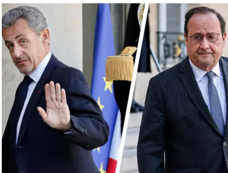
اختيار هولاند وساركوزي يبحثان عن رئيس وزراء توافقي فرنسا الأبوية اليساري الراديكالي من لهجته وطالب علنا في تجمعات جماهيرية ومع الجموعات البرلمانية الأخرى دعم محاولته التي يبدو أنها بعيدة المنال لعزل الرئيس إيمانويل ماكرون بسبب ما سماه "إخفاقات خطيرة" في تادية واجباته الدستورية وطالب بعزله من الرئاسة. ويدور خلاف بين ماكرون وحزب فرنسا الأبوية وحلفائه من الخضر والاشتراكيين والشيويعيين بسبب رفضه تسمية مرشحته لوسي كاستيه رئيسة للوزراء بعد الانتخابات البرلمانية غير

أرسلوا الوثيقة إلى نواب آخرين لجمع التوقيعات وتواجه أي محاولة لعزل إيمانويل ماكرون من خلال المادة 68 من الدستور الفرنسي عقبات كبيرة، إذ تتطلب موافقة ثلثي أعضاء الجمعية الوطنية ومجلس الشيوخ مجتمعين ويقول حزب فرنسا الأبوية إن الأمر لا يعود إلى الرئيس "لإجراء مقايضات سياسية"، مشيراً إلى جهود ماكرون منذ تولي يوليوي للعثور على رئيس وزراء يحظى بدعم العديد من الخبراء الدستوريين. يرون أن دستور الجمهورية الخامسة الذي أقر عام 1958 وكتب على افتراض أن النظام الانتخابي سيختار أغلبية واضحة، غامض بشأن المسار الذي يجب اتخاذه في حال تعطل العمل البرلماني وبر ماكرون رفضه تسمية كاستيه رئيسة للوزراء بقوله إنه من واجبه ضمان الاستقرار المؤسسي رؤساء سابقون يبدون راغبهم بالإمادة الرئيس الفرنسي السابق اليساري الاشتراكي فرانسوا هولاند