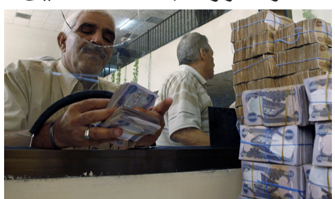
منفذ: متقاعد يستلم راتبه الشهري من أحد المنافذ

لم تكن جادة في معالجة هذا المشهد الذي أصبح يتكرر شهريا ومنذ عدة سنوات دون توفير وسائل المعالجة (بحسب قولهم، مطالبين (البنك المركزي أن تكون اجراءات سريعة لهذا الشأن وتوجيه الشركات التي اصحابها الشلل في عملها والزاهم بان يعالجوا موضوعة الإشارة وينسكل فوري واطلاق الرواتب التقاعدية دفعة واحدة لا أن تكون بشكل تدريجي او يصار إلى تبديل الشركات وبالتنسيق مع المصارف بسبب الملاحظات المتزايدة على اعمالها) بحسب وصفهم.