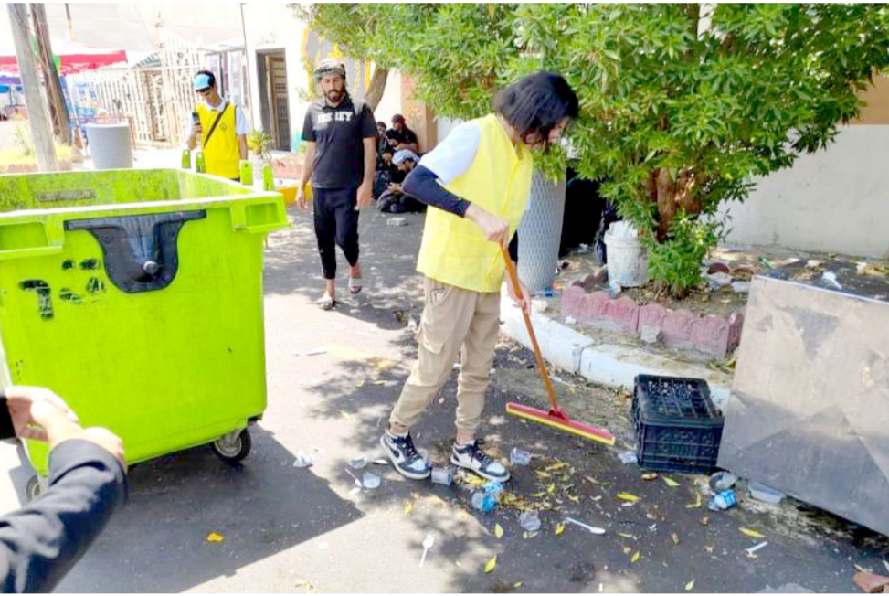
حملة متطوعون شباب يبدؤون حملة تنظيف مدينة كربلاء بعد إنتهاء الزيارة الاربعية

انصب إدارات حديثة والذي تم تطبيقها مؤخرا ساعدتنا في تقليل الخواص المرورية). مبيضا انه) نقل تجربة الإدارات من محافظتي بغداد والأينبار كان لها من الأهمية في تقليل تلك الحوادث). وعن موضوعه الهزات للركبات في موقع تسجيل المركبات أوضح السلطاني انه (في عام 2014 كان هناك تشفس مالي ولكن بموجب المطالعات المرورية جاءت شركات لتستلم هذا الامر بموجب بنود العقد التي اجرتها المديرية مع تلك الشركات وهذا ما ساعدتنا في مسائل كثيرة ومنها القضاء على السيارات القديمة وكان لعمل هذه الشركات جهد مروري بدأ من كركوك وانتهاء بمحافظة البصرة).