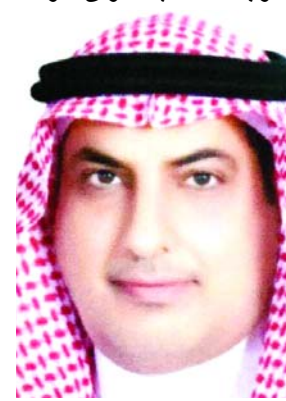
عبد العزيز الشمري

أكد السفير السعودي في العراق عبد العزيز الشمري ان توجيهات الملك السعودي سلمان بن عبد العزيز، وولي عهده محمد بن سلمان، تشدد على توجيه كل الدعم للحجاج العراقيين. وأضاف في تصريح امس ان (المملكة تعمل على تقديم كل الدعم للشعب العراقي وتقف على مسافة واحدة من جميع مكوناته). مبيناً ان (هذا العام شهد زيادة في عدد الحجاج بما يقرب ستة الاف حاج، ليصل إجمالي العدد إلى 38 ألف حاج). وأشار إلى (وجود تنسيق كبير مع الحكومة العراقية، موضحاً ان (الناقل الجوي السعودي سوف يساهم بتفويج الحجاج لهذا العام) وكشف الشمري ان (العام القادم سيشهد فتح منفذ عرعر تجارياً بين البلدين مع إنشاء ساحة للتبادل التجاري). لافتاً الى ان (السعودية تعمل على ان يكون إصدار تأشيرات الحج للعام المقبل من بغداد). فيما أعلنت الهيئة العليا للحج والعمرة عن عبور 40 حافلة تقل الدفعة الأولى من حجاج البر عبر منفذ عرعر الحدودي. وتكر المتحدث الرسمي باسم الهيئة حسن الفهداوي (الهيئة فوجت السبت، اولى قوافل لوزارتي الدفاع والداخلية والحشد الشعبي وطيران الجيش الايطال امنوا طريق الحج البري بشكل كامل، وان جهودهم مستمرة لغاية تفويج اخر حاج). واعلنت الهيئة عدد الحجاج العراقيين الواصلين للديار المقدسة حتى امس، وذكر بيان مقتضب ان (عدد الحجاج العراقيين الواصلين للديار المقدسة بلغ 8100 حاج منهم 6663 في مكة المكرمة و1437 بالمدينة المنورة).