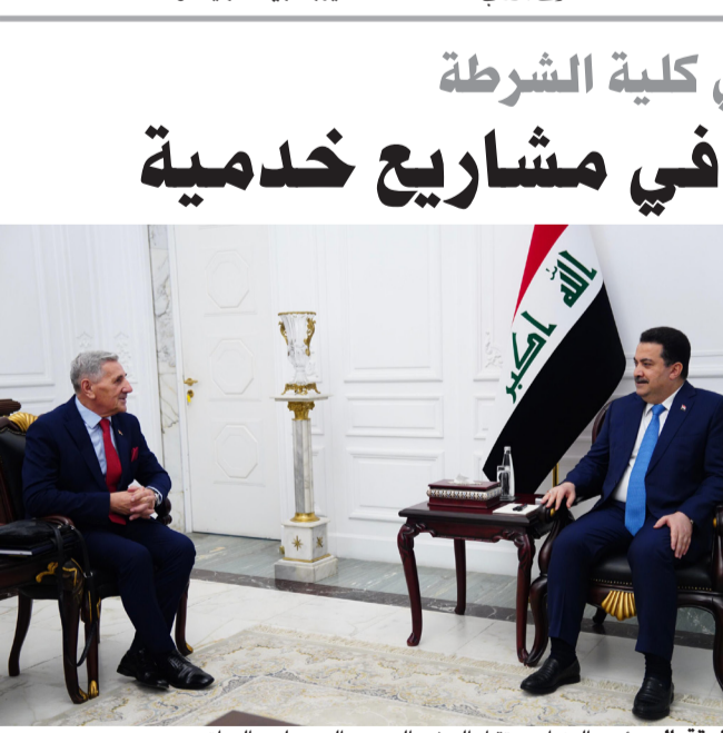
استقبال: رئيس الوزراء يستقبل السفير الصيني الجديد لدى العراق

قصة حضارة بابل التي كانت تحت حكم حمورابي، بذلك، يجسد الكتاب تواصل القيم بين الأديان السماوية وحضارة العراق التي قدمت للبشرية نظاماً تشريعية كانت أساساً للعدالة.