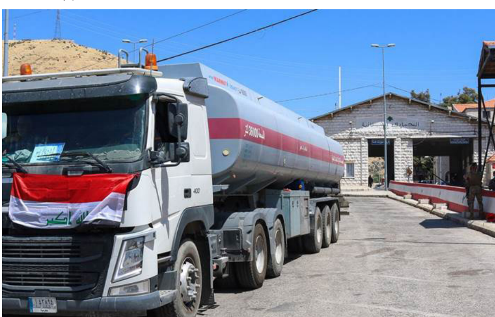
وقود - قناتل عراقيّة محمّلة بالوقود في الارض اللبنانية

الوزراء، محمد شياع السوداني، وبين انه احد المشاريع الاستراتيجية المهمة التي تعول عليها الوزارة لدعم الخزين النفطي، مشيراً إلى إنجازه 65 بالمئة من مجمل المراحل، على مساحة تصل الى نحو الف دونم، وفق المواصفات الفنية المطلوبة، وأوضح حمود ان (إيجاد المزيد من المستودعات النفطية التي تعمد عليها العراق في استقرار معدلات صادراته من الخام، وتابع ان (المستودع يتألف من 7 خزانات، 4 منها لخزن النفط الثقيل، ويخصص المتبقي للنفط الخفيف، الى جانب إنشاء خزائين للإغاثة).