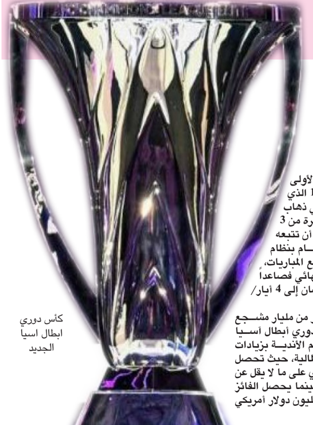
كأس دوري أبطال آسيا الجديد

بكين، (أ ف ب) - اصدرت محكمة صينية الإثنين حكماً بالسجن لمدة 11 عاماً على النائب السابق لرئيس الاتحاد الصيني لكرة القدم بتهمة تلقي الرشى، وذلك في سياق حملة واسعة النطاق تقوم بها الدولة ضد فساد الموظفين الرسميين. فرض غرامة واعلنت محكمة جينغجو في مقاطعة هوبي أنها ادانت لي يو بي النائب السابق لرئيس الاتحاد الصيني لكرة القدم وفرضت عليه غرامة كذلك قيمتها نحو 127 ألف يورو، فيما استصدرت الملكات الأخرى التي حصل عليها عن طريق الفساد وتسلم إلى الدولة. واعترف لي في آذار/مارس الماضي بتسوية ون المدير السابق للإدارة داخل الاتحاد لجمع أموال وهدايا قيمتها أكثر من 1.5 مليون يورو بين عامي 2014 و2021. وطالبت حملة واسعة النطاق ضد فساد الموظفين الرسميين في الأشهر الأخيرة.