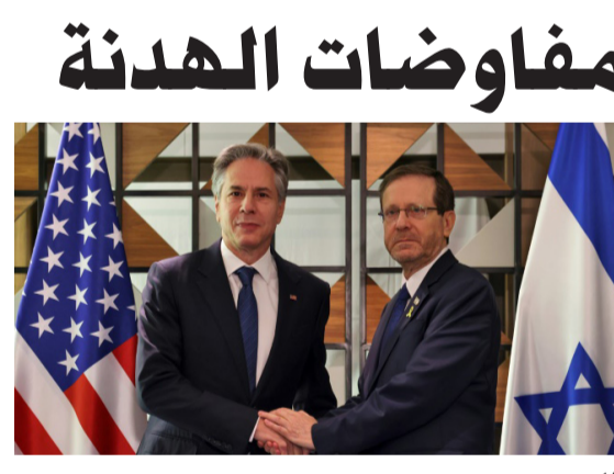
لقاء : وزير الخارجية الأمريكي خلال لقائه الرئيس الإسرائيلي

تصعيد وعدم حصول استقرارات وعدم حصول أي أعمال يمكن أن تعهدنا بأي شكل من الأشكال عن إنجاز هذا الاتفاق أو تؤدي إلى تصعيد النزاع وتوسيعه إلى أماكن أخرى وزيادة حذت. من جانبه، قال زعيم المعارضة الإسرائيلية يائير لابيد عبر حسابه على تويتر عندما يقول وزير الخارجية الأمريكي ربما هذه فرصة أخيرة للتوصل إلى اتفاق، فهذا نداء لتناجيوه بأن لا تقوّت هذه الفرصة، ولا تدخلت في السبعين من تشرين الأول الماضي إنها (الحلقة حاسمة)، على الأرحب أفضل وربما آخر فرصة لإعادة الإصرى إلى ديارهم والتوصل إلى وقف إطلاق نار ووضع الجميع على طريق أفضل إلى سلام وأمن دائمين). والتقى بليكن أمس، رئيس المكتب السياسي لحركة حماس اسماعيل هنية في طهران في 31 تموز الماضي خلال عملية نسبت إلى إسرائيل، كما اغتيال القائد العسكري في حزب الله فؤاد شكر قبل ساعات من ذلك في غارة إسرائيلية على ضاحية بيروت الجنوبية. ودعا نتانياهو السدي بواجب ضغوطا داخلية للمضي في الاتفاق إلى (توجيه الضغوط على حركة حماس وليس على الحكومة