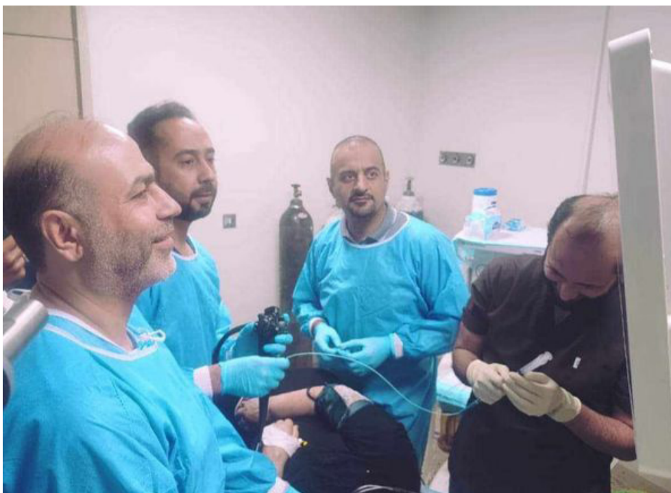
فريق أطباء يعالجون مريضاً ضمن الفريق

الحديثة تقني عن العمليات التقليدية، بموجب إجراء جرح لا يتجاوز 10-15 سنتيمتراً، وبحسب قوله.