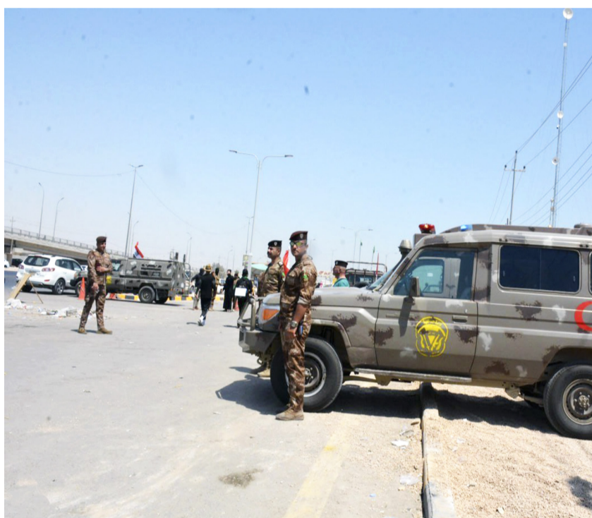
أمن: عناصر أمن في سيطرة لحماية الزوار