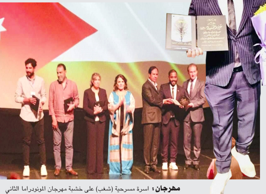
مهرجان: أسرة مسرحية (شغب) على خشبة مهرجان المونودراما الثاني