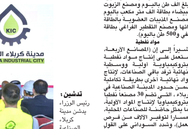
مدينة كربلاء الصناعية KARBALA INDUSTRIAL CITY