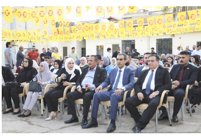
إحتفالية: جانب من الإحتفالية

الزمن - السنة السابعة والعشرون العدد 7963 الأحد 13 من صفر 1446 هـ 18 من آب (أغسطس) 2024 Azzaman Arabic Daily Newspaper Vol/27.UK