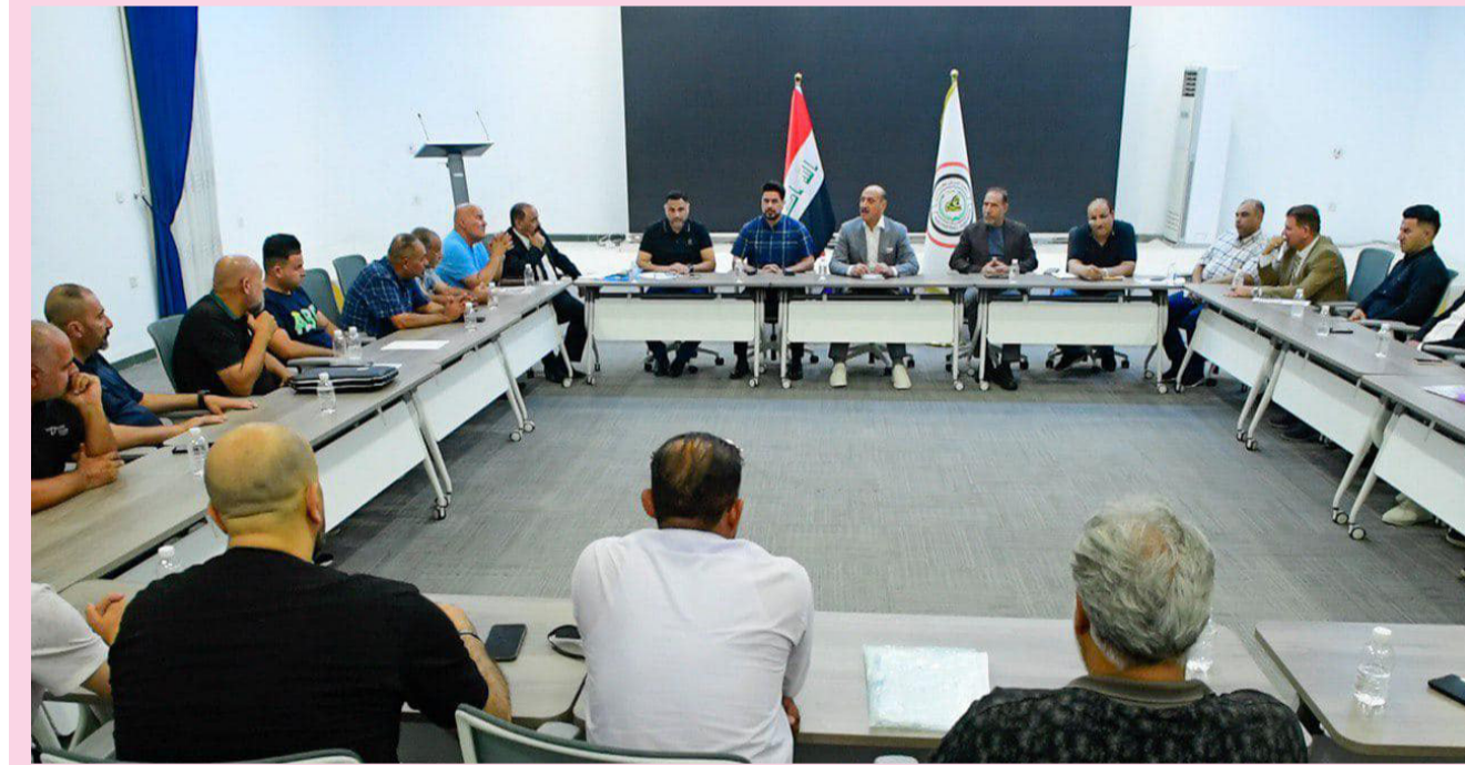
لقاء: رئيس اتحاد كرة القدم خلال لقائه مع ممثلي اندية الدرجة الأولى

وبين رئيس الاتحاد في أهمية الدورة تكمن في إضافة المعلومات الفنية، والارتقاء بها من أجل تطوير واقع لعبة كرة الصالات من خلال منافسات دوري المحترفين. وأكد درجال من المهم أن يواكب المدرب العراقي أهم التحديتات الحاصلة في الحقل التدريبي، والأهم أن ينقلوا ذلك