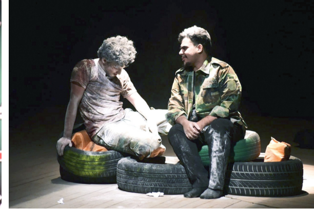
مهرجان: لقطات من مهرجان الطف المسرحي الحسيني بسنخته الرابعة