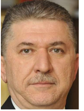
مهند حسام الدين البياتي

بغداد - ندى شوكت نعي ديوان رئاسة الجمهورية، ورئيسه الأسبق مهند حسام الدين البياتي، الذي وافته المنيّة اثر وعكة صحية مفاجئة. وقال رئيس الديوان كامل كريم الديلمي في بيان مقتضب (بالعجز والاحزان والاسى تلقينا نبأ رحيل رجل وطني ووزير مهني طالما اعطى لبلاده الكثير، نغمد له بواسع رحمته واله أهله وذويه الصبر والسلوان). وشغل البياتي، منصب رئيس ديوان الرئاسة في عهد الرئيس السابق برهم صالح، كما شغل مناصب عدة منها سكرتير اللجنة الوزارية للأعمار والخدمات في مكتب رئيس مجلس الوزراء، وعمل قبلها مدير عام في المكتب ذاته، تسلم البياتي مهام وظيفة مدنية سابقة، حيث عمل استاذ محاضر في جامعة بغداد بين عامي 1997-2003، وبعدها شغل نائب المفتش العام في وزارة الداخلية ومدير عام لمديرية الشؤون الداخلية، ودخل قبلها في العمل الوظيفي الحكومي عام 1990، وعمل في المؤسسات الأكاديمية والفنية مثل كلية الشرطة والمعهد العالي للضباط وغيرها.