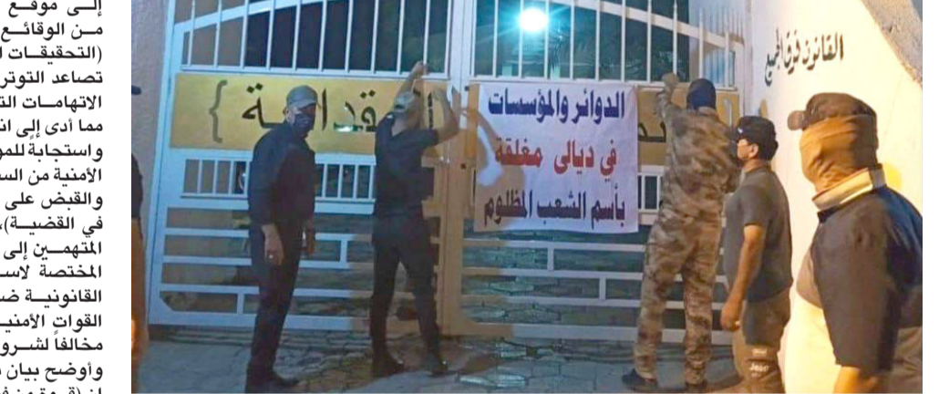
غلق : مجموعة من عشيرة في القادبية تضع عبارة الغلق على مركز للشرطة

بغداد - قصي منذر ديالى - سلام الشمري أقدم العشرات من أبناء قبيلة بني تميم، على إغلاق عدد من الدوائر الحكومية في قضاء المقدادية بمحافظة ديالى، احتجاجا على عدم تنصيب أحد أبناء القبيلة محافظا. وقال مصدر أمني لـ (العشرات) أمس إن (العشرات من قبيلة بني تميم في القضاء خرجوا بتظاهرة احتجاجا على عدم تنصيب أحد أبناء القبيلة محافظا ديالى، وقاموا بغلق عدة دوائر حكومية من بينها قسم شرطة القضاء).