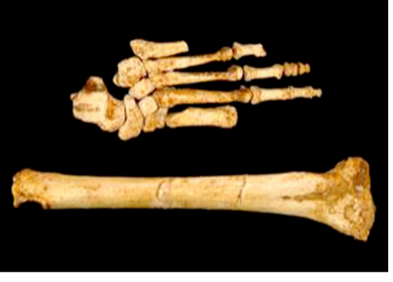
عظمة ذراع إنسان فلوريس، وهي أصغر من الاعتيادية، بينما قبل بحجم الفيلة، وتشبه أسنان الكنتشة حديثاً نسختها أصغر من إنسان الإنسان المنتصب، بحسب فريق بحثي.