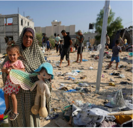
دمية : امرأة فلسطينية تحمل طفلا ودمية في مخيم الموصي في جنوب قطاع غزة، منذ سنوات بلا كل التصدي مسؤولين أمريكيين لاغتتيال الجنرال قاسم سلطاني بغارة أمريكية في بغداد في 2020. وقال وزير العدل ميريك غارلاند في بيان أمس إن (وزارته تعمل

(إيران تستعد لضرب اهداف إسرائيلية ولكن جرى الاتفاق على أن تكون ضربة محدودة). من جهته، قال الأمين العام لحزب الله حسن نصرالله في بيان أمس إن (حزبه وإيران ملتزمان بالرد على إسرائيل ايا تكن العواقب). في غضون ذلك، كتب وزير الخارجية الإسرائيلي يسرئيل كاتس على منصة إكس أن (تعيين السنوار على رأس حماس خلفا لهنية، سبب إضافي لتصفيته سريعا ومحو هذه المنظمة من الخارطة). وحثهم كل من إيران وحماس وحزب الله، إسرائيل باغتال هنية في طهران بعد ساعات على اغتيال القيادي في حزب الله فؤاد شكر في ضربة إسرائيلية استهدفت