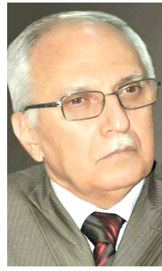
عبد الرزاق العيسى

بغداد - الزمان اقال وزير التعليم العالي والبحث العلمي عبد الرزاق العيسى مفتش عام الوزارة ضياء محمد مهدي باقر المولوي، وتضمن امر وزاري اصطلت عليه (الزمان) امس انه (استنادا الى احكام المادة 2/2 من الامر 57 لسنة 2004 والامر الديواني 185 الصادر بالعدد 6005/78/2 ر ن/ر