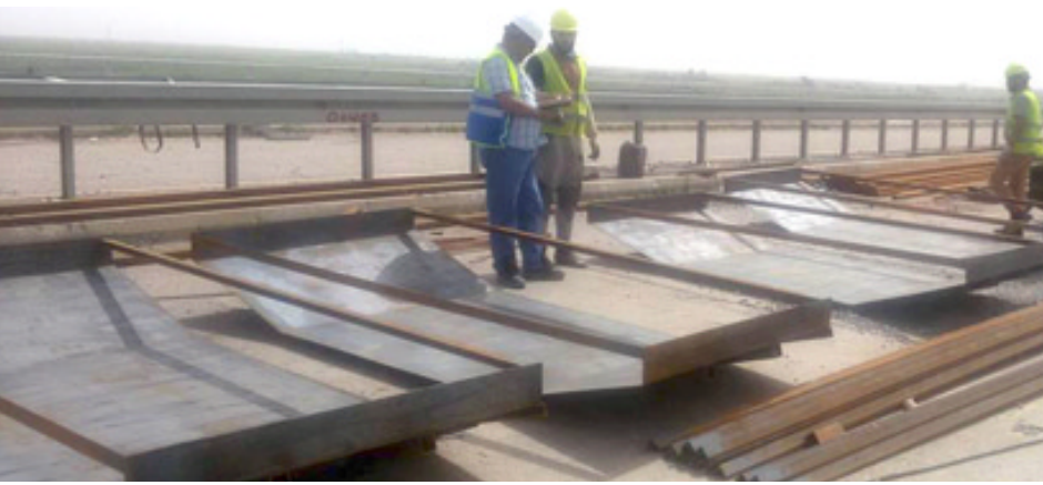
إعمار: مهندسو الإعمار يؤهلون جسراً دمعراً

بغداد - الزمان اعلنت وزيرة الاعمار والاسكان والبدييات والاشغال العامة ان نافع اوسي مواصلة صندوق الإسكان العراقية إجراء عمليات الكشف على الوحدات السكنية في بغداد