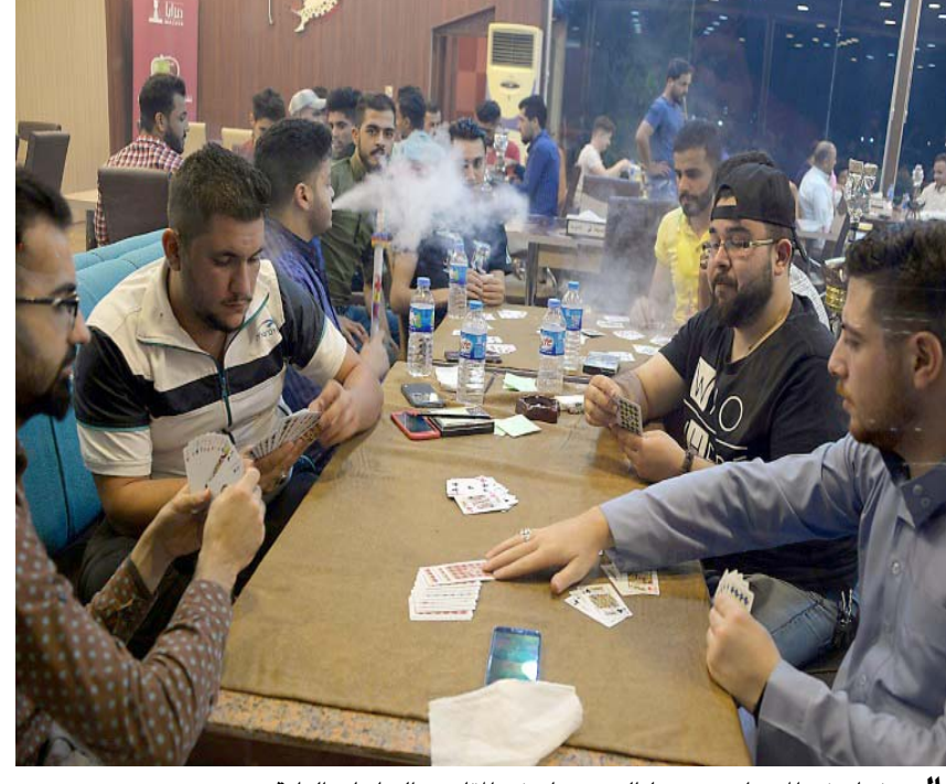
ليل: شبان في الموصل يعضون ليالي رمضان في المقاهي والساحات العامة

بغداد - عبد اللطيف الموسوي أثار قرار مجلس النواب إلغاء انتخابات الخارج والتسويت المشروط في مخطات الناخبين في الانتصار وصل الدين ونيوتى وديالى ريدود فعل متباينة بين مرعب ورافض، فسيما دعا رئيس الجمهورية الجهات المعنية بما فيها مفوضية الانتخابات إلى الالتزام التام بإحكام الدستور والقوانين النافذة في هذا الشأن، واتساع السبل الاصولية بخصوص النظر الاتحاد الوطني الكرستاني الى رفض القرار ووصفه بأنه (أخطر إنتهاك للدستور) وقال بيان رئاسي تلقته (الزمان) اسن ان رئيس الجمهورية فؤاد معصوم ( يتابع بإهتمام بالغ وعن كثب التطورات المستحقة بشأن عملية اعلان نتائج انتخابات مجلس النواب بدورته الرابعة بخار من وجهات نظر واتهامات تفيد بحصول خروقات او تدخلات قد تكون اثر في النتائج في مركز انتخابي او اخر، مضيفاً ان (رئاسة الجمهورية تدعو كافة الهيئات والجهات المعنية بما فيها المفوضية العليا المستقلة للانتخابات إلى الالتزام التام بإحكام الدستور والقوانين النافذة في هذا الشأن، وتشدد على لزوم اتباع السبل الاصولية التي رسمتها القوانين والقرارات بخصوص النظر في الطعون والاعتراضات وكافة القضايا ذات الصلة بالانتخابات (اعلام). وعضو السببان قائل ان رئيس الجمهورية (حريص على تنفيذ كافة الاجراءات الضرورية للحفاظ على سلامة العملية الديمقراطية وفقاً لإحكام الدستور ولما يحمي المصالح الوطنية العليا للبلاد)، وكان مجلس النواب قد صوت اول امس الاثنين، في جلسة استثنائية، على قرار يبابي يقضي بإلغاء انتخابات الخارج والتسويت المشروط في مخطات الناخبين في الانتصار وصل الدين ونيوتى وديالى بال صلوات عليه الا ان