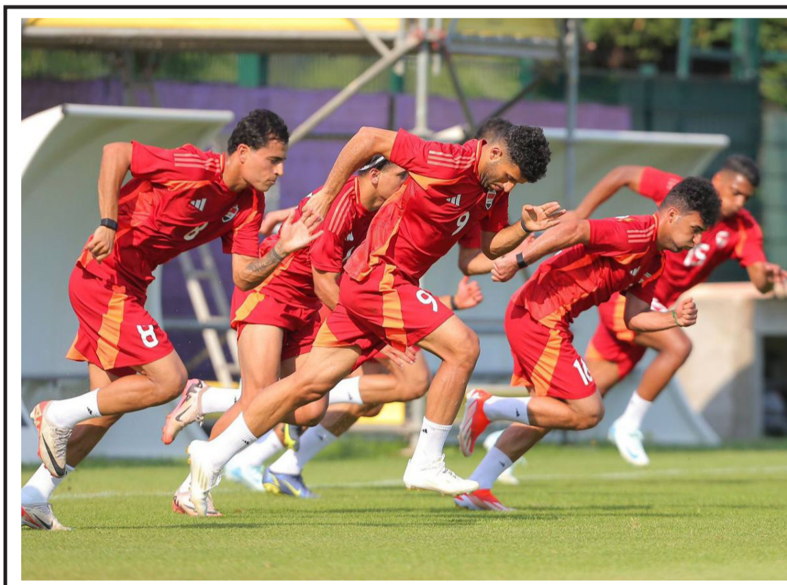
مباراة : جرت أمس مباراة بين المنتخبين العراقي ونظيره المغربي في اخر مواجهات المجموعة الثانية ضمن منافسات بطولة اولىبياد باريس 2024، نتيجة اللقاء على الموقع الإلكتروني لجريدة (الزمان).

بغداد - قصي منذر استغرب موظفون في وزارة التربية من استقطاع رواتبهم من المدارس للمساهمة ببناء المدارس مقابل تصرف الحكومة منحة للأحزاب التي لم تستقطع رسوم طابع الحملة الوطنية ومقداره الفتي دينار خلال عام كامل وذلك بسبب تلوّن عدد من المديرين، مشيرا إلى إن الاستقطاع ورد في قانون رسم طابع الحملة الوطنية لبناء المدارس ورياض الأطفال