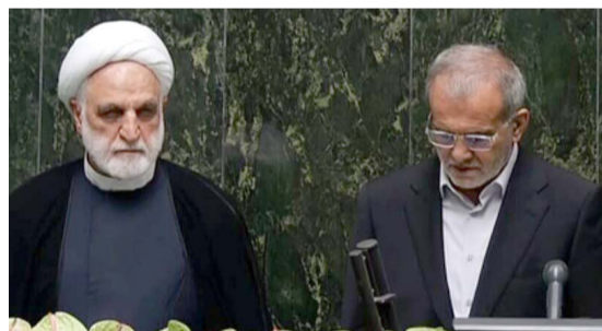
تنصيب : الرئيس الإيراني خلال حفل تنصيبه

طهران - رزاق نامقي وصل رئيسا الوزراء الاتحادي محمد شياع السوداني وقليم كردستان نجيفرمان البارزاني، إلى العاصمة الإيرانية طهران للمشاركة في مراسم تنصيب الرئيس مسعود بزشكيان. وقال بيان تلقته (الزمان) أمس إن السوداني وصل إلى طهران لتلبية لدعوة رسمية للمشاركة بمراسم تنصيب بزشكيان، ووصل البارزاني، في وقت سابق، إلى طهران للمشاركة في تنصيب الرئيس الإيراني. كما وصل رئيس البرلمان الإيرانية محسن المندلوي، إلى طهران بناء على دعوة نظيره الإيراني محمد باقر قاليباف. طهران - رزاق نامقي وصل رئيسا الوزراء الاتحادي محمد شياع السوداني وقليم كردستان نجيفرمان البارزاني، إلى العاصمة الإيرانية طهران للمشاركة في مراسم تنصيب الرئيس مسعود بزشكيان. وقال بيان تلقته (الزمان) أمس إن السوداني وصل إلى طهران لتلبية لدعوة رسمية للمشاركة بمراسم تنصيب بزشكيان، ووصل البارزاني، في وقت سابق، إلى طهران للمشاركة في تنصيب الرئيس الإيراني. كما وصل رئيس البرلمان الإيرانية محسن المندلوي، إلى طهران بناء على دعوة نظيره الإيراني محمد باقر قاليباف.