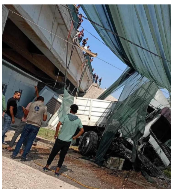
حادث : شاحنة كبيرة تسقط من أعلى جسر الامام علي في النجف

النجف - سعدون الجابري اطاحت مديرية الإستخبارات والامن في وزارة الدفاع، بـ 7 تجار مخدرات خلال عمليات نوعية نفذت في محافظتي بغداد والنجف، وقال بيان تلقته (الزمان) أمس إن (بمراجعة ميدانية دقيقة وبجهود استخباري تمكنت مفاز مديرية استخبارات وامن بغداد من الاطاحة بخمسة تجار ومروجي المواد المخدرة، وذلك من خلال وجودهم في مناطق متفرقة من بغداد، صادرة بحقهم مذكرة قبض وفق احكام المادة 28 مخدرات، ضبط بحوزتهم كميات من الحبوب المخدرة وادوات تعاطي واسلحة خفيفة، حيث تم تسليمهم اصوليا إلى الجهات المعنية، مؤكداً إن مفاز المديرية في محافظة النجف الفت القبض على اثنين من تجار المخدرات بالجرم المشهود وفق مذكرة قبض صادرة بحقهما 28 مخدرات، كما ضبطت مفاز المديرية، بمظنومة مراقبة إلكترونية كدسا كبيرا من الاسلحة