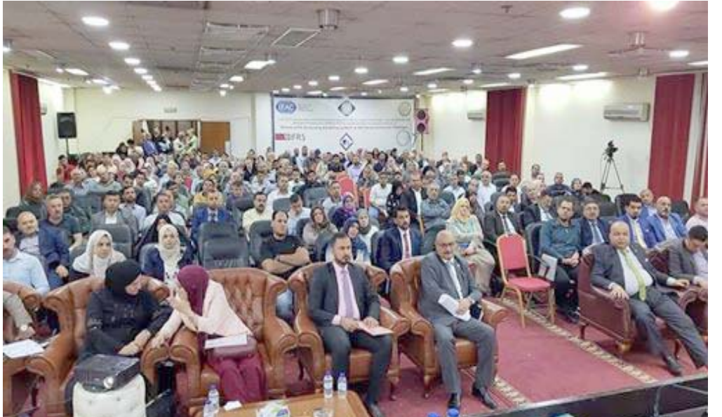
جانب من الحضور المؤتمر المحاسبي العربي الخامس

«تم طرح البيان الختامي توزيع الشهادات للمشاركين ودرع المؤتمر.