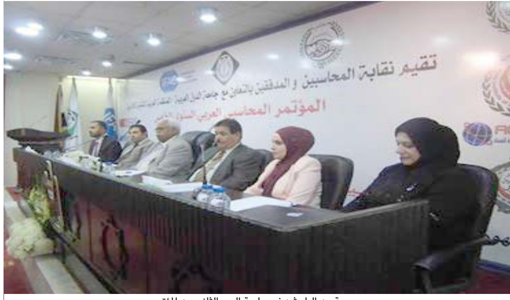
مجموعة من الباحثين في جلسة اليوم الثاني من المؤتمر

تنطلق رؤية نقابة المحاسبين والمدققين في العراق من اهمية عقد هذه المؤتمرات الدولية وبشكل سنوي وفي مواعيد محددة ضمن برنامجها العلمي والبحثي لتطوير قدرات المحاسبين والمدققين وتزويدهم بالمعرفة الحديثة والتعرف على معايير المحاسبة الدولية والاحاطة بها لرفع الكفاءة وزيادة المهارة في مجال المحاسبة والتدقيق بصيغتهما الحديثة والمتطورة.