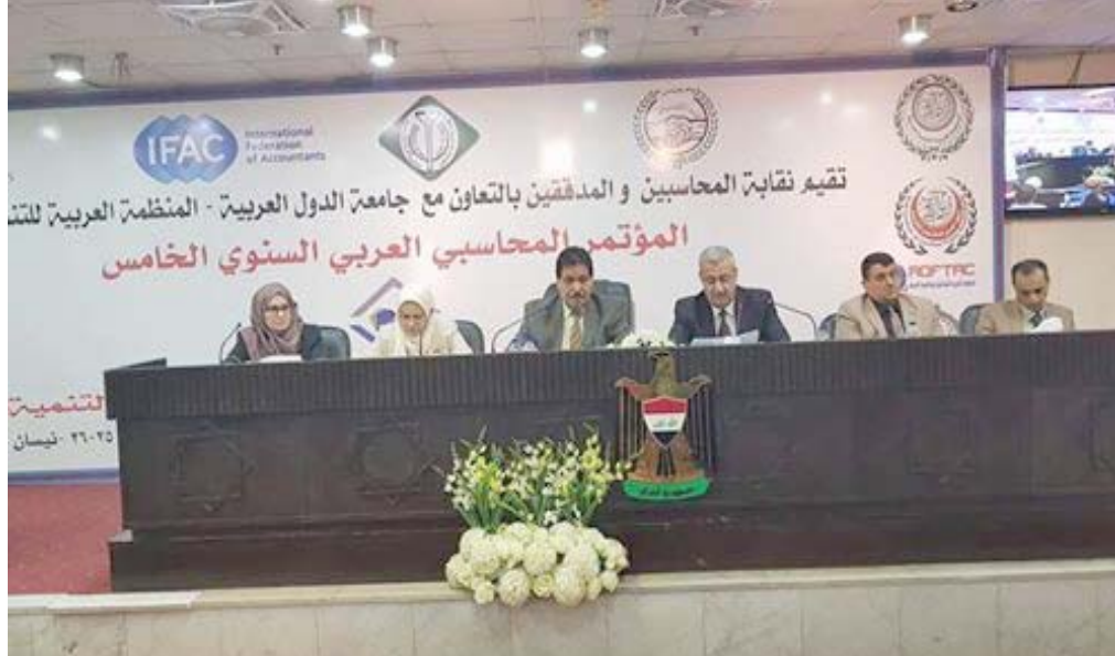
مجموعة من الباحثين في الجلسة الثانية للمؤتمر