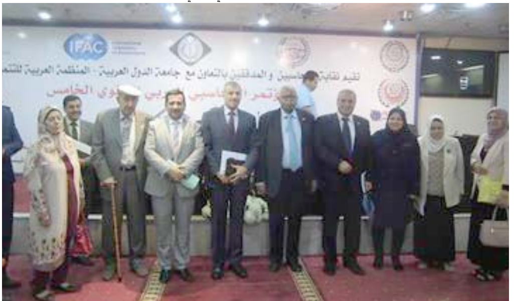
مجموعة من المشاركين في المؤتمر