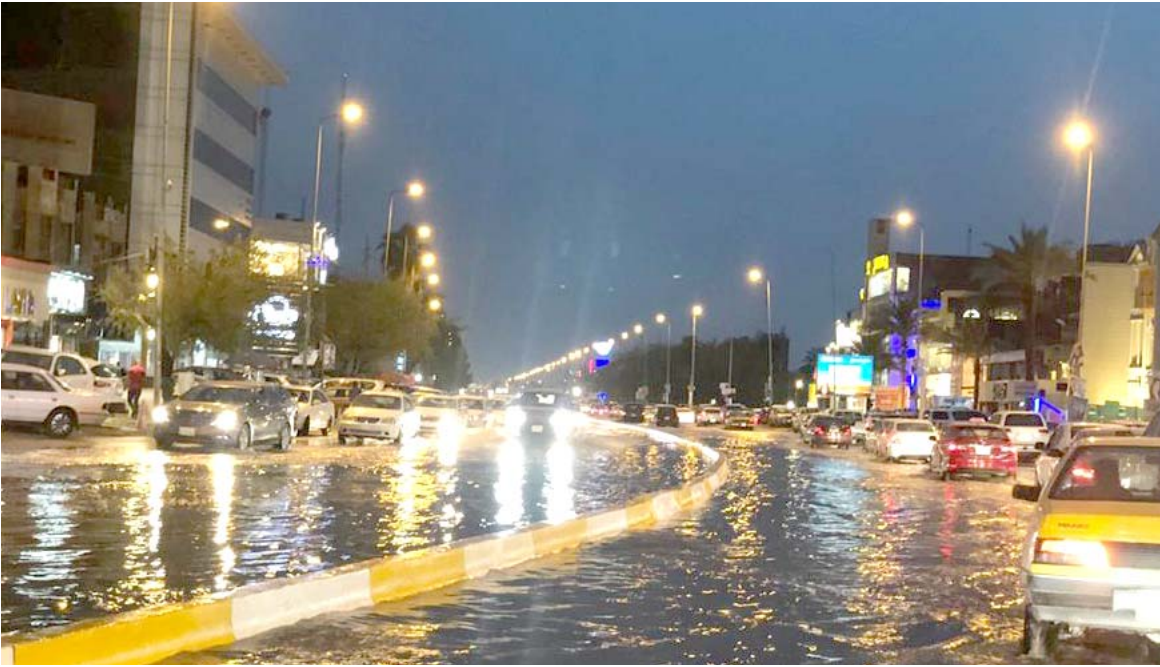
امطار : هكذا بدت شوارع بغداد خلال هطول امطار متوسطة الشدة أمس

العمليات في الوزارة قام بتشكيل غرف مشتركة الأولى مع مديريات الصحة في محافظات كربلاء وبابل والنجف لتقديم المساعدات الطارئة، والأخرى مع عمليات بغداد والعمليات المشتركة وراسدة (الوزراء) مشيراً الى ان (الوزارة) ستشارك في خطة نقل الزائرين حيث ستقوم بتهيئة عدد من الحافلات سعياً لارتكاب فقا فوق ذلك الرض وسنكون تحت إمره محافظة كربلاء) وضعت قوات الحشد الشعبي وبالتنسيق مع القوات الامنية خطة أمنية لتأمين الزيارة تشمل عمليات استباقية ومسح جميع المساحات العامة وقال بيان اعلام الحشد اس ان قيادة شرطة محافظة النجف اعطت اجتماعاً حضره معاون مدير مكتب الحشد الشعبي بهدف وضع خطة لتأمين الزيارة وتهيئة جميع المستلزمات اللوجستية