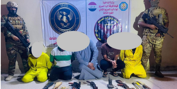
مخدرات : القوات الامنية تلقى القبض على تجار المخدرات

وفق المادة 28 من قانون مكافحة المخدرات وإرسال المواد المخبولة بحوزتهم إلى جهة الاختصاص. إلى ذلك، ضبطت عمليات بغداد، 32 متسولاً ومخالفاً لشروط وضوابط دائرة الإقامة والجنسية. وأوضح بيان تلقته (الزمان) أمس إن جهودها في ملاحقة الخارجين عن القانون أسفرت عن القبض على 9 متهمين وفق مواد قانونية مختلفة و32 متسولاً ومخالفاً لشروط وضوابط دائرة الإقامة والجنسية، بينهم نساء وأطفال. وضبط متهم آخر اقدم على بيع المواد الكحولية دليفرى، وذلك ضمن مناطق الكراة والإعلامية وبغداد الجديدة والشعب بجانب الرصافة، واتخاذ الإجراءات القانونية اللازمة بحقهم). وأضاف إن القوات الامنية مستمرة بحملاتها في جميع المناطق بهدف منع هؤلاء المتسولين من الوجود في الشوارع والطرق والتقاطعات العامة. في غضون ذلك، افاد مصدر امني، بإلقاء القبض على فتاة وشخصين احدهما طعن شقيقته بحادثين منفصلين في بغداد. وقال المصدر إن (شرطة بغداد الرصافة التقت القبض على شخص قام بطعن شقيقته بمنطقة حسي البساتين بدافع غسل العار)، مؤكداً إن (مغارز القيادة بالتعاون مع الاجهزة الامنية الاخرى توجهت في محل الحادث ، واتضح إصابة امرأتين بعدة طعنات من قبل شقيقتهن اثر خلافات عائلية).