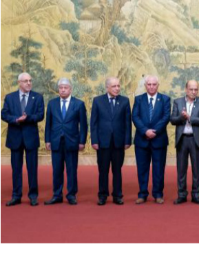
وفود : وزير الخارجية الصيني يتوسط وفود الفصائل الفلسطينية الوحدة إن (بلاده ليست لديها مصلحة ذاتية في ما يتعلق بالقضية الفلسطينية). مؤكداً إن (الصين كانت من اوليات الدول التي تعترف بالمشهد الفلسطيني التي تعترف بمظلمة التحرير الفلسطينية ودولة فلسطين، وانها تدعم دائما الشعب الفلسطيني في استعادة حقوقه الوطنية المشروعة). مبيناً إن (الصين تقترح نهجاً من ثلاث خطوات من أجل الخروج من مازق الصراع الحالي). وأوضح وانغ يي ان (الخطوة الاولى هي تعزيز وقف إطلاق نار شامل ودائم ومستدام في قطاع غزة والصين، بعد وساطتها الناجحة لوصول المساعدات الإنسانية

مؤقتة تحظى بإجماع وطني لإدارة غزة والضفة الغربية بشكل فعال، ومضى وانغ يي إلى القول إن (الخطوة الثالثة تضمنت دعم فلسطين لتصبح عضواً كاملاً للعضوية في الأمم المتحدة والبدء في تنفيذ حل الدولتين). مشيداً على (عقد مؤتمر سلام دولي أكثر أهمية وأكثر الزامية وفعالية، فضلاً عن وضع جدول زمني وخارطة طريق لتحقيق ذلك). لافتاً إلى إن (وقف إطلاق النار وتوفير الإغاثة الإنسانية باتيان على رأس الاولويات). ووجد تأكيد إن (الفلسطينيين يحكمون فلسطين، هو المبدأ الأساسي لإعادة اعمار غزة بعد الحرب، وان حل دولتين هو السبيل الأساسي إلى المستقبل). وأشار إلى إنه (يجب على المجتمع الدولي أن يدعم الأطراف المعنية في تنفيذ النهج المؤلف من ثلاث خطوات عبر تدني موقف جاد، وارتفعت حصيلة الشهداء في غزة إلى 39 الفا و 145 شهيداً. وقالت بيان لوزارة الصحة الفلسطينية أمس إنه (تم 55 شهيداً نقل إلى المستشفيات خلال الساعات الماضية). وأضافت إن (اجمالي عدد الجرحى يبلغ 90 الفاً و 257 إصابة منذ السابع من تشرين الأول الماضي).