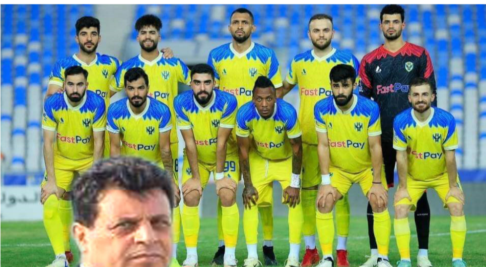
بطولة: بطولة نادي دهوك يستعد لتمثيل العراق في بطولة اندية الخليج