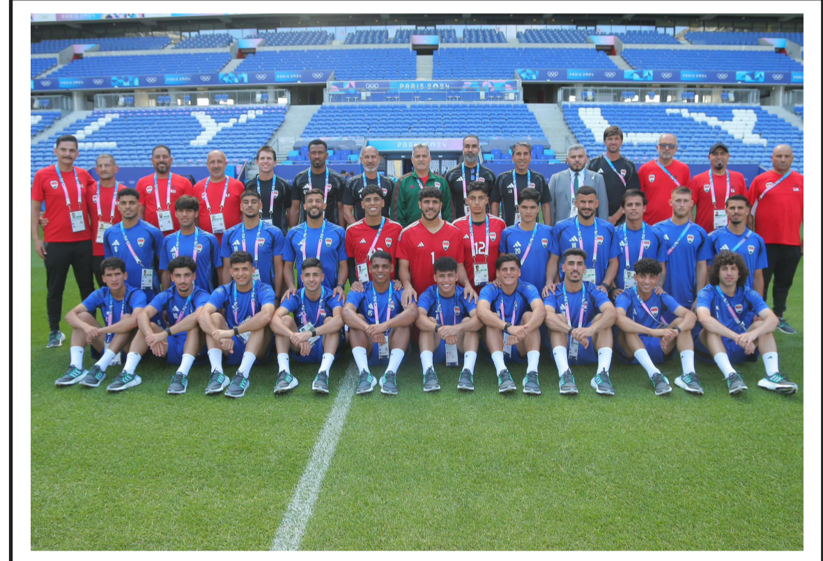
مباراة : المنتخب الاولبي العراقي يقابل نظيره الاوكراني ضمن اولياد باريس. نتيجة المباراة على الموقع الالكتروني