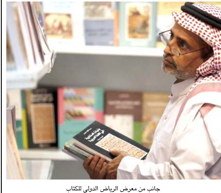
جانب من معرض الرياض الدولي للكتاب

الفرنسية، "وشاكرت في المعرض 520 دار نشر محلية وعربية وأجنبية من 27 دولة إضافة إلى عدد من الوزارات والهيئات الحكومية السعودية. وجانب بيع الكتب نظم المعرض 80 فعالية ثقافية تنوعت بين الندوات الفكرية والأمسيات الشعرية واللقاءات الحوارية وورش عمل. وقال المغلوث إن عدد حضور المعرض تجاوز 911 ألفاً، وتفاعل مع المتحدثين طيلة أيام الفعاليات الثقافية". وأضاف أن أكثر من 18329 طفلاً استفادوا من 23 فعالية أقامها جناح الطفل. ويعد معرض الرياض الدولي للكتاب مع معرض جدة الدولي للكتاب الذي يقام في ديسمبر كانون الأول أبرز حدثين ثقافيين سنويين في المملكة وانضم إليهما هذا العام معرض التقسيم للكتاب في دورته الأولى.