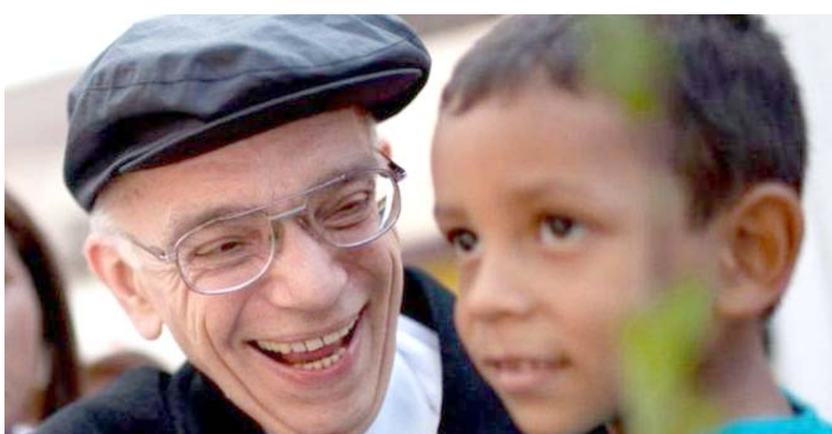
خوزيه آبرو مع طفل من بلاده

الاقتصاد، من أجل الحصول على عمل يعيش منه وعائلته. وعمل خبيرا اقتصاديا لدى الحكومة، كما كان نائباً احتياطياً في البرلمان عام 1960.