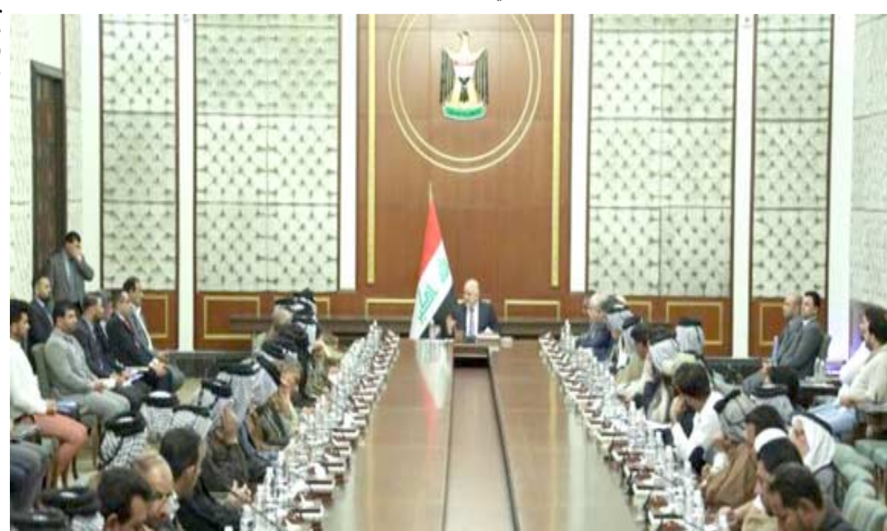
وفد، رئيس الوزراء، خلال لقائه وفدا من اهالي منطقة المعامل

بغداد - داليا احمد وجه رئيس الوزراء حيدر العبادي الجهد الهندسي لدوائر الدولة للقيام بحملة خدمية سريعة في بغداد.وقال مكتب العبادي في بيان امس ان (العبادي وجه الجهد الهندسي لوزارة الاعمار والاسكان والبلديات وجهد محافظة بغداد وبلديات الشعب والغدير وبغداد الجديدة للقيام بحملة شاملة وسريعة في بغداد). مشيرا الى ان (الحملة تتضمن قص الشوارع ورم المستنقعات وازالة الانقاض والمخلفات والقمامة )، ووضح البيان انه سيتم تقسيم منطقة المعامل الى اربعة قواطع تنولى كل جهة تنفيذ ما يتعلق بها، وتابع انه (وجه ايضا دائرة توزيع كهرباء