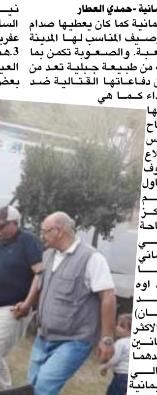
الفرح والبهجة والديكبات الكردية تعم المناطق السياحية والأهالي يرون الفرحة ناقصة

العرب والاجانب، على الرغم من الجمال الطبيعي والطقس النموذجي والحدج الكبير من السعادة والفرح والرفاهية التي يوفرها هذا المكان فحنج سجلنا ملاحظتنا حول ضرورة الاهتمام وتطوير المركز السياحي احمد او كما من الضروري جدا وجود تفريك في سد دوكان بما يتبته ما موجود على جبل ازمر وهو المكان السياحي الثالث الذي شمله الاستطلاع وكان برفقتنا ضيف من السودان وزوجته للتعرف على المعالم السياحية في السليمانية. حماس المشاركة عبد نيروز في السليمانية هذا العام مختلف ولو لا كثافة السياح من المحافظات العراقية بغداد والجنوبية لكان الاحتفال بهجده العيد لهذه السنة متواضعا ولعدة اسباب:- 1. الوضع الاقتصادي الصعب بسبب انقطاع او الاضرار الجباري لرواتب الناس البسطاء هنا وهناك يدفع الشعب الكردي ضريبة الاختلافات السياسية حتى ان البعض في السليمانية يقطع الفرخ او الاحتفال بعيد عشرين. وما يصيب ساكنها الكردي في سوريا من مصائب الحرب يعكس على نفسية الكرد في السليمانية فالكرد قومي واحدة فيخجل البعض من الاحتفال.وبمجرد انتهاء اعياد