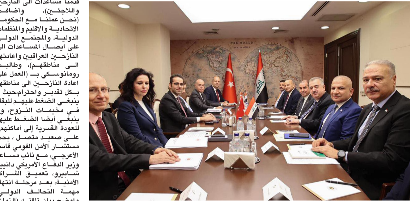
اجتماع : الجانبان العراقي والتركي باجتماع في انقرة