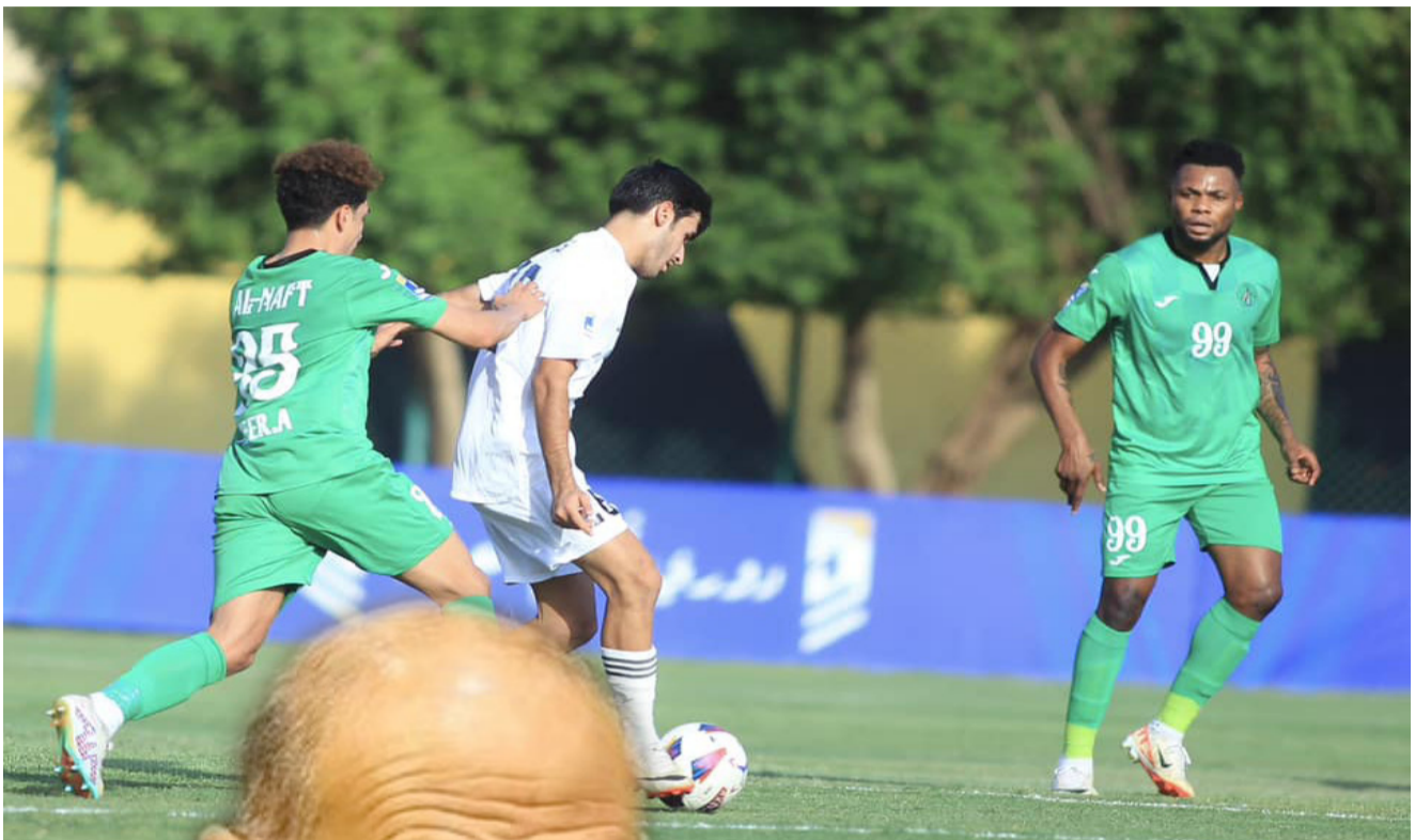
مواجهة: إحدى مواجهات دوري المحترفين بكرة القدم