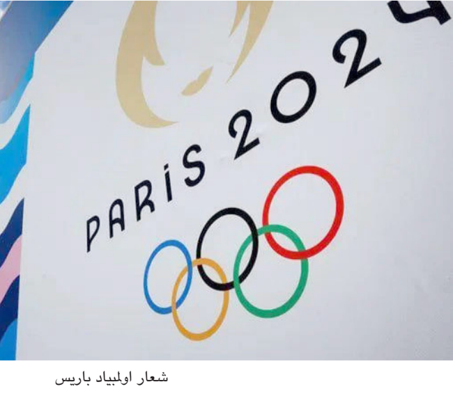
شعار اولمبياد باريس

بغداد- الزمان تستعد بعثة اللجنة الأولمبية الوطنية العراقية للمشاركة في دورة الألعاب الأولمبية الصيفية 2024 في باريس نهاية شهر تموز الحالي، بهدف نوعي يصطح لتحقيق نتائج مشجعة للانتقال إلى مرحلة جديدة في عملية صناعة البطل الأولمبي. وأكد رئيس اللجنة الأولمبية الوطنية العراقية عقيل مفتن، أن (البعثة العراقية تتحمل ثقل الواجب الوطني المشرف والمستمد من عزيمة العراقيين