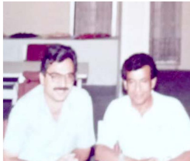
رئيس التحرير سعد البزاز

لا يستطيع اقرب الناس اليه، ان يملك اية معلومة عن وضعه المعاشي العام، لكنه على العموم ظل مستورا اقتصاديا • وفق معلومات متواترة، كان يتنزع الانغام التي تواجهه بمهارة كاسحة تتحرك بنكاء فطري جنوبي مدعوم بمواويل حزن الدنيا دون ان يترك أحدا يحمل في متواليته تبادل ادوار بين الارتواء والعطش .