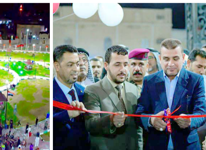
افتتاح محافظة ذي قار مرضى عيود الابراهيمي يفتتح منتزه البطحاء

الناصرية - باسم الركابي تطلق ميسان بغداد، حزمة جديدة من المشاريع الخدمية لتاهيل مدينة الكاظمية، برعاية قوائم الوزراء، محمد شياع السوداني. وأشار بيان تلقته (الزمان) امس الى (تحقق نتائج كبيرة في حركة البناء والاعمار بالعاصمة، بإشراف رئيس الوزراء، محمد شياع السوداني،