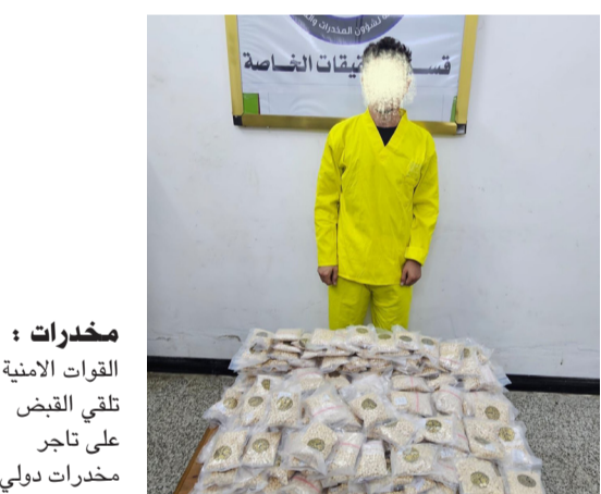
مخدرات : تلقى القبض على تاجر مخدرات دولي

في تقاوم المشكلة، حيث تسير على الطرقات أعداد كبيرة من المركبات غير الصالحة تماماً للاستخدام، كما أن الإزحام يزيد من احتمالات وقوع الحوادث. وأطلق صاروخ على نقطة تفتيش تابعة لقوات البشمركة في أميدي بمحافظة دهوك، مما أدى إلى إصابة شخص واحد بجروح وقال شهود عيان إن (معارك تدور بين الجيش التركي ومسلي حزب العمال الكردستاني ببينما اقامت قوات البشمركة عدداً من الحواجز العسكرية في المنطقة التي تقع تحت سيطرتها)، مؤكداً إن (الصاروخ أطلق بالقرب من قرية سركلية، التي تقع على بعد سبعة كيلومترات شرق منطقة أميدي، مما أدى إلى إصابة شخص واحد بجروح). وفي ذي قار ، تعرض موكب حسيني لهجوم مسلح وسط مدينة الناصرية. وذكر مصدر أمني إن (مسلحين مجهولين يستقلون دراجة نارية فتحو نيران أسلحتهم باتجاه أحد الموكب الحسينية في شارع النيل). وأضاف إن (القوات الامنية طوقت مكان الحادث على الفور، حيث تمكنت من ضبط الرابحة النارية واحد اسلحة الهجوم، بينما لاذ الجناس بالفرار إلى جهة مجهولة).