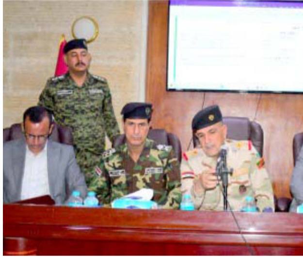
مؤتمر: جانب من المؤتمر الأمني بحضور محافظ ميسان بقيادة العمليات والشرطة