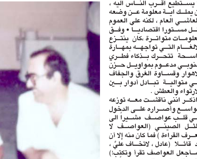
رئيس تحرير الطبعة الدولية