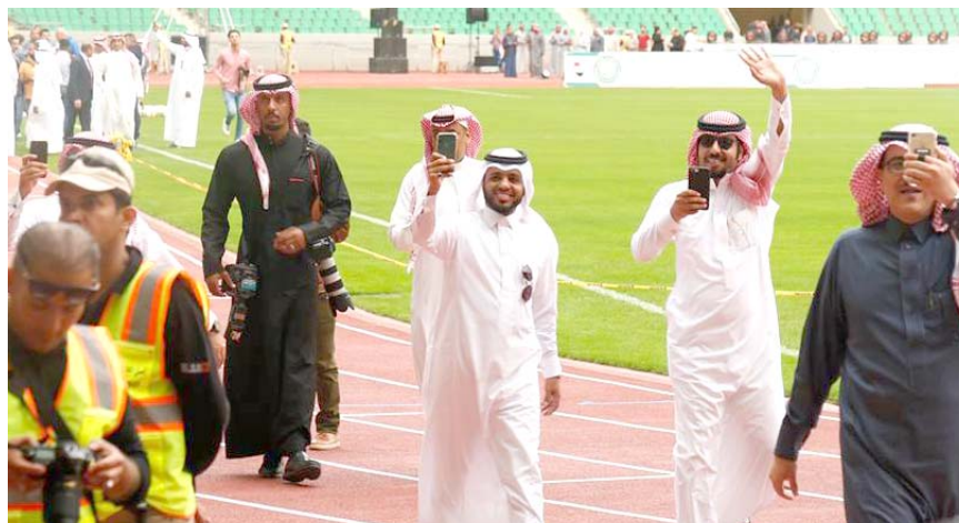
تجوال: الوفد الاعلامي السعودي خلال تجواله امس في ملعب البصرة الدولي