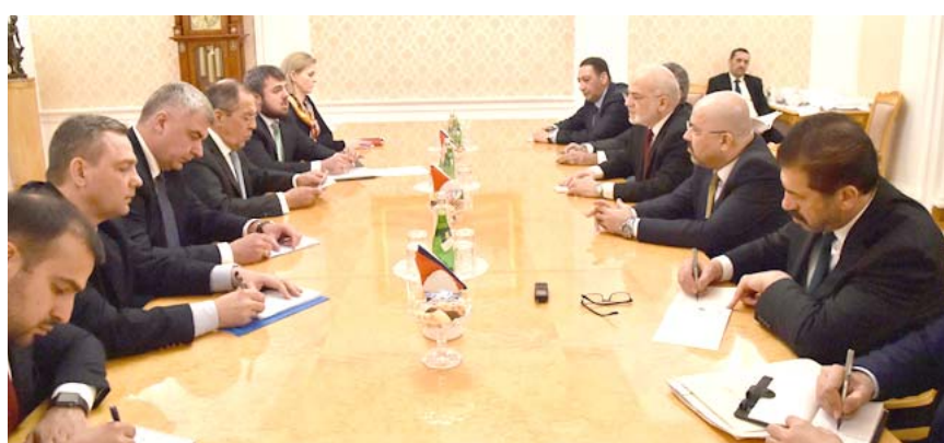
مباحثات: الجانبان العراقي والروسي خلال مباحثاتها امس في موسكو

اتفقا على فتح نقاط حدودية مشتركة، وعلى تشكيل مجلس تشبيقي سعودي-عراقي، مشيراً الى انه (على أساس هذا). عقد لقاء للرئيس فؤاد معصوم مع كبار صحري الصحف والاعلام في السعودية). وبشأن الانتخابات العراقية، تابع عشقني انه (شخصياً يفضل العبادي). وعد العبادي العلاقات العراقية السعودية بانها على الطريق الصحيح. وفيما اشار الى النجاح في واد الطائفية السياسية وأن السياسي الطائفي لزم الصمت). أكد الرئيس فؤاد معصوم ان العلاقات السعودية