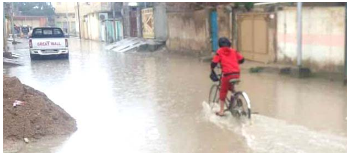
طوفان: شوارع بعقوبة غارقة نتيجة طوفان مياه الامطار