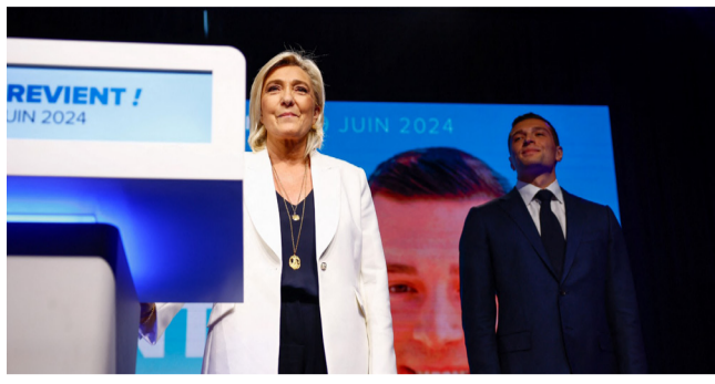
نتائج: مارين لوين بعد اعلان نتائج الانتخابات الأولية

ضابحة المستقبل المادة 8 من الدستور تنص على أن الرئيس يعين رئيس الوزراء، لكنها لا تحدد المعايير التي يجب أن يستند إليها. وعمليا، من المتوقع أن يعرض الرئيس إيمانويل