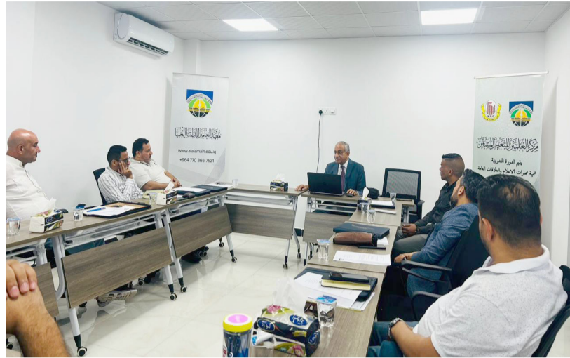
محاضرات: اساتذة في الاعلام خلال الدورة التدريبية

التي تعزز الطاقة في بائية على موافقة الوزير لإعادة تاهيل الكهرباء في المحافظة، وعرض ورقة العمل الخاصة بتاهيل محطات بجني، وإنهاء كل المتعلقة الفنية والإدارية التي تتطلب موافقة رئيس الوزراء لغرض الشروع بالتاهيل وإدخال المحطات الخدمية، فضلا عن رفع عدد المحافظة بالطاقة، وتنوع مصادر الإنتاج، كما حصلت الموافقة على رفع مستوى أقسام الشركة العامة للنقل في صلاح الدين، وإكمال خطوط النقل بالسرعة لغرض تجهيز المحافظة بالحصة المقررة واستيعابها من المنظومة الوطنية.