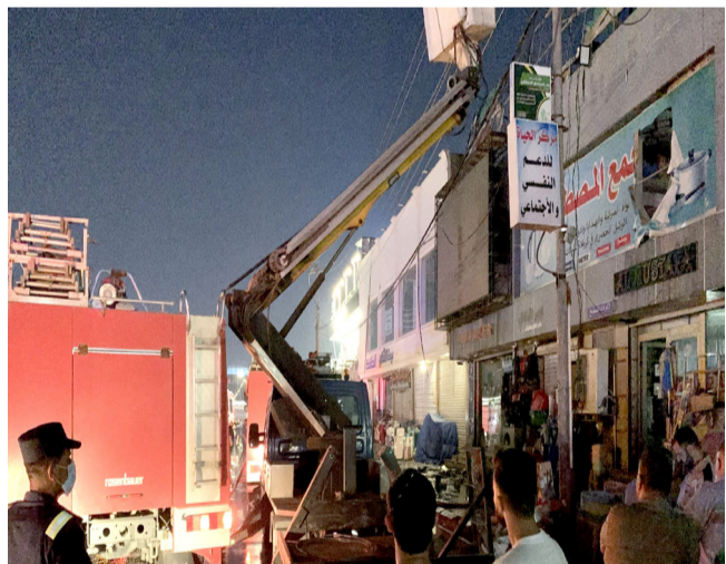
حريق : الدفاع المدني يخمد حريقاً اندلع في مخزن للبلاستيك في كربلاء