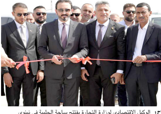
افتتاح : الوكيل الاقتصادي لوزارة التجارة يفتتح ساحة الحلبية في نينوى

وتابع وفد وزاري، البات التسويق في المحافظة، بالتنسيق مع جهاز الأمن الوطني، وقيادة العمليات المشتركة، وبحضور الشعب الزراعية في مواقع القوش والشيوخ، وقطاع مخمور والكوير وديبله، لوضع