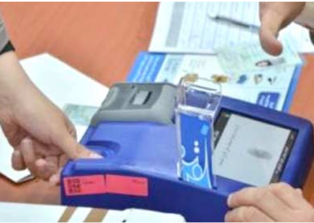
جهاز تسجيل معلومات الناخبين

نعمسة - في تصريح امس ان (الفضيحة الكبرى التي عصفت بتهريب ساعات الانترنت تعادل تهريب انبوب نفطي كامل، حيث ان هذه الساعات تمر من اقليم كردستان الى باقي مدن العراق من خلال محافظة كركوك، وتبلغ السعة