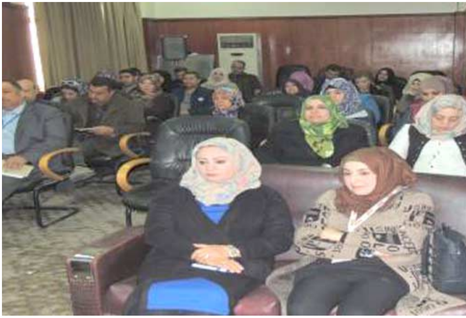
هيئة رعاية الطفولة خلال ندوة علمية

وتقديم الخدمات لهم وتسهيل إجراءات معاملاتهم واستقبال شكاواهم واستفساراتهم بشكل لائق بما يحفظ كرامتهم حسب توجيهات الوزير محمد شياع السوداني.