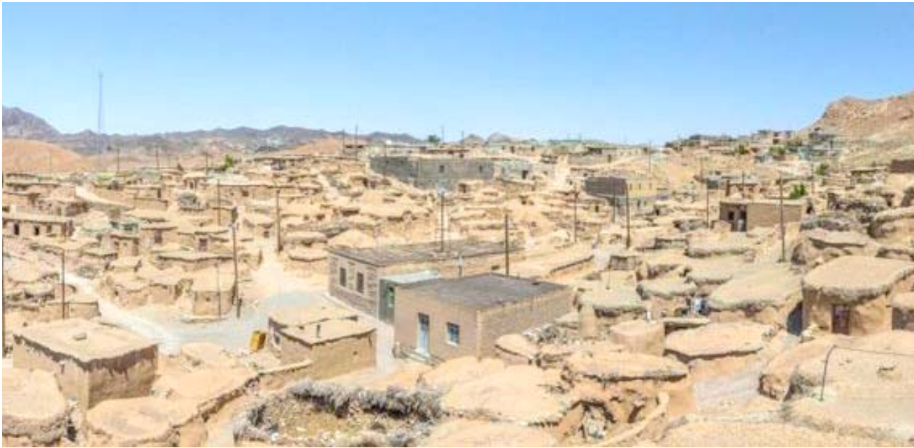
قرية إيرانية على اطراف الحدود الشرقية

توصيفاً ملائم بالنظر إلى أنني كنت مُجبراً على الجلوس بسبب السقف المنخفض للمكان، وينقسم هذا المكان، الذي تتراوح مساحته تقريبا ما بين 10 و14 متراً مربعاً، إلى جزء لتخزين القمح والحنطة يطلق عليه اسم 'كانديك'. بجانب مساحة مُخصصة لموقدٍ ليطهي مبني من الطوب اللبن يُعرف باسم 'كارشاك'. فضلاً عن مهجع للنوم.