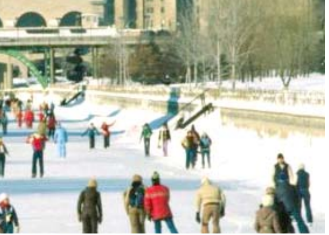
رفاهية: مواطنون يعيشون برفاهية ويمضون وقتهم في أحد المنتجعات السياحية

يقول آدم غولستون، كاتب السير الذاتية لأشخاص من ثقافات متعددة، والذي يعيش في فوكوياما لكنه أصلاً من الولايات المتحدة: 'تظهر آثار السياسات الحكومية في مجال النظافة والفعالية في الأداء، والجانب العملي في الجوانب التي يدفع المواطنون الضرائب في مقابلها'.