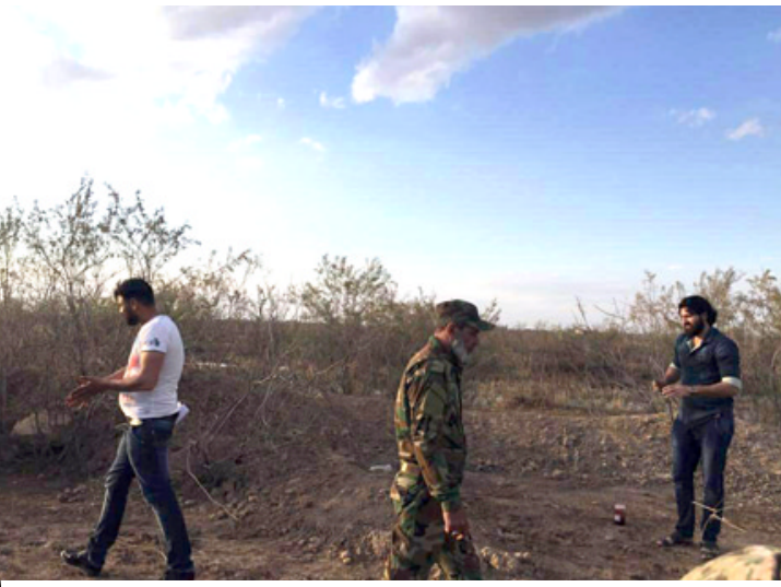
فيلم قصير : مشاهد من تصوير فيلم (الرمق الأخير) (الزمان)