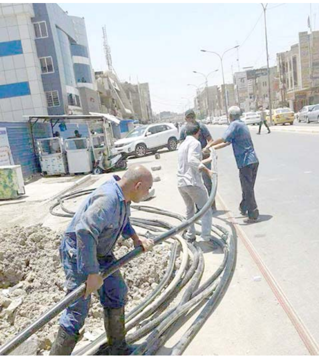
تجاوزات عمال الاتصالات يرفعون التجاوزات عن الكابل الضوئي

بغداد - شيماء عادل قامت لجنة إزالة التجاوزات المشكّلة في الشركة العامة للاتصالات بالتعاون مع قسم شؤون المواطنين في وزارة الاتصالات بحملة متابعة ورصد حالات التجاوز ورفقة الفرق الهندسية والفنية في مديرية إحصاء الكرخ بإجراء الكشف الميداني على البنى التحتية للاتصالات وشبكة الكابل الضوئي للحد من الأعمال التي تضر بالشبكة وتسبب حدوث انقطاعات وسرقات لسعات الإنترنت. رفقة جغرافية