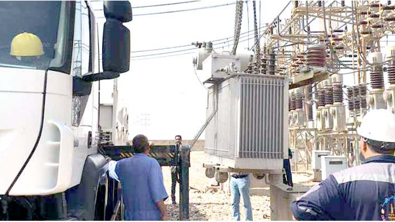
صيانة ملاكات الكهرباء تقوم بصيانة المحولات الثانوية، محطات الكهرباء

ان هذا المشروع ليس فيه احفاف بحق المواطن الفقير لكونه لا يمتلك عدداً كبيراً من اجهزة التبريد في بيته وبالتالي فإن الغني الذي يمتلك هذه الاجهزة هو الذي يدفع مبالغ هذا الصرف الكبير من الكافة الكهربائية). موضحاً انه ( في هذه الحالة ولكي تضمن اسعار قليلة لقائمة الجباية الشهرية يجب التبريد والتدفئة ويسرع اقل من مولدة الشارع وستكون الاجور قليلة بالمقارنة مع اجور الاشتراك بالمولدات الاهلية).