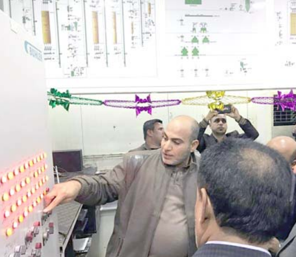
افتتاح جوانب من افتتاح منظومة السيطرة الإلكترونية في مطحنة بابل