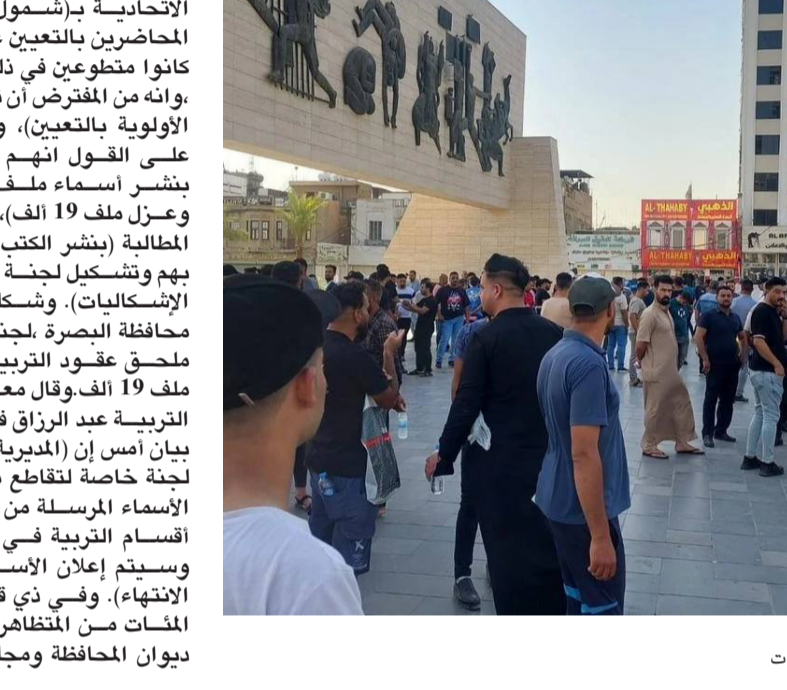
تظاهرات : محتجون في بغداد وذي قار يطالبون بفرص عمل وتوفير الخدمات