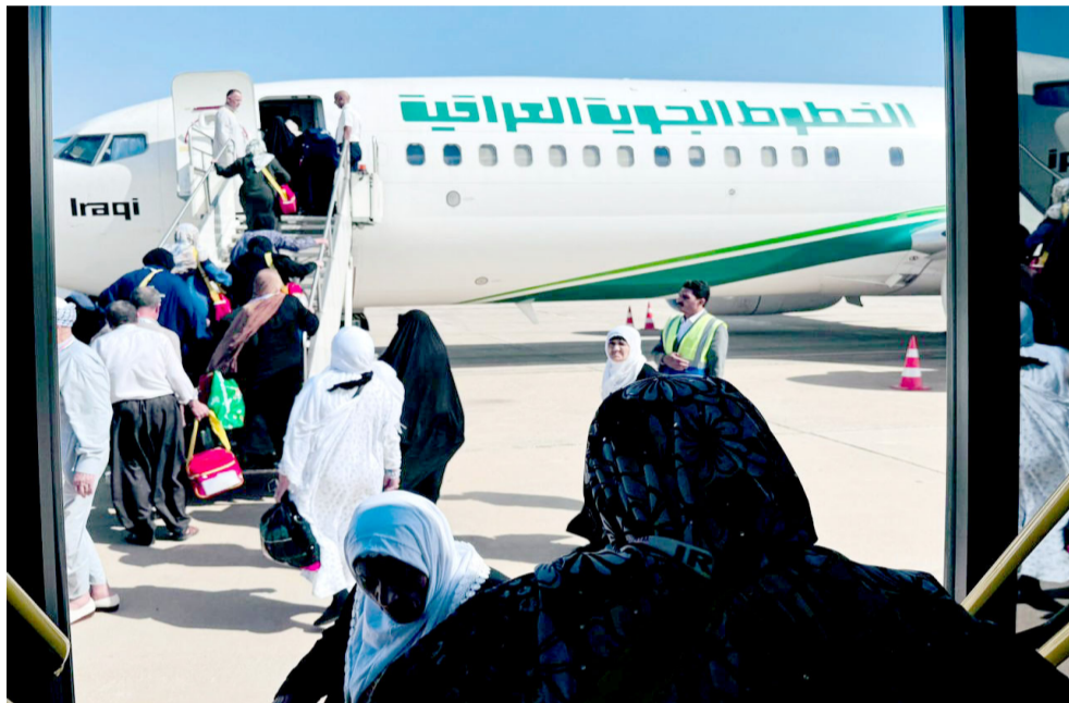
مراسم: حجاج عراقيون يعودون الى أرض الوطن بعد أداء المراسم

بغداد - ابتهاج العربي فوجت الخطوط الجوية العراقية، أكثر من 83 ألف مسافر خلال عيد الأضحى، وذكر بيان تلقته (الزمان) ان (إجمالي عدد المسافرين الذين تنقلوا على متن أسطول الخطوط الجوية، خلال أيام عيد الأضحى، بلغ 83,688 مسافراً، توزعوا بين 479 رحلة مباشرة الى مختلف القطاعات الداخلية والخارجية)، ومشيراً الى (نجاح خطة النقل الخاصة بموسم العيد للعام الجاري، وتأمين جميع متطلبات السفر المميزة للمسافرين)، وأوضح مدير عام الشركة، مناف عبد الموضع ان (جميع الرحلات نفذت بنجاح، فضلاً عن تفويج الشركة في تونج وتأمين خدماتها، ما يعكس على زيادة الطلب للمسافر على متن الناقل الوطني)، وأعدت الخطوط الجوية، الطائرة اي 220 من الخدمة، بعد توقفها لأكثر من عام. وقال بيان اس ان (الشركة أعادت الطائرة من طراز اي 220 الى العمل، ضمن أسطول النقل الجوي، حسب توجيهات الوزارة بتعزيز رحلات الطائر الأخضر، استناداً الى توجيهات وزير النقل رزاق محيبيس السعداوي، مبيناً ان (خطة الوزارة تنفذ وفق الجداول الزمنية لإعادة الطائرات الجائفة الى الخدمة)، وأضاف ان (عملية الصيانة لحركات الطائرة نفذت بالتعاون مع الشركة المصنعة الأمريكية)، لافتاً الى (عودة عشر طائرات من طرازات مختلفة الى الخدمة)، وأكدت الخطوط الجوية (استمرار العمل لإعادة خمس طائرات أخرى للعمل، قبل نهاية العام الجاري)، وتوقفت السعداوي، خلال جولة ميدانية، في مقر الشركة، الزمنية لإعادة الطائرات الجائفة الى الخدمة)، من جانبه أوضح مدير عام الخطوط الجوية، مناف عبد الموضع ان (عملية الصيانة لحركات الطائرة نفذت بالتعاون مع الشركة المصنعة الأمريكية)، مشيراً الى (عودة عشر