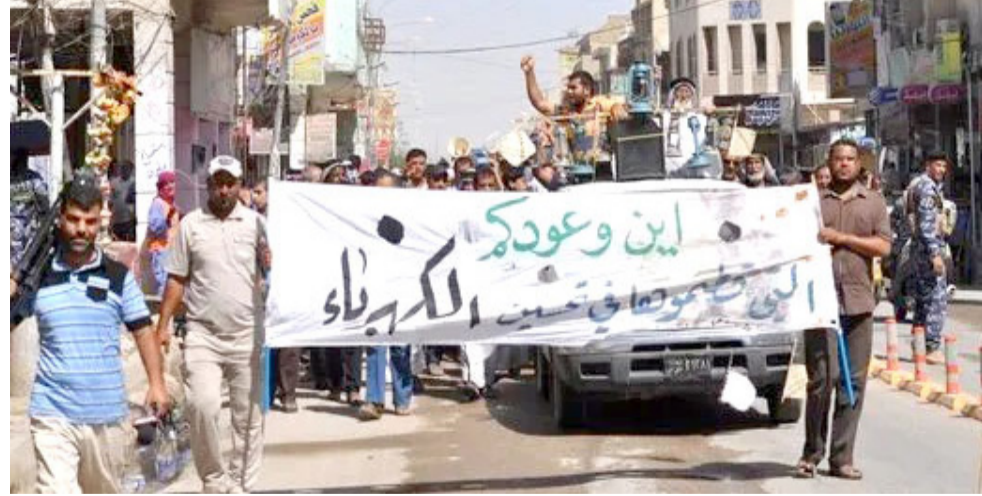
تظاهرات: مواطنون يخرجون بتظاهرات احتجاجية بسبب نقص الخدمات في المحافظات

الحافظات -مراسلو الزمان) شهدت محافظات ذي قار والمنفي والبصرة وبابل، تظاهرات غاضبة احتج فيها المواطنين على شح المياه وتراجع ساعات تجهيز الطاقة الكهربائية. وجدد منظاهرو محافظة ذي قار في بيان اس (تأكيد استمرار اعتصامهم المفتوح على نقص الخدمات، ورفض توجيه وزير الكهرباء زياد علي فاضل بوضع حلول ومعالجات غير محددة)، مؤكدا انهم (مستمرون بنصص سراق الا اعتصام حتى تحقيق مطالبهم في تحسين نوعية الكهرباء وان خطواتهم التصاعدية سنستمر داخل مدينة الناصرية، فضلا لسباسة التهميش التي تعرض لها المحافظة في قطاع الكهرباء). وأشاروا الى انهم (سن يقبلوا بمنح مركز المحافظة زيادة طفيفة في الكهرباء وقطعها عن الاضوية والنواحي لإرضاء المتظاهرين ومحاولة إنهاء الاعتصام، الامر الذي سيكون له تصعيد مقابل عدم التعاطي مع جميع المطالب). وكانت ذي قار، قد أعلنت تسلمها