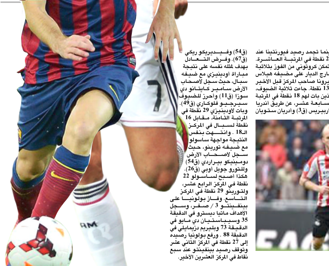
جانب من منافسات الدوري الهولندي لكرة القدم

من - وكالات: عزز أينهوفن موسمه في صدارة الدوري الهولندي لكرة القدم، بعدما اقتنص فيرونا قاتلاً 1 / 2 من مضيفة هيراكليس أول اسن الأند في المرحلة التاسعة عشر للجولة. وأسفرت باقي المباريات التي جرت بالمركز ذاته عن فوز أياكس على ضيفه فينورد 2 / صفر، وإكسلسير على مضيفة سبارتا روتردام 3 / 2، فيما تعادل جرونينجن مع مضيفة فيليم بهدف لثله، وارتفع رصيد أينهوفن إلى 49 نقطة في الصدارة، فيما توقف رصيد هيراكليس عند 22 نقطة في المركز الثاني عشر. بار ستيفن بيرجوجون بالتسجيل لمصلحة أينهوفن في الدقيقة 45، فيما تعادل جيف هارديفلد في الدقيقة 66 من ركلة جزاء. وبينما كانت المباراة في طريقها للتعادل، أحرز لوك دي بونج هدف الفوز القاتل لأينهوفن في الدقيقة 90. من ملعب الأوبليكو، جاءت أهداف الفريق العصامي عبر لويس فيريرتو (23) وسيرجي ميلينكوفيتش سافيتش (31) و(62) وكيسانجا بارتولومو جاسينتو (83) ولويس ناني