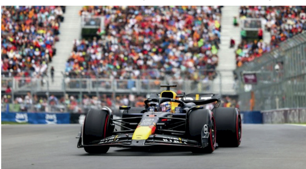
جائزة: يامل فيرستابن في تحسين مستوى سيارته ريد بول في جائزة كندا الكبرى

□ مونزينغال - أ.ف.ب: طالب السائق الهولندي ماكس فيرستابن، بطل العالم للفورمولا واحد في الاعوام الثلاثة الماضية، فريقه ريد بول بعمل أكثر دقة وسيارة أسرع بعد انتهاء التجارب