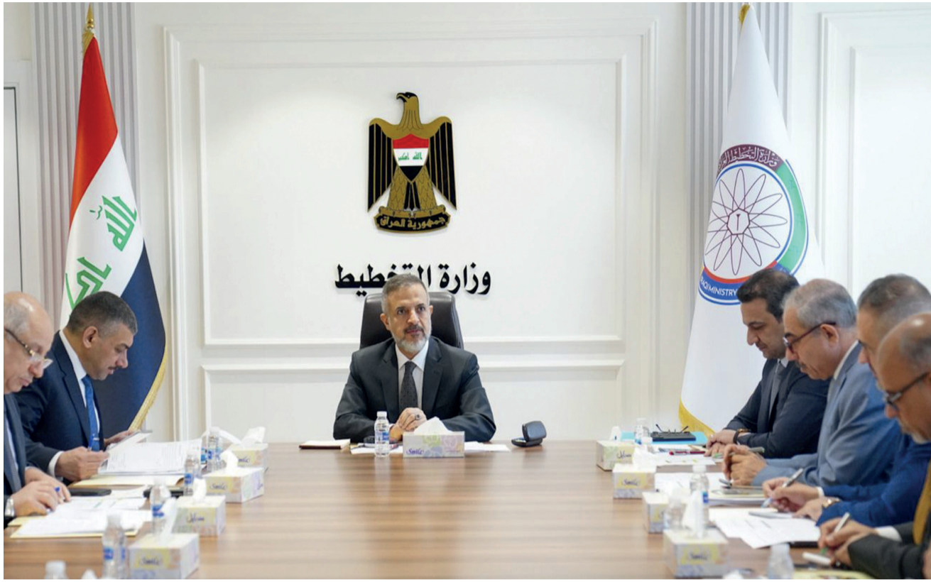
قناع : وزير التخطيط برأس الاجتماع الثاني للجنة المكلفة بدراسة اقتصاديات قطاع النفط والغاز

الشركة، أنجزت حفر البئر النفطي زت بى 550، بعمق 2419 متراً، ضمن العقد المبرم مع شركة إي إن أي الإيطالية، لعمق 37 بئراً نفطياً في حقل الزبير النفطي في محافظة البصرة)، ولقت السى ان (انجاز