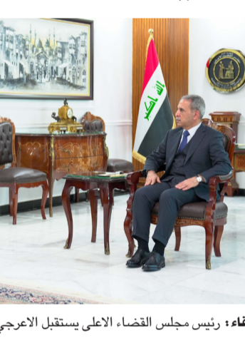
لقاء رئيس مجلس القضاء الأعلى يستقبل الأعرجي في مكتبه

مجاناً، وكذلك أغلب التحاليل متوفرة بشكل مجاني في العيادة الاستشارية ولكن في بعض الأوقات وبسبب الزخم العالي وكثرة المراجعين يحدث هناك قلة وشح في البعض القليل من التحاليل وهي جزء بسيط جداً حيث يقوم الطبيب بالمعالج بأحالة المريض الحرج إلى مختبر الطوارئ لعمل التحاليل الكرخ وللمستشفى الكرامة التعليمي إلى مختبر الجناح الخاص لعمل التحاليل الغير متوفرة فقط علماً أن أسعار التحاليل في مختبر