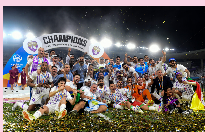
نادي العين بدوري أبطال اسيا

جديداً مليئاً بالإثارة من أجل مستقبل أفضل وأكثر إشراقاً للعبة على صعيد الأندية في قارة اسيا). ويقولون ان ، انتهى سباق التاهل الاسيوي إلى بطولة كأس العالم للأندية 2025، التي تضم 32 فريقا، والتي ستقام في الولايات المتحدة في خلال شهري حزيران/يونيو وتموز/يوليو من العام القادم. وانضم الفريق الإماراتي إلى الهلال السعودي وأوراوا ريد دايمونذر الياباني الذين تاهلا كأفضلين بدوري أبطال اسيا في عامي 2021 و2022 على التوالي، إلى جانب نادي أوهسان هيونداي من جمهورية كوريا الذي حجز مكانه من خلال التصنيف.