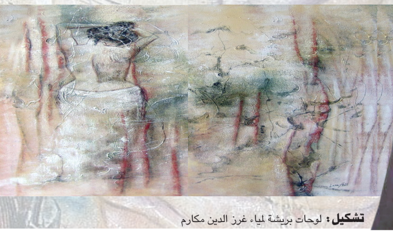
تشكيل : لوحات بريشة ليا غرزددين مكارم