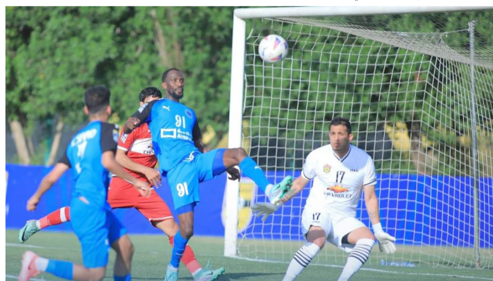
فوز: فريق الطلبة يحقق الفوز على الحدود في دوري المحترفين

تعاليل نوروز وميسان وعاد نطف ميسان بالتعامل الثاني ذهابا قبلها من ملعب كربلاء بنفس