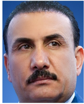
بغداد - ندى شوكت زار وزير التربية ابراهيم نامس الجبوري، عددا من المراكز الإمتحانية، للاطلاع على آلية حفظ الأسئلة وجدول الإختبارات اليومية، فيما أكد التنسيق مع وزارة الكهرباء لضمان استمرارية الخدمة خلال الإمتحانات. وقال بيان تلقته (الزمان) أمس ان (الجبوري أجرى زيارة تفقدية للمديريات العامة للتربية في جاني الكرخ والرصافة، بوجهه ببذل أقصى الجهود لتأمين العملية الإمتحانية بالكامل والحفاظ على مجهود الطلبة الدراسي)، وأضاف ان (الجبوري أشرف أيضا على آلية حفظ الأسئلة الإمتحانية الخاصة بالقبول والالتحاق بالمدارس الكفائية والطنية والدوام الغنائي والثلاثي، من خلال استثمار الإهتمام الحكومي بالقطاع التربوي للوصول الى نتائج مرضية تحقق من خلالها الإستدامة البيئية التربوية المنشودة)، وأسندت وزارة الكهرباء زياد علي فاضل، المراكز الإمتحانية من القطع المبرمج، وقال المتحدث باسم الوزارة احمد موسى في بيان تلقته باستثناء المراكز الإمتحانية كافة من القطع البرنامج وحرف الأحصا لصالحها، بغية إنجاح العملية الإمتحانية والتربية، وعلى مستوى جميع المحافظات وعلى ان تتولى مراكز السيطرة في شركات التوزيع تأمين ذلك، مؤكدا انه (جرى التوجيه بالتنسيق مع وزارتي التربية والتعليم العالي، لإدانة العمل المشترك وتحديد مواقع المراكز الإمتحانية في بغداد والمحافظات)، ولا تفرق الصيانة التابعة لشركات العامة للتوزيع متابعة شبكات التوزيع الفرعية ضمن الإحياء السكنية، للتأكد من اهليتها وكفاءة طائرها، ولا تزال هذه الفرق متواصلة ومستنفرة في عملها لمواكبة أي حالة مستجدة على الشبكة الكهربائية).