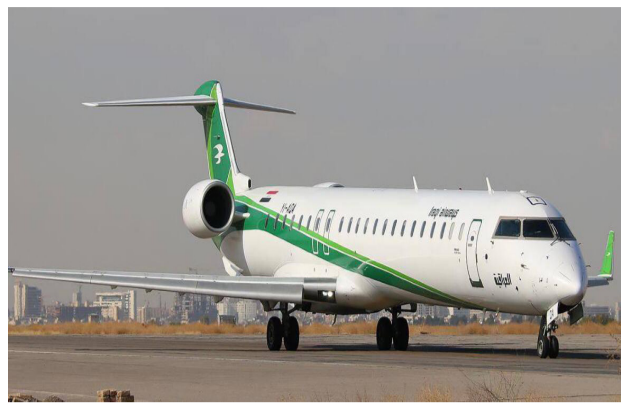
طيران: طائرة سي آر جي تعود للخدمة