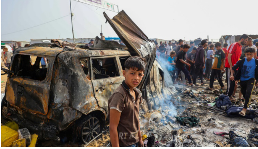
قصف : فلسطينيون في موقع مركز النازحين في رفح الذي تعرض للقصف الإسرائيلي البشعة، هو تحد لجميع قرارات الشرعية الدولية، متهمه القوات الإسرائيلية