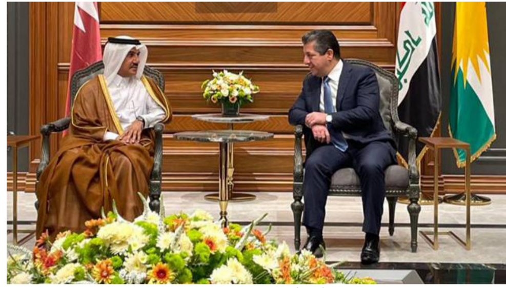
استقبال: رئيس حكومة الاقليم يستقبل مسؤولاً قطرياً

أربيل - فريد حسن أكد رئيس اقليم كردستان نجديفران البارزاني، أن العراق والاقليم لديهما الكثير من الشراكات التي تربطهما مع دولة قطر. وقال بيان لثقته (الزمان) امس ان (البارزاني استقبل في مكتبه امين عام وزارة