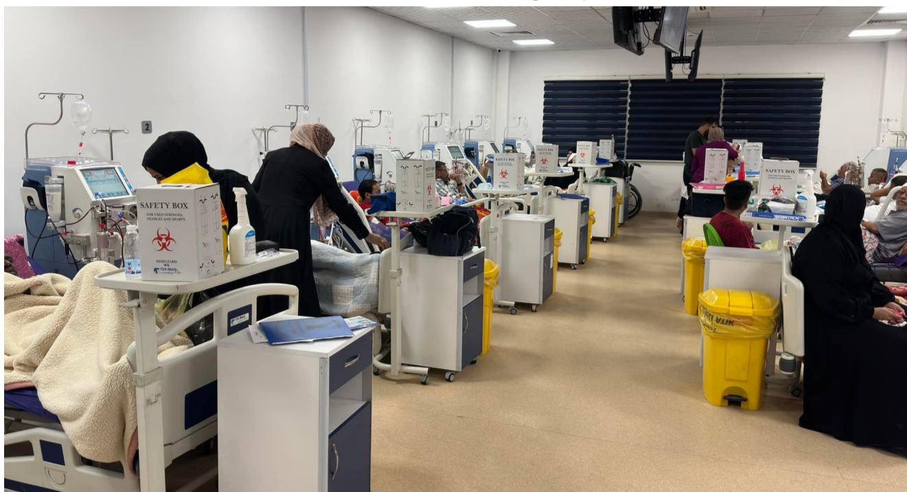
ردهة إحدى ردهات مستشفى الكرامة تجم المرضى والمرضى