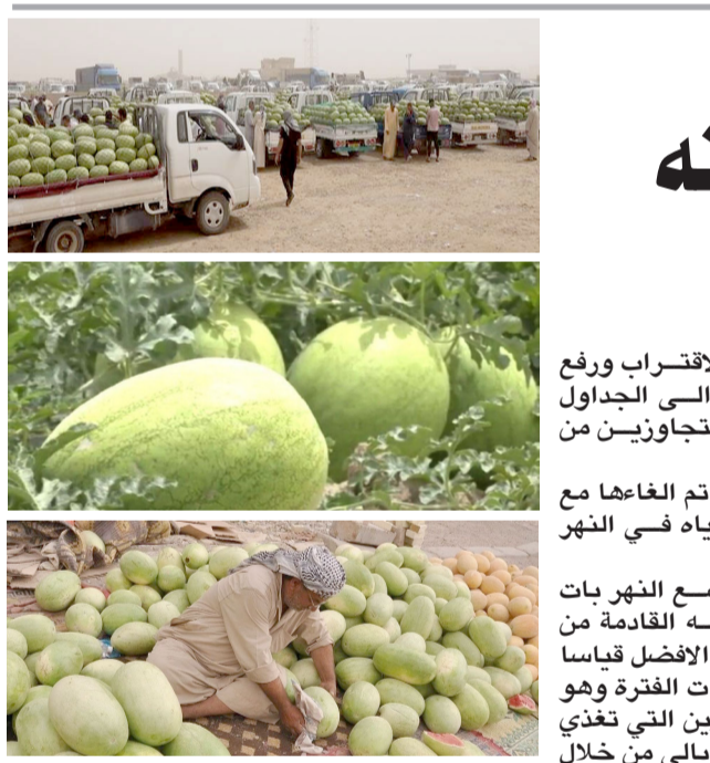
تسويق: رقي العظيم جاهز للتسويق

الخارجية القطرية احمد بن حسن الحمادي وجرى خلال اللقاء الذي حضره سفير دولة قطر في العراق والقنصل العام القطري لدى أربيل، بحث تعزيز علاقات قطر مع العراق والاقليم ، كما تبادلوا الآراء وجهات النظر بشأن الفرص