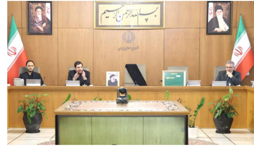
جلسة: النائب الأول للرئيس الإيراني يتحدث خلال مجلس الوزراء الحكومي في طهران

الإيرانية وأسر الأجزاء في هذه الحادثة المؤلمة التي تسببت برحيل رئيس الجمهورية وإمام جمعة تبريز محمد علي ال هاشم وزير الخارجية ورفاقهم). ودعا الأمين العام لعصائب اهل الحق قيس الخزعلي، المولى عز وجل ان يتعمد الرئيس الإيراني ورفاقه بواسع رحمته. وقال في بيان امس (باصدق آيات التعازي والمواساة، نتقدم التي كل الأحرار في العالم، بفاجعة استشهاده رئيسي والكوكبة المؤمنة التي رافقته في حادث مؤلم جليل). من جهته، قدم حزب الدعوة الإسلامية، التعازي بوفاة الرئيس الإيراني. وقال المكتب السياسي للحزب (تعرب عن عميق المواساة، واصدق مشاعر الأسى بوفاة رئيسي وعدد من الشخصيات الرسمية