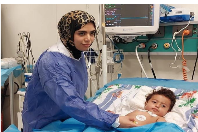
مستشفى: طفلة ترعى ابنتها في المستشفى