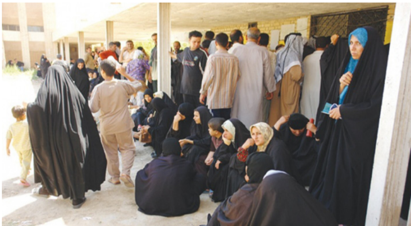
رعاية: نساء ينتظرن الحصول على راتب الحماية الاجتماعية