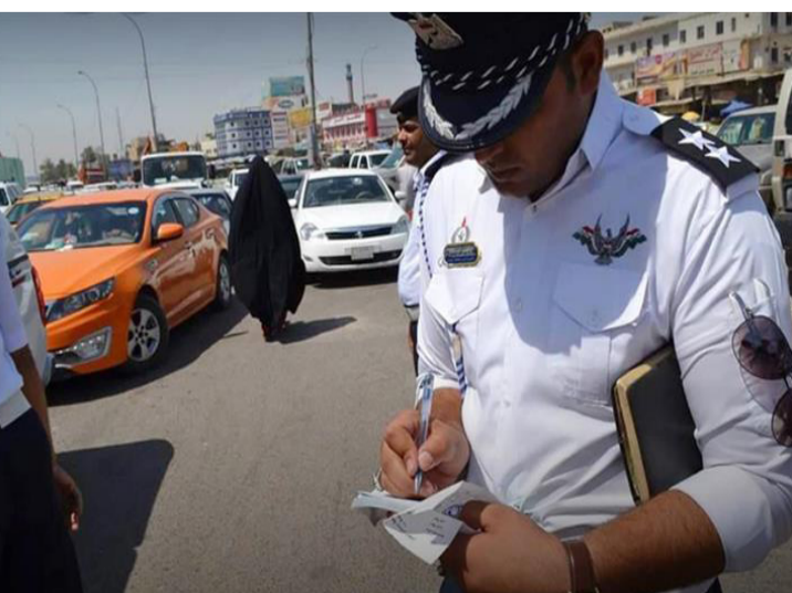
غرامة: ضابط مرور يسجل غرامة بحق مركبة

إنجازات في ملف القضاء على الجريمة الجنائية والإرهابية)، مبيّنا ان (الوزارة قدمت الكثير من الخدمات أبرزها الجواز الإلكتروني، والفيزا الرقمية، كما وقعت مذكرات تفاهم مع سوريا في مجال المخدرات والحدود، والاتجار بالبشر وتبادل الخبرات التدريبية، الى جانب اتفاقية أخرى مع تونس في مجال الجريمة)، وتابع ميري ان (الوزير افتتح مصنع للألبسة العسكرية، وهو نقلة نوعية ينتج في اليوم الواحد 5 الاف و 750 ألف بدلة في العام الواحد، وذلك يعزز الموارد المالية لأسر الشهداء الكادحين في المعمل، بحسب قوله، لافتا الى (قرب افتتاح مركز البيانات والمعلومات، وطبع اللوحات المرورية التي تعاقدها عليها صندوق شهداء الشرطة، والمركز الوطني لطباعة البطاقة الوطنية، فضلا عن تدشين ثلاث مؤسسات مهمة خلال المدة المقبلة، وهي مركز المعلومات، طبع اللوحات، ومعمل طبع البطاقة الوطنية). وفي الإنبار، اوضحت مديرية مرور المحافظة، خريطة طريقين برين بالمدينة ضمن طريق الحج البري، مؤكدة الحد من الحوادث المرورية على طريق هيت البغدادي بكاملة.