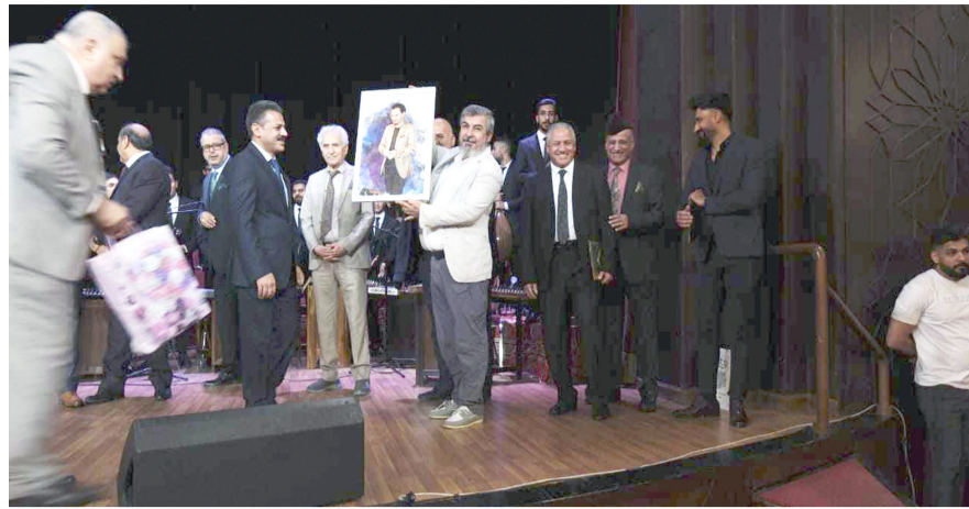
تخرج: لقطات من حفل تخرج طلبة معهد الدراسات الموسيقية عسة: زكّار البرزنجي