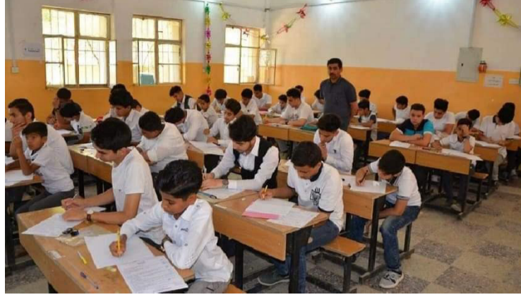
امتحان: تلاميذ السادس الابتدائي يؤدون امتحان البكالوريا

والعلوم، وكذلك اللغة التركمانية للدراسة التركمانية والاحادية، على صعيد متصل، دعت لجنة التربية النيابية، الى إيقاف المدرسة الالكترونية وعدم العمل بها. وقال بيان تلقته (الزمن) امس ان (العمل في هذا المشروع يتعارض مع مجانية التربية والتعليم في العراق، لذا نوصي بإيقاف العمل بالمدرسة الالكترونية). واعتمد العراق على التعليم الالكتروني في المدارس والجامعات والمعاهد بعد ظهور فيروس كورونا الإصابات والوفيات المواطنين، مما أدى الى فرض حظر