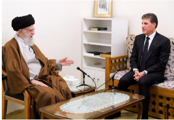
أربيل - فريد حسن طهران - رزاق نامقي

عبد رئيس إقليم كردستان نيجيرفان البارزاني، الذي أربيل بعد جولة مباحثات وصفها بالنجاح، أجراها في العاصمة الإيرانية طهران بشأن التعاون ودعم جهود الاستقرار والهدنة في المنطقة. وقال بيان تلقته (الزمان) أمس أن (البارزاني عاد إلى أربيل بعد اختتام زيارته إلى إيران، التي التقى خلالها المرشد الإيراني علي الخامني ورئيسي الجمهورية إبراهيم رئيسي ومجلس الشورى وزير الخارجية والأمن العام للمجلس الأعلى للأمن الوطني الإيراني والقائد العام للحرس الثوري حسين سلامي، وأشار إلى البيان أن (البارزاني وسلامي) شدد على أهمية مواصلة التنسيق بين الجهات المعنية لحفظ الأمن والاستقرار وضبط الحدود، وأضاف أن (البارزاني ناقشا تأثير وعواقب الصراع في الشرق الأوسط على الوضع في المنطقة، ويجب على الجميع العمل للحفاظ على الاستقرار ومنع المزيد من تصعيد التوترات، وتطرق الجانبان إلى التعاون الأمني والعسكري بين أربيل وبغداد ومكافحة خطر الإرهاب وغيرها من القضايا ذات الاهتمام المشترك)، وأعرب البارزاني خلال مؤتمر صحفي عن (شكره لدور رئيس الوزراء الاتحادي محمد شياع السوداني، الذي كان في الحقيقة متعاوناً وأجرينا خصوصاً العديد من الاجتماعات المطولة بشكل سري ليكون لدينا هذه اللقاءات في طهران، وأضاف أن (البارزاني) وافق على أنه (اتفق مع المسؤولين الإيرانيين على حل المشاكل بالحوار). ووصل البارزاني إلى العاصمة الإيرانية طهران الأحد الماضي، في زيارة رسمية استمرت يومين، وعلق القضاء مؤقتاً