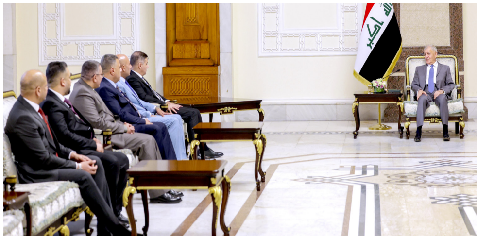
استقبال: رئيس الجمهورية خلال استقباله وفد نقابة الأطباء العراقيين

مينا لسكوفار خلال عمله في البلاد). كما نقل شكر الفاتيكان لرشيد على الاهتمام بشؤون المسيحيين وحرصه على متابعة أوضاعهم والعمل على تذليل العقبات التي تواجههم.