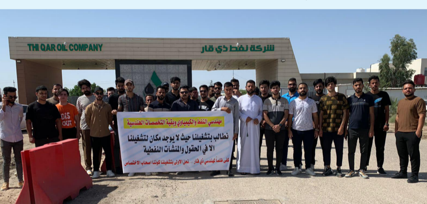
احتجاج: خريجو محافظة ذي قار في وقفة احتجاجية

في الشهر، إلا انه ما زال حبر على ورق)، على حد تعبيرهم. وطالبت لجنة التربية الثنائية ، رئيس الوزراء محمد شياع السوداني، بالإيعاز الى المحافظين بإطلاق تعيينات الـ 150 ألف والدرجات الوظيفية في جميع المحافظات ابتداء من الشهر الجاري. واطلعت من الأهم والقيمة صادرة من لجنة التربية الثنائية ، جاء فيها انه (في الوقت الذي تشهد فيه علكمك اللا محدود واهتمامكم الكبير في بناء بلدنا وعلى جميع الأصعدة وبناء على المناشدات الكثيرة الواردة اليانا من قبل انبائنا الخريجين ومن جميع المحافظات واستناداً الى قانون الموازنة الثنائية، التي نصت على استحداث 150