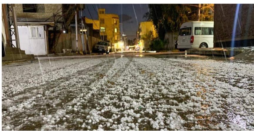
حالبوب: جبات البرد (الحالبوب) تغطي أحد شوارع بغداد

رجح متنبئء جوي، تأثر اجواء العراق بمنخفض بارد مصحوب بموجة امطار متوسطة الى غزيرة ابتداء من اليوم الاثنين. وقال المتنبئء رياض القرشي في تصريح امس ان (منخفضاً جويًا بارداً سيجتاح اجواء العراق ابتداء من اليوم الاثنين مصحوب بموجة امطار تكون غزيرة على بادية النجف والقادسية وواسط وميسان ذي قار والبصرة والسليمانية واربييل ودھوك)، وأشار الى انه (مع ساعات الفجر ليوم الثلاثاء ستحتم من الموصل وكركوك وبغداد وواسط، أكثر المحافظات تأثراً بهذا المنخفض، ولاسيما اقسامها الحدودية الشرقية، مع رياح جنوبية شرقية نشطة مثيرة للغبار في ميسان). من جانبها، توقعت