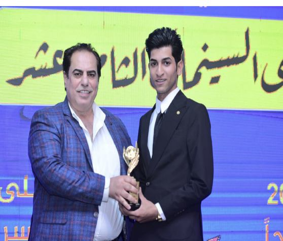
ملتقى: لقطات من الملتقى السينمائي الثامن عشر ومسرحية (ليلة القتل)