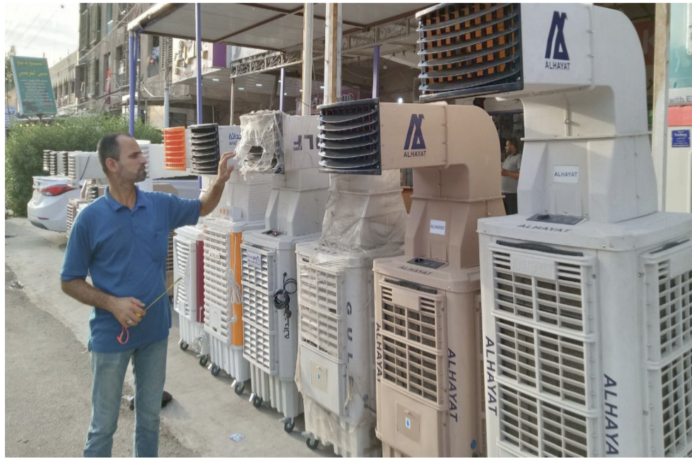
اجهزة: محال بيع اجهزة التبريد تشهد اقبالاً في الصيف

بعد وهناك ما زالت بعض الاجزاء توصف بالرديئة لكن الاهالي اضربوا لشراء المبردات من اجل الاستعداد ومواجهة ضييف ساخن سيهيج على المدينة بعد ايام قليلة .