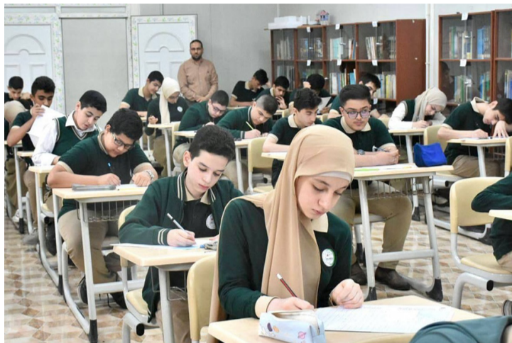
بغداد - ساري تحسين

ادى نحو 290 طالبا موهوباً امس، امتحانات الدور الاول النهائية للعام الدراسي الجاري، تحت إشراف وزاري. وقال بيان لوزارة التربية تلقته (الزمان) امس ان (290) طالباً توجهوا لاداء امتحاناتهم النهائية ضمن الدور الاول للعام الدراسي الجاري، تحت إشراف وزاري محكم وبانسيابية عالية، واضافت ان الامتحانات انطلقت بعد تجهز الوزارة المستلزمات اللوجستية اللازمة لإنجاح العملية الامتحانية في عموم المحافظات، وسط امنيات التوفيق والسداد وحصد ثمره عام من الجد والمثابرة. كما اصدرت الوزارة، توجيهات خاصة بالعام الدراسي المقبل. وأشار البيان الى انه (تزامناً مع قرب الامتحانات) على التحضير الجيد للمستلزمات والاستعداد الامثل للعام الدراسي المقبل، اطلاق الوزير