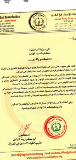
كتاب شكر نقابة الأطباء، سطو مسلح على المنزل، الذي ارتكبته مجموعة من المقاتلين، وهو أجنيبي الجنسية والقبط عليه، حيث اعترف بعد مواجهته بالدلائل التي قدمتها المواطنة، تهديها من اجل الحصول على مطالب لا أخلاقية مقابل عدم نشر صورها على مواقع التواصل).

في التحقيق والتحري وعن الجريمة والقاء القبض على الجناة خلال الساعات الماضية). واضاف ان (حرصكم وجهودكم ألججت الصور والبيانات التي تمسول له نفسه ان يقدم على ارتكاب فعل إجرامي، وشدد على القول (أامل سرعة اكتمال التحقيقات وتقديم الجرم الى العدالة لينال عقابته). وكانت الداخلية قد أعلنت القبض على قاتل الطبيب المتقاعد في النجف، وأشار بيان الى انه (بجهد استخباري متميز ومن خلال المتابعة الميدانية، التقت قوة مشتركة من خلية الصقور ومكافحة الجرام في الرواي (جهود الشمري) النجف، والقبط على قاتل الطبيب المتقاعد، وكانت القوات الأمنية قد عثرت على جثة الحويزي في منزله بالنجف، بعد منتصف ليل الخميس الماضي، بعد عملية