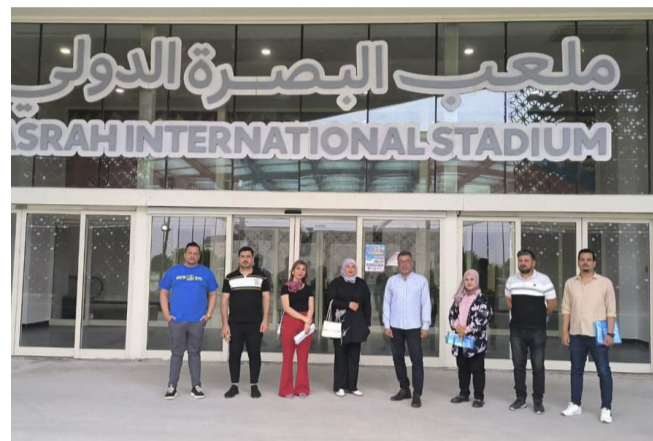
متابعة: لجنة متابعة جوة ملعب البصرة الدولي وفق المواصفات العالمية

بغداد- الزمان وأشارت حميد إلى أن ( القسم الرياضي المرحلة الأولى من موكدة أن تطبيق معايير ومتطلبات الجودة القياسية، طبقا للمواصفات الدولية في جميع الملاعب وإداراتها ومراكزها، ومواكبة التطورات العالمية في النظم الإدارية ومنهجيتها، للوصول إلى مستوى عالمي مضمون).