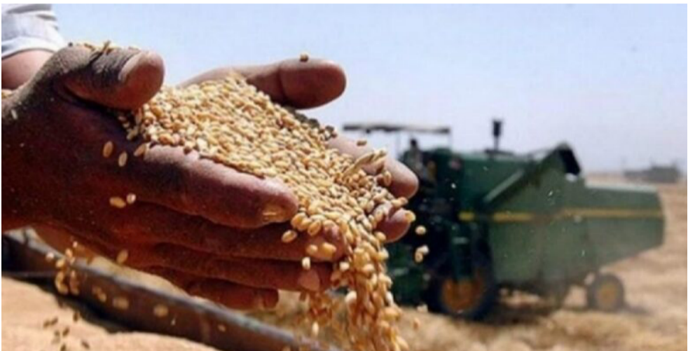
عرض، فلا يعرض كميات مختارة من الحنطة