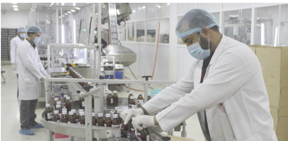
انتاج، مصنع الادوية في سامراء، ينتج ادوية جديدة

محتاجات الفولانيه، التابعة الى الصناعة والمعادن، 50 طن من الكرات الفولانية الطاحنة، وبقاظر مختلفة، وقال بيان امس ان (ملاكمات مصنع مسبل الصلب الخاص، التابع الى الشركة، انهدت تجهيز معمل سمك الكوفة بكرات فولانية طاحنة مختلفة الاحجام وفق العقد