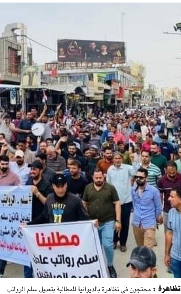
تظاهرة : محتجون في تظاهرة بالديوانية للمطالبة بتعديل سلم الرواتب

بغداد والبصرة والديوانية والنجف وكربلاء، تظاهرات للمطالبة باقرار تعديل مشروع قانون سلم الرواتب. ففي بغداد، تجمع المتظاهرون في ساحة التحرير لدعوة الحكومة الى الاستجابة لمطالبهم واقرار سلم الرواتب الجديد، بينما تجمع آخرون قرب مصفى الشعبية بالبصرة للمطالب ذاتها. وفي كربلاء، طالب موظفي الدوائر الخدمية باضافة مخصصات الخطورة اسوة باقرانهم من موظفي الوزارات، وقالوا لمراسل (الزمان) امس ان