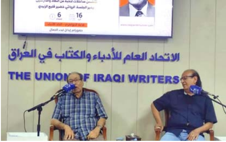
محطات : مسيرة غائب طعمة فرمان الثقافية غنية بالمحطات الإبداعية