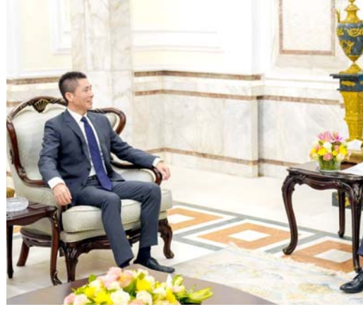
لقاء: رئيس الجمهورية يلتقي السفير الصيني في بغداد

بغداد - ابتهاج العربي ناقش رئيس الجمهورية عبد اللطيف جمال رشيد، مع السفير الصيني لدى العراق تسوي وي، فرص التعاون الاقتصادي والتجاري بين البلدين، وقال بيان تلقته (الزمان) أمس ان (رئيسه تلقى نظيره الصيني شي جين بينغ، في ما حمل السفير تحياته للقيادة الصينية وتمنياته للشعب بنوام التقديم والازدهار، كما هنا بحلول الذكرى الخامسة والسبعين للإمامة العلاقات الدبلوماسية بين البلدين)، وأشار رئيسه إلى (أن العراق مهتم بتوطيد أطر التعاون والتعاون)، مؤكداً (الحمية تعزيز العلاقات القائمة بين البلدين، ولاسيما الاقتصادية والتجارية، وفي