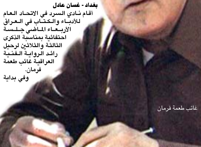
غائب طعمة فرمان

بغداد - غسان عادل أقام نادي السرد في الاتحاد العام للأدباء والكتاب في العراق الأربعمائة الحادي عشر جلسة احتفالية بمناسبة الذكرى الثالثة والثلاثين لرحيل رائد الرواية الفنية العراقية غائب طعمة فرمان. وفي بداية الجلسة التي أدارها القاص والروائي خضير فليح الزبيدي أثنى من خلالها على الأمانة العامة للاتحاد عقبها هذه الجلسة الخاصة بفرمان مشيراً إلى (الدور الكبير الذي لعبه فرمان ثقافياً وروائياً وعن غرامه بالبيئة البغدادية فضلاً عن وجود دراسة وحوار موسع مع فرمان لم ينشر سابقاً وسيتنشر قريباً) لفتاً إلى (مشاركة فرمان في إحدى أكبر المهرجانات الخاصة بالروائيين العالميين في بغداد). ثم تبعت ذلك جملة من المداخلات لنخبة من النقاد والدارسين افتتحتها الأديبة شجاع العائلي التي تحدثت عن تكرياته مع فرمان خلال لقائه به مرتين متتاليتين إلى (أنه أول من كتب مقالاً عن روايته الشهيرة "النخلة والجيران" بلحق جريدة