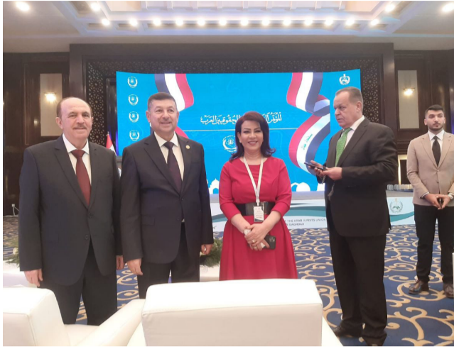
الكرمية وكافة المحامين. وفوض الاتحاد الامين العام على حفظ صدقنا الكبير والذي ترأس هيئة المحامين في الدفاع عن العقوليين السابقين وانتخابه العام 1965 بالبحرين تواسم له بالدخول لدى وصوله للمطار، والصحة والعافية لمرامنا واصدقنا النقيب عن الدين التعميم الدولة والبلديات عام 1959 في الوطن العربي وهي المناضلة المتكورة زنية وطلعتها البهية وقوة الشخصية

هذا الاجتماع على خمسة شخصيات من مؤسسي الاتحاد. وأقرت وفود الاتحاد، بغداد، بالوصف النبيلة والسجايا القومية الفريدة، خلال كلماتهم بالجلسة الافتتاحية لاجتماع بندق مريديان. إعادة مقر ورف أمين عام الاتحاد على الضمور، بشرى تلبية رغبة الجانب العراقي، في إعادة مقر الاتحاد من عمان الذي انتقل إليها بعد نيسان 2003 إلى بغداد لاجتياز مسيرته في المستقبل. وعقد حقوقيون عرب، قرار اتحادهم إعادة مقره الى بلد التناسيل، انجازاً لهيئة متوافقة مع الدور المحوري للعراق في الرحلة الراهنة. وبذلك يكون اتحاد الحقوقيين أول منظمة عراقية تفلح في تحقيق غاية غير مسبوقة من هذا النوع.