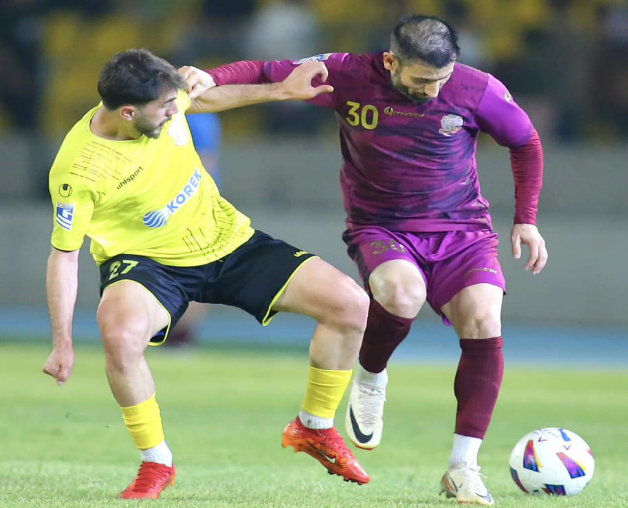
صدارة: فريق الشرطة يفوز على اربيل ويحافظ على صدارة الدوري

الناصرية- باسم الركابي ينطلق الزوراء رابع الترتيب لتجاوز عقبة نفط البصرة مباشرة للمركز الثالث بعد تاجيل لقاء زاخو 37 مع الجوية وقبلها ان الفريق تجاوز الأرقام السلبية والأخطاء التي اهدر بسببها العديد من النقاط لكنه تحول بسرعة وعاد الى قلب المنافسة وبات على قدر التحدي في مواجهة نظرائه والتحكم في الامور بعد ارتفاع القدرة الهجومية والتفكير في المدة القادمة ويريد التصرف كفريق جماهيري في مثل كل