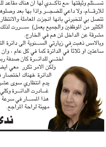
ندى شوكت بغداد

بغداد - الزمان جدد الحقوقيون العرب تفويضهم برئيس اتحادهم شبيب المالكي، بعد عقود من ضلته الامانة العامة للاتحاد، وتركه بصمة تاريخية على صفحات سجل المنظمة تاريخية على صفحات سجل مجلس حقوق الانسان في جنيف. واستكمل المكتب الدائم للاتحاد في بغداد اعماله الأحد الماضي باعادة انتخاب مفيد شهاب نائباً للرئيس، وقال مراقبون ان (دورة الاحداث المتعددة في بغداد كتعبئة اهمية بالغة لامينين الأول هو اجماع الاعضاء على اعادة مقر الاتحاد الى بغداد بعد نحو عقدين من نقله الى عمان، والثاني اطلاق اسم غزة الكرامة والمقاومة والعز على اجتماع الاتحاد في العاصمة العراقية).