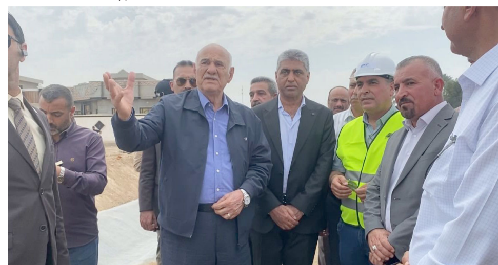
تفقد: وزير الموارد المائية يتفقد أحد المشاريع

وله دور كبير في تأمين الإطلاقات المائية ضمن خطة الإدارة المشتركة للخرزين المائي وتأمين الإطلاقات للمائية)، وواعز الوزير (باستمرار التنسيق المشترك مع الهيئة العامة للسدود والخزانات لتعزيز استمرار اعمال الصيانة والإدامة لمرافق السد ومنشآته). على صعيد متصل، تقيم وزارة الموارد المائية، المؤتمر الدولي الرابع للمياه، من السابع والعشرين حتى التاسع والعشرين من نيسان الجاري، مناقشة تحديات المياه. وبحسب البيان فإن (اعمال المؤتمر تطلق برعاية رئيس الوزراء، بمشاركة دولية وبدعم الامم المتحدة بدعم الأمم المتحدة التي حذرت من تبعات خطيرة على مستقبل البشرية مالم يكن هناك تعاون أكبر وحرص مزياد لتجنب مخاطر البيئة والجفاف والتصحر والنقص الحاد في مخزونات المياه والكميات الأمطار). ودعا رئيس المجلس الأعلى الإسلامي العراقي، هشام حصيد، في وقت سابق خلال اجتماعه مع وفد تركي، دول المنطقة للبورة رؤى جديدة لحل مشاكلها دون تدخل خارجي. مبادرات تعاون وتسد حمودي، على (ضرورة تعاون دول المنطقة في تجاوز مشاكلها الامنية والمرتبطة بتعاونها الاقتصادي، وعدم تركها عاقلة، وان تقدم مبادرات لبورة رؤى جديدة مشتركة لمستقبلها دون