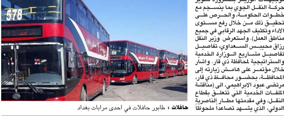
حافلات : طابور حافلات في إحدى مرائب بغداد