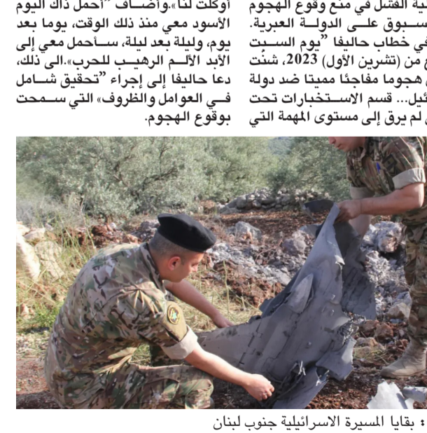
مسيرة : بقايا المسيرة الاسرائيلية جنوب لبنان