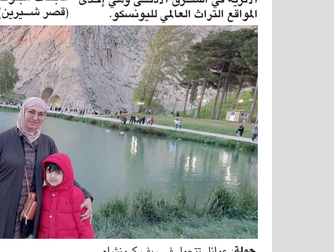
جولة: عوائل تتجول في ريف كرمينشاه