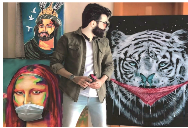
تشكيل: لوحات بريشة علي الموسوي