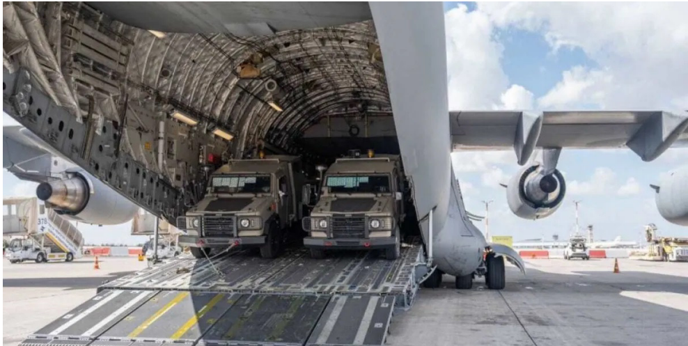
مساعدات: طائرة تفرغ حمولتها من المركبات المصفحة

استشهاد فلسطينيين برصاص قوات الإحتلال في الضفة الغربية