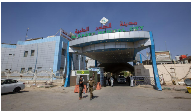
بوابة : مدخل مستشفى مدينة الصدر الطبية

بغداد، وتنفيذ القرارات الحكومية ومحاربة الفساد الارابي.