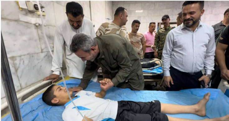
تفقد في الحشد الشعبي يتفقد جرحى انفجار بابل