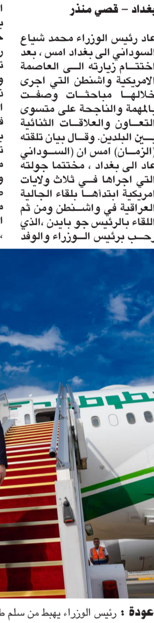
عودة: رئيس الوزراء يهبط من سلم طائرة في مطار بغداد بعد عودته من واشنطن

المرافق له، كما جدد تأكيد دعم بلاده غير المحدود للعراق، حيث أجرى الطرفان مباحثات رسمية نتج عنها مخرجات تضمن التعاون الأمني والاقتصادي. ضم التقي بعد ذلك عدد من رؤساء الشركات الأمريكية الراغبة بالاستثمار في العراق، إن نجح الوفد بتوقيع اتفاقيات في مجال تطوير حقول النفط والاستفادة من الغاز، وكذلك مساعدة وزارة الكهرباء في تأمين طاقة إضافية من خلال إنشاء محطات جديدة، ووجه رئيس الوزراء، قبيل مغادرته واشنطن، السفارة العراقية بمتابعة