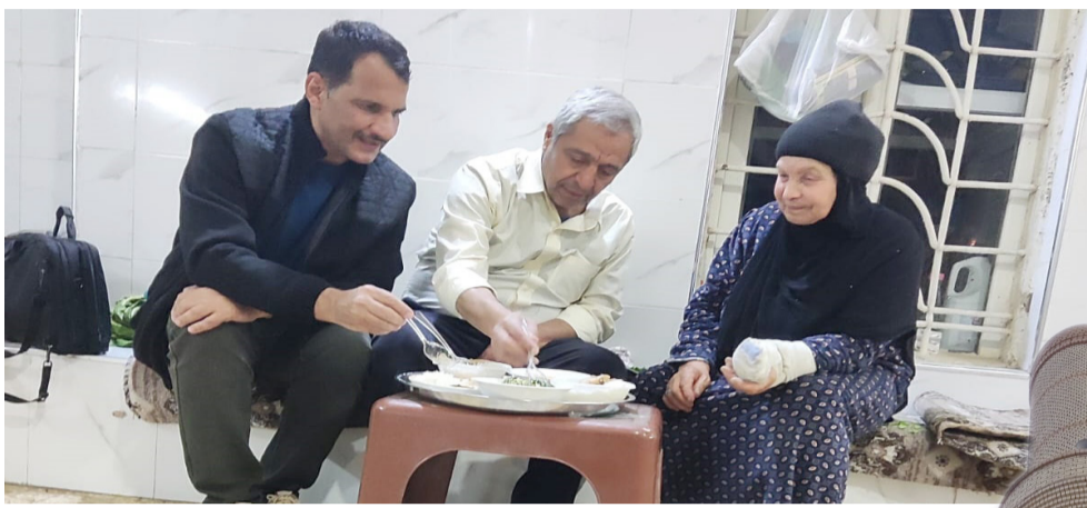
طعام: تناول وجبة طعام في المسجد

العصر ، ويقدم من 150 الى 200 وجبة طعام في الجامع وهناك عائلات تأخذ الطعام بواسطة القدور الى بيوتهم وهذه كانت بكثرة بعد احتلال تنظيم داعش الإرهابي للموصل والغربية، واغلب متبرعين ياتون بالمشروبات من المسطاعم ونحن بدورنا نوزعها حيث تمثل هذه العادة نوعا من التكاتف والترابط بين المسلمين في هذا الشهر الفضل والقبلة واليوم . العصر ، ويقدم من 150 الى 200 وجبة طعام في الجامع وهناك عائلات تأخذ الطعام بواسطة القدور الى بيوتهم وهذه كانت بكثرة بعد احتلال تنظيم داعش الإرهابي للموصل والغربية، واغلب متبرعين ياتون بالمشروبات من المسطاعم ونحن بدورنا نوزعها حيث تمثل هذه العادة نوعا من التكاتف والترابط بين المسلمين في هذا الشهر الفضل والقبلة واليوم .