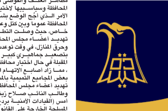
شعار كتلة السيادة