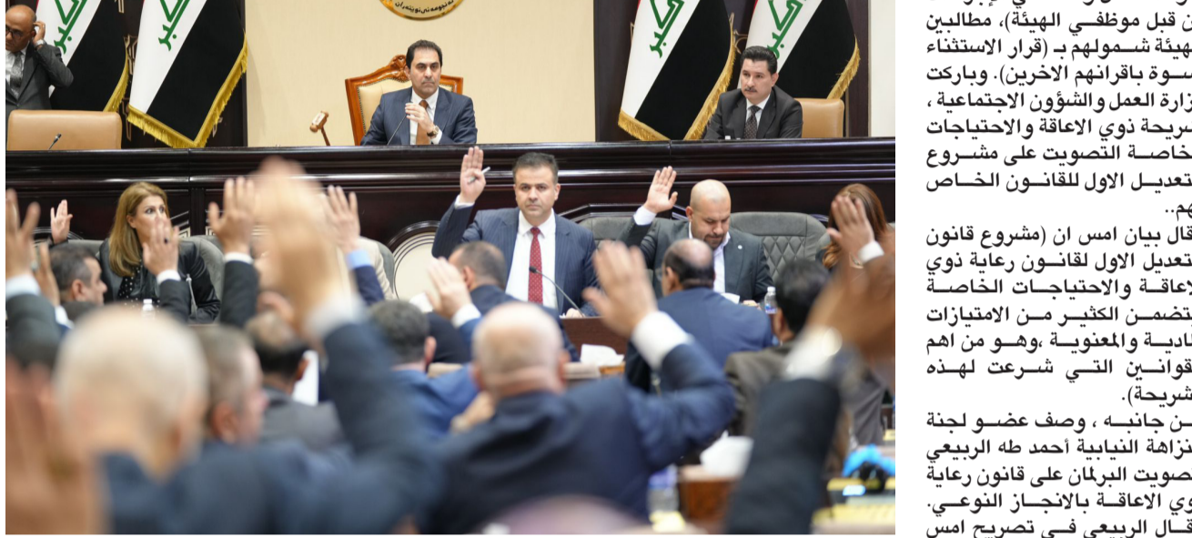
جلسة : احدى جلسات مجلس النواب

بغداد - قصي منذر ثمن ذوو الهمم امس ، استجابة مجلس النواب لمقترحات قدمتها جريدة (الزمان) باهتداء معاناة الشريحة المستفيدة من خلال تضمين امتيازات في تعديل قانون رعاية ذوي الاعاقة والإحتياجات الخاصة بعد سنوات من الحرمان. وقالوا لـ (الزمان) امس (نحن نوصي مجلس النواب على انصافنا بعد سنوات من المعاناة في الحصول على التقرير الطبي أثناء المشاهدة، وكذلك الاجراءات المعقدة في تجديد اجازة التفرغ، مؤكداً ان (الامتيازات الجديدة التي تشمل المستفيدين ضمن التعديل الجديد لو جاءت متاخرة لكنها ستسهم في تخفيف المعاناة عن ذوي الهمم وتخفف عن كاهل اسرهم انشاء اصطحابهم لانجاز اجراءات المعين التفرغ).