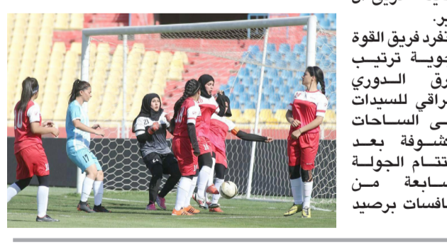
المنتخب العراقي للسيدات

بغداد- الزمان اعلنت لجنة المسابقات في الاتحاد العراقي لكرة القدم مواعيد مباريات الجولة الثامنة لمناقسات الدوري للسيدات على الساحات المشووفة والتي تم تحديدها يومي الجمعة والسبت . وتقام مباراتان يوم الجمعة المقبل الموافق 19 من الشهر الحالي، ويلاقى فريق امانة بغداد ضيفة فريق قتاة بغداد عند الساعة الثانية من بعد الظهر بينما ضيف فريق نطق الشمال على ملعبه فريق شهربان عند الساعة الثالثة عصرا . وتواصل المنافسات يوم السبت 20 نيسان الحالي باقامة مباراة واحدة تجمع فرقي القوة الجوية وضيفة فريق ال بدير . وينفرد فريق القوة الجوية ترتيب فرقي الدوري العراقي للسيدات على الساحات المشووفة بعد اختتام الجولة السابعة من المنافسات برصيد