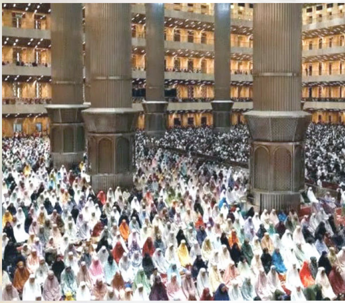
جانبا من صلاة التراويح في مسجد الاستقلال الكبير في اندونيسيا في احدى ليالي الشهر الفضيل

بغداد - الزمان لم تعد لعبة المحبيس الرمضانية حكراً على الرجال فقط، ففي تجربة فريدة من نوعها، شاركت مجموعة من النساء بتنظيم لعبة محبيس على قاعة قصة خون في المتحف الغدادي وقام بتنظيم الفعالية الرمضانية هذه فريق "نخلة وطن" النسوي للدرجات الهوائية مع تجمعات تمكين المرأة، تحت شعار (نساء تحيي التراث)، على انغام موسيقى "الجالسي الغدادي" وعزف على آلة الكمان قدمته إحدى المشاركات، كما تفاعلت المشاركات مع أجواء اللعبة