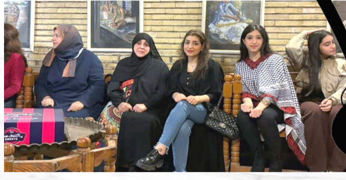
ملتقى: لقطات من ملتقى سينما الشباب الرمضاني

بغداد - الزمان لم تعد لعبة المحبيس الرمضانية حكراً على الرجال فقط، ففي تجربة فريدة من نوعها، شاركت مجموعة من النساء بتنظيم لعبة محبيس على قاعة قصة خون في المتحف الغدادي وقام بتنظيم الفعالية الرمضانية هذه فريق "نخلة وطن" النسوي للدرجات الهوائية مع تجمعات تمكين المرأة، تحت شعار (نساء تحيي التراث)، على انغام موسيقى "الجالسي الغدادي" وعزف على آلة الكمان قدمته إحدى المشاركات، كما تفاعلت المشاركات مع أجواء اللعبة