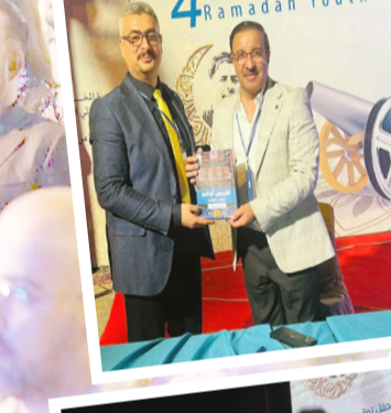
ملتقى: لقطات من ملتقى سينما الشباب الرمضاني

بعد ما يقرب العامين على انفصال النجمة الكولومبية شاكيرا عن حبيبها السابق جيرارد بيكيه، هاي هي تقف في حب ممثل بريطاني يصغرها بـ 16 عاماً فنشر موقع «ديلي ميل» البريطاني أخباراً تفيد وقوع شاكيرا في حب لوسيان لافيسكونت، حيث اشتملت علاقتهما في كواليس تصوير الفيديو المصور لأغنية الجديدة (بوترا) خاصة وإنهما طورا عن عدد من المشاهد الحميمية. فضلاً عن ذلك، استمتع الثنائي بوجبة عشاء في مطعم كاريوبي الإيطالي في مدينة نيويورك، وتآلفت بإطلاقاً لسوء، تآلفت من كورسيه وسترة سوداء نسقتها ببضائع أسود، وحملت في يدها حقيبة يد سوداء كبيرة وانتعلت حذاءً من الجلد الأسود، فيما أسندت خصلات شعرها الأشقر اللجدي على جانبي كتفها، ورغم الحب المتأجج بين الثنائي، إلا أن اصداق شاكيرا لقتن على مدى سير علاقتهما بوسيان، إذ يعتقدون أنه يستغلها من أجل الوصول إلى الشهرة والنجاح، خاصة وأن اسمه ارتبط بالعديد من الفنانات والنجمات، فمن وجهة نظرهم يرون أنه يحاول تسليق سلم الشهرة تدريجياً، فيما تقف شاكيرا في القمة كما يرون أن شاكيرا تتلصق بالزوج في الحب مهما كان الأمر، في حين أنها لم تتجاوز بعد حبها لبيكيه، وأن من حولها يدركون تماماً أن لوسيان مجرد تجديد لشبابها.