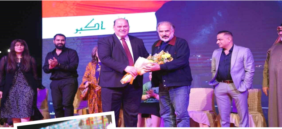
ملتقى: لقطات من ملتقى سينما الشباب الرمضاني

كشف الممثل المصري محمد ممدوح أنه خسر ما يقارب 45 كيلو غراماً من سبب المياه فقط، إذ كان يستهلك يومياً 7 لتر من الماء، في أوقات معينة، وخلال 17 يوم تقريباً استطاع فقدان هذا الوزن ولقدت إلى أنه تخلى عن السموم والبروتينات في جسمه، فضلاً عن تخليه عن السجائر وتوقف عن تناولها، فضلاً عن نظام غذائي معين لخسارة الوزن، لكنه قد يجبر على ذلك في حال أخبره صناع الأعمال أنه بحاجة لخسارة بعض الوزن من أجل أدواره وأوضح أنه اتبع نظام غذائي لتجسيد شخصية «أمين» في مسلسل «جراند أوتيل»، إذ رأى أنه بحاجة لبيد أكثر نحالة.