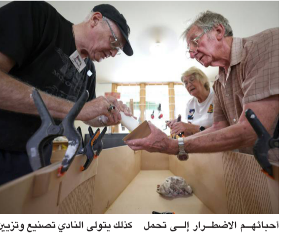
أبحاثهم الاضطراب إلى تحمل تلك بقوى النادي تصنع وتزين التوابيت للعائلات الحزينة في نيوزيلندا.